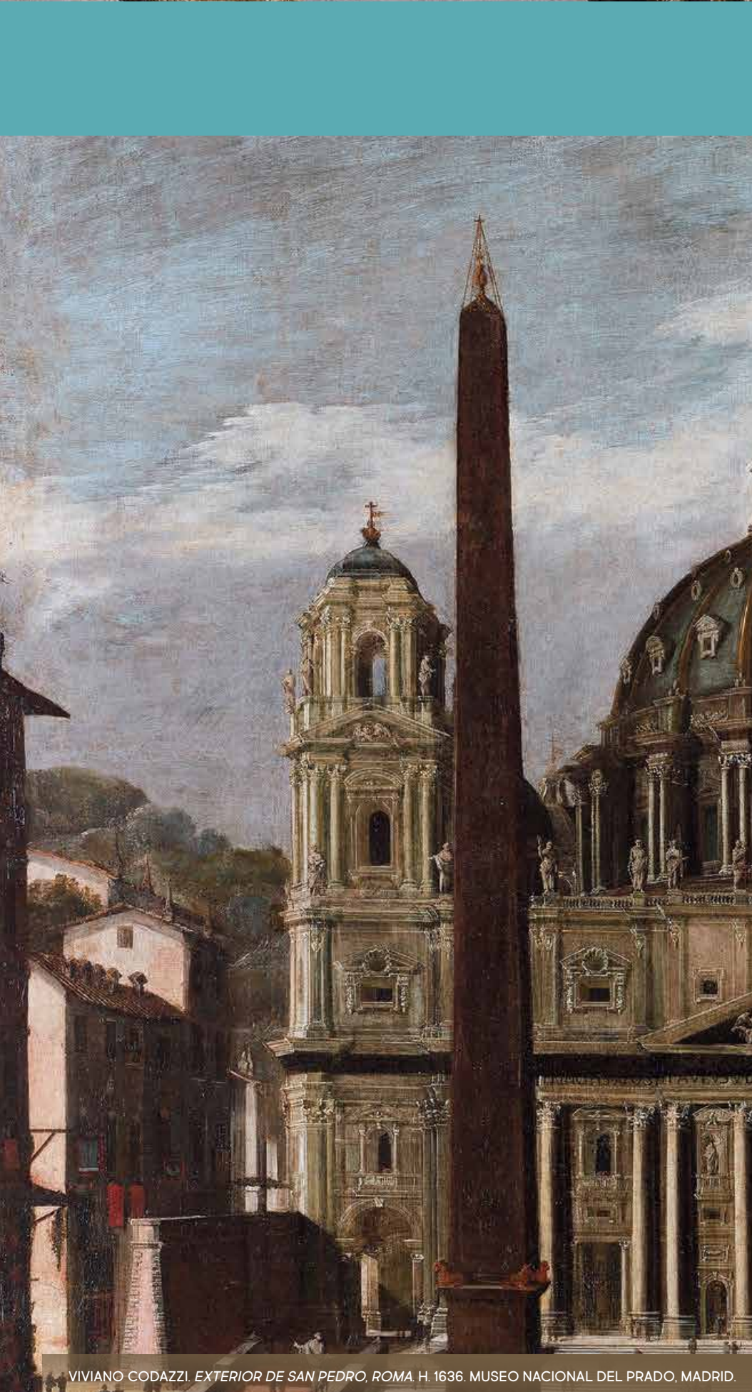
VIVIANO CODAZZI. EXTERIOR DE SAN PEDRO, ROMA, H. 1636. MUSEO NACIONAL DEL PRADO, MADRID.