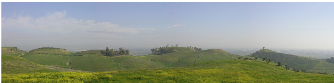
Figura 2. Cornisa Norte del Aljarafe sevillano.

El ámbito de estudio seleccionado para el ensayo metodológico ha sido el sector norte de la Cornisa del Aljarafe y su entorno, que forma parte del área metropolitana de Sevilla. Éste es un espacio metropolitano de fuertes dinámicas y procesos, sobre todo de expansión del suelo edificado, y un territorio sin una ordenación de carácter metropolitano que establezcan objetivos generales de actuación. En este marco de continuas transformaciones, los valores paisajísticos y el medio perceptual se ven fuertemente degradados. La importancia de la Cornisa Norte del Aljarafe es doble: por un lado, tiene una relevancia paisajística como escenario, mirador e hito y, por otra parte, juega un papel fundamental, dentro de la aglomeración urbana de Sevilla, en la diversificación del paisaje y en la compensación frente a los procesos de homogeneización promovidos por la expansión del suelo urbano. Además, dos de los principales valores paisajísticos de este espacio son la cornisa y el escarpe bien desarrollados que presenta y que les valió la calificación de “paisaje sobresaliente” dentro del Catálogo de Espacios y Bienes Protegidos del Plan Especial de Protección del Medio Físico de la Provincia de Sevilla