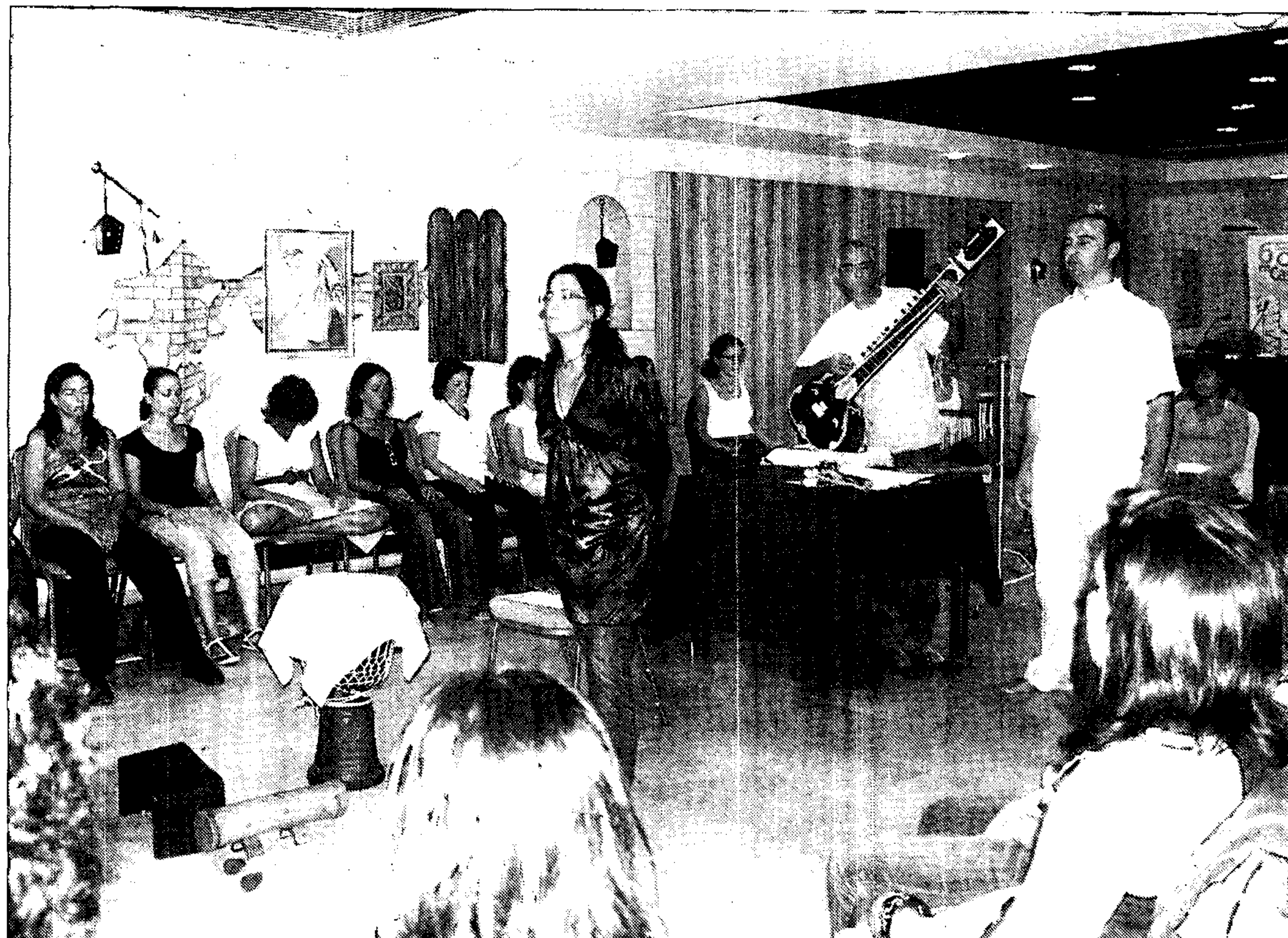
EN VIVO Y EN DIRECTOR. Participantes del curso de musicoterapia durante una de las sesiones.