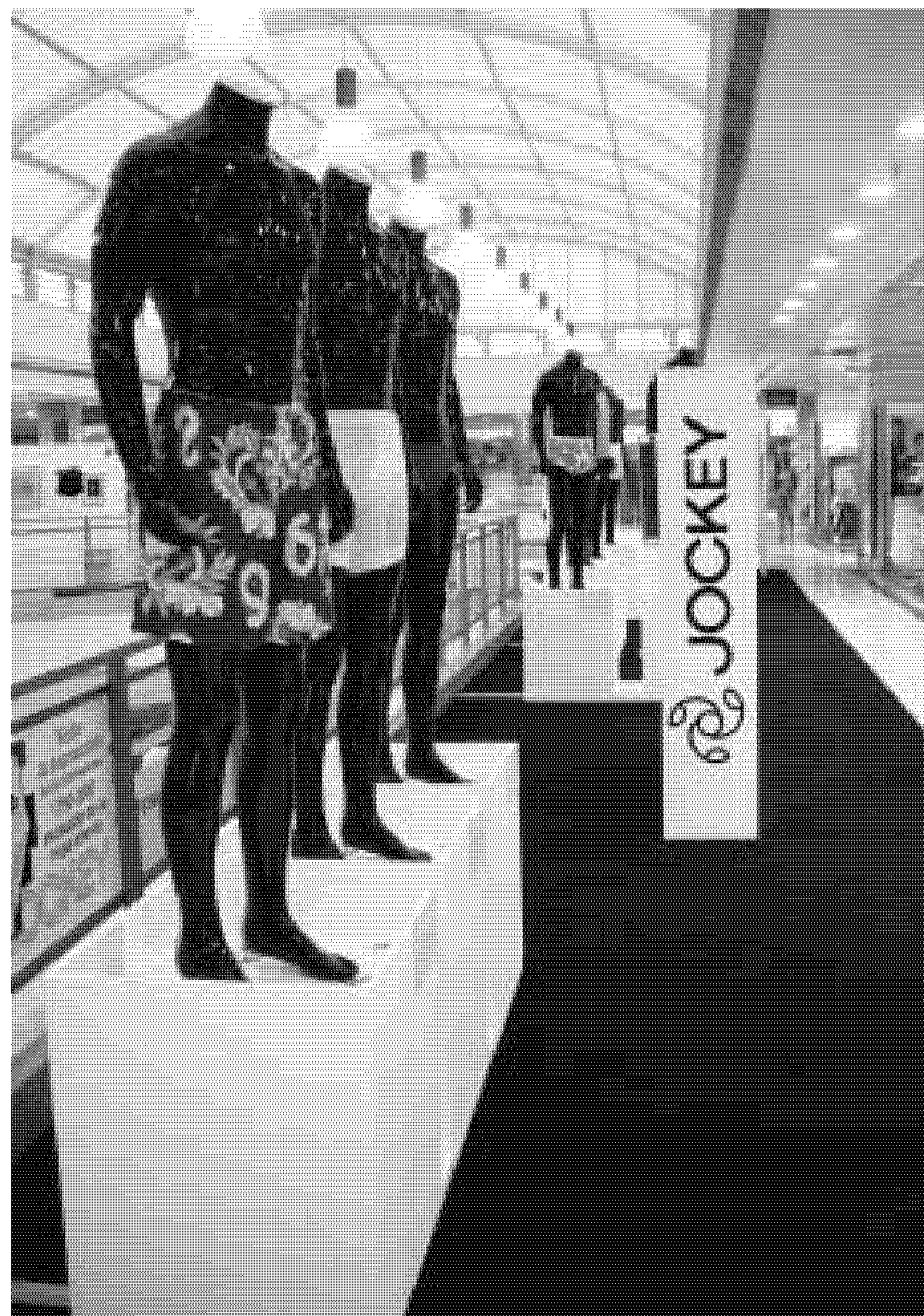
Calzoncillos de ayer y de hoy reunidos en la primera planta de la tienda. M. G.

El Corte Inglés y la firma Jockey celebran los 75 años del slip con una muestra histórica sobre ropa interior para hombres