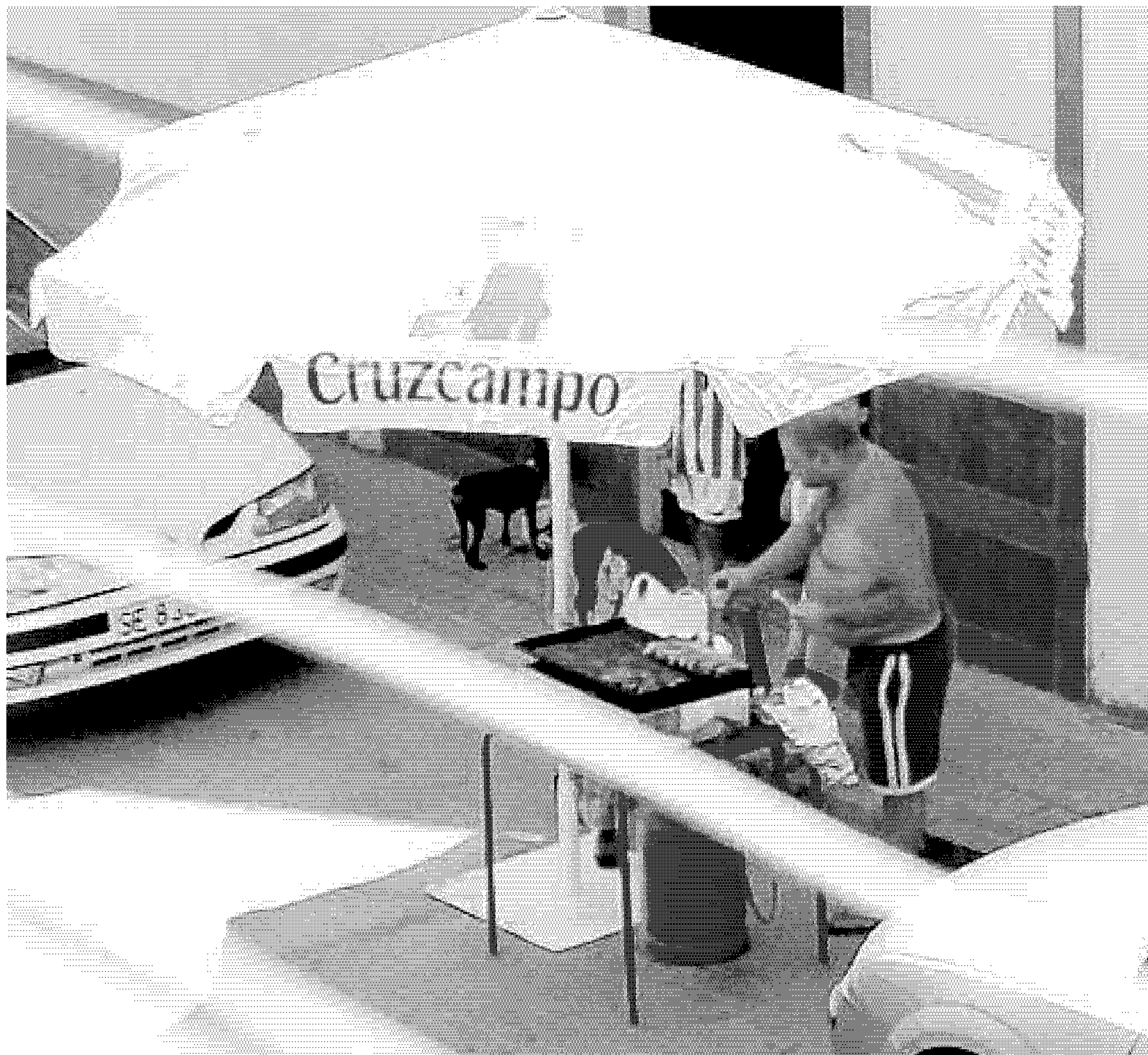
En Madre de Dios, la calle puede convertirse en una barbacoa improvisada

so del olor de la comida, o hacer reuniones de amigos en torno a un paquete de pipas, sin de que por medio haya un ordenador, una videoconsola o un teléfono móvil. Algunas de ellas de dudoso gusto, otras tantas incompatibles con carriles bici o bocas de metro, pero todas, al fin y al cabo, reflejos de una memoria histórica de las de verdad.