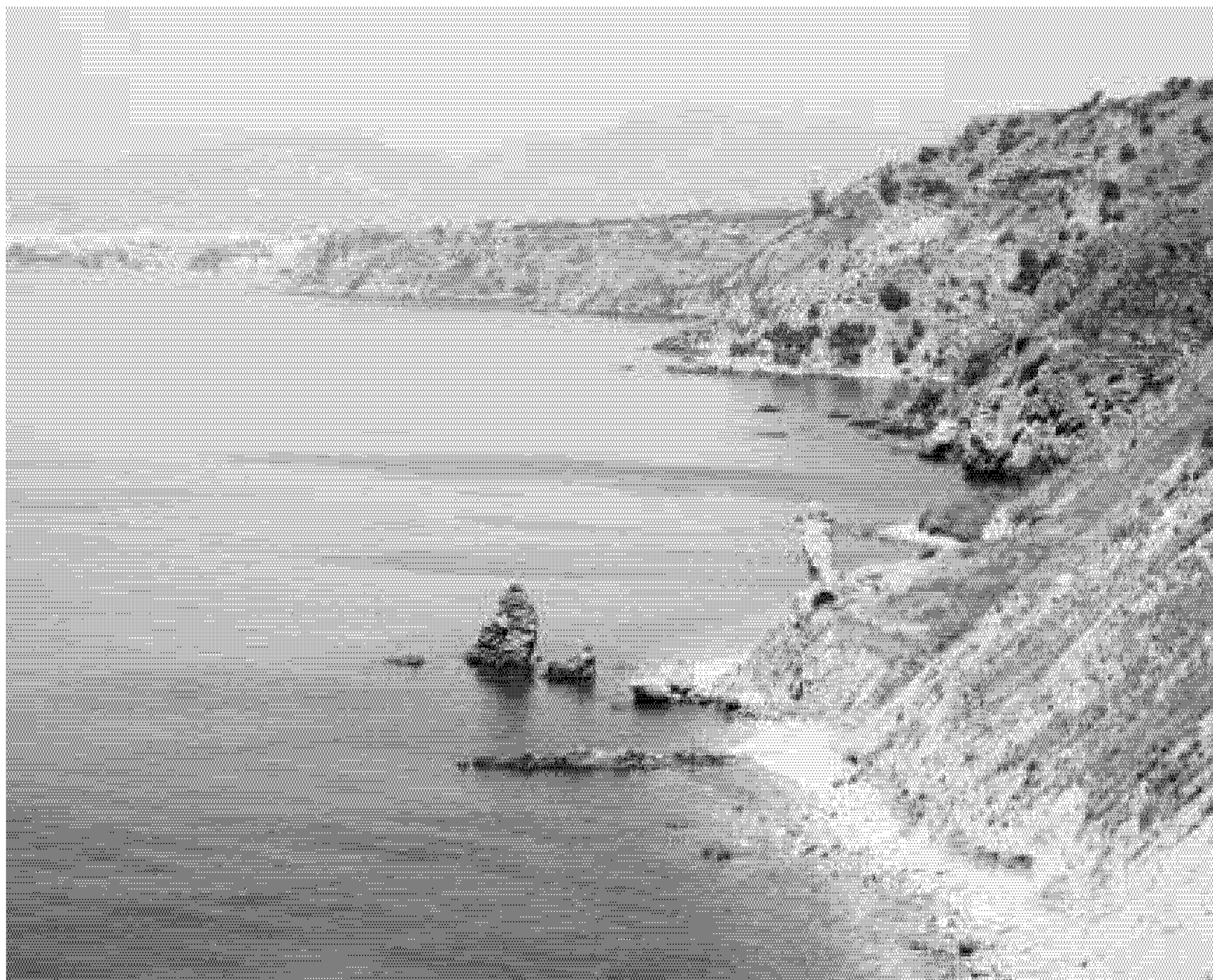
Acantilados de Maro vistos desde el balcón del Río de la Miel.

El programa comprende una visita guiada al espacio natural, las actividades de turismo ambiental y el material deportivo, informativo y divulgativo complementario, y todas estas actividades estarán desarrolladas y guiadas por monitores especializados y con materiales específicos. Las propuestas que se llevarán a cabo los días 11, 12, 25 y 26 de julio son las siguientes: en el Paraje Natural Acantilados de Maro Cerro-Gor-