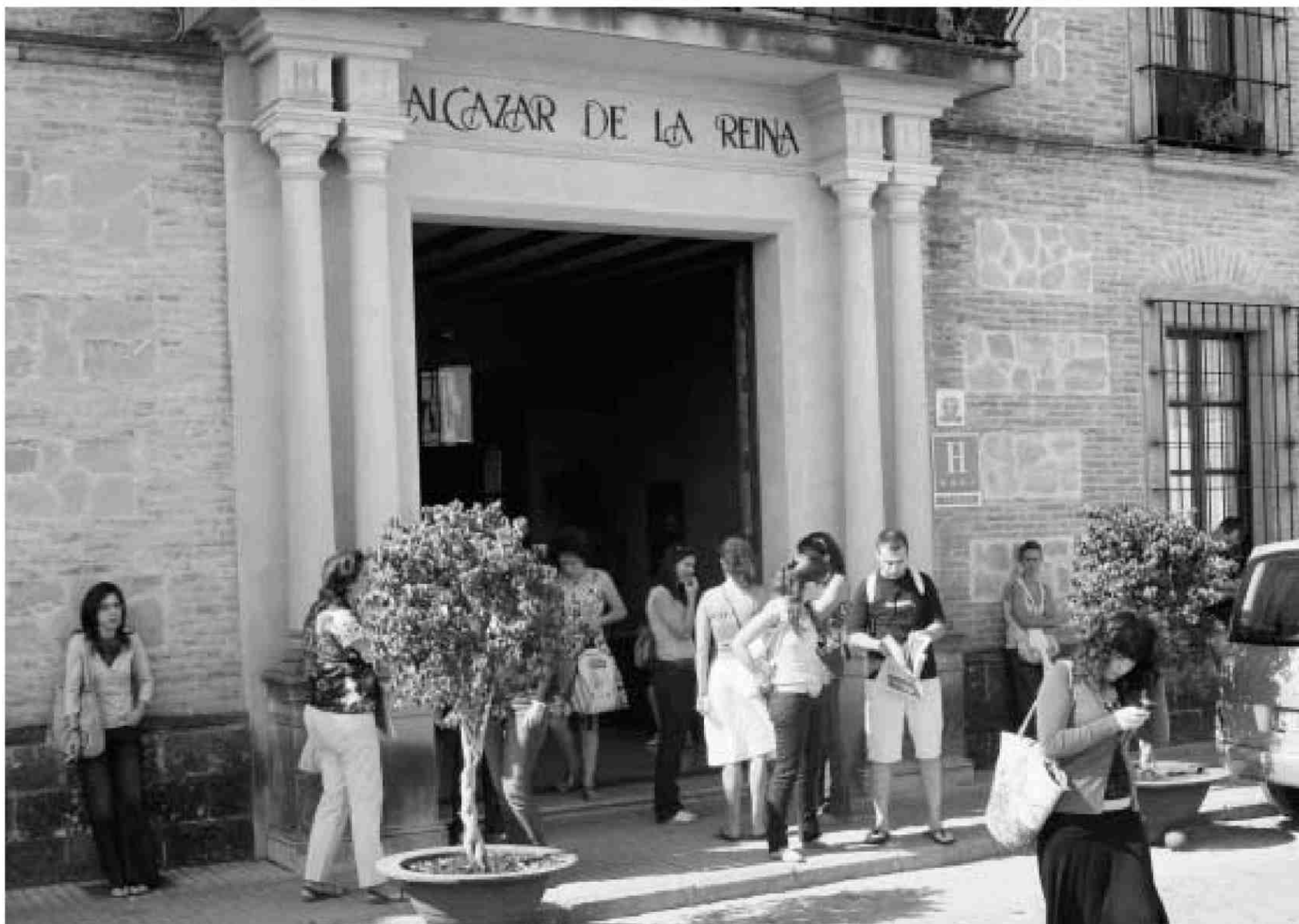
Algunos cursos de la Olavide en Carmona se realizan en el Alcázar de la Reina.

Un ejemplo de Universidad unida a la ciudad es la Pablo de Olavide de Carmona. "Utilizando