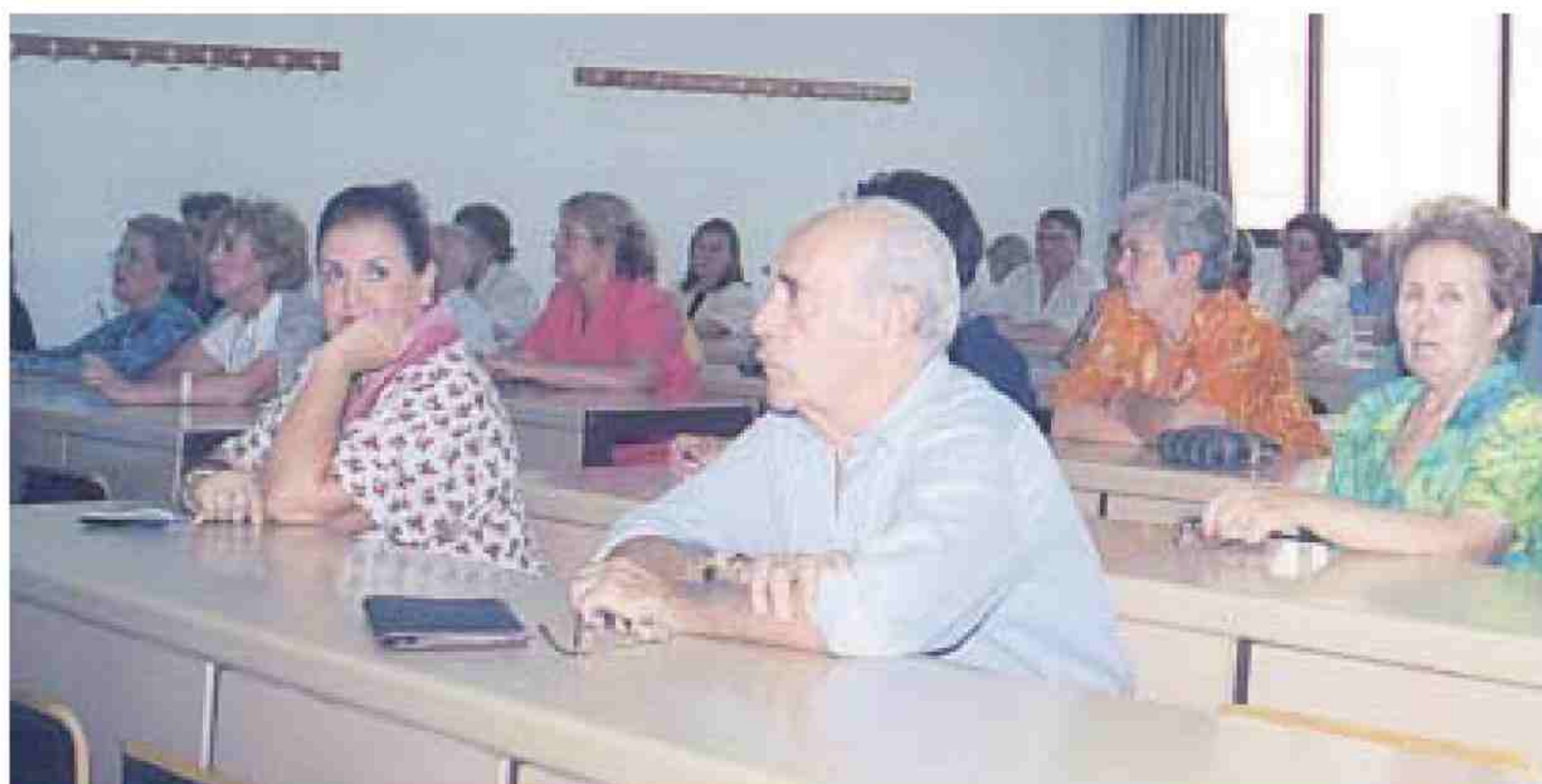
Los cursos de verano de la Olavide en Carmona suelen contar también con alumnos universitarios.

ses del curso suele ser prácticamente nulo. Por otro lado, el Aula Abierta de Mayores de la Pablo Olavide está presente en las localidades de Alcalá de Guadaíra, Aznalcóllar, Carmona, El Coronil, Gerena, Gilena, Gines, La Rinconada, Marchena, Montellano y Salteras. Hay posibilidad de realizar también cursos de ampliación en Carmona y Marchena, para aquellos que quieran seguir profundizando en los conocimientos adquiridos.