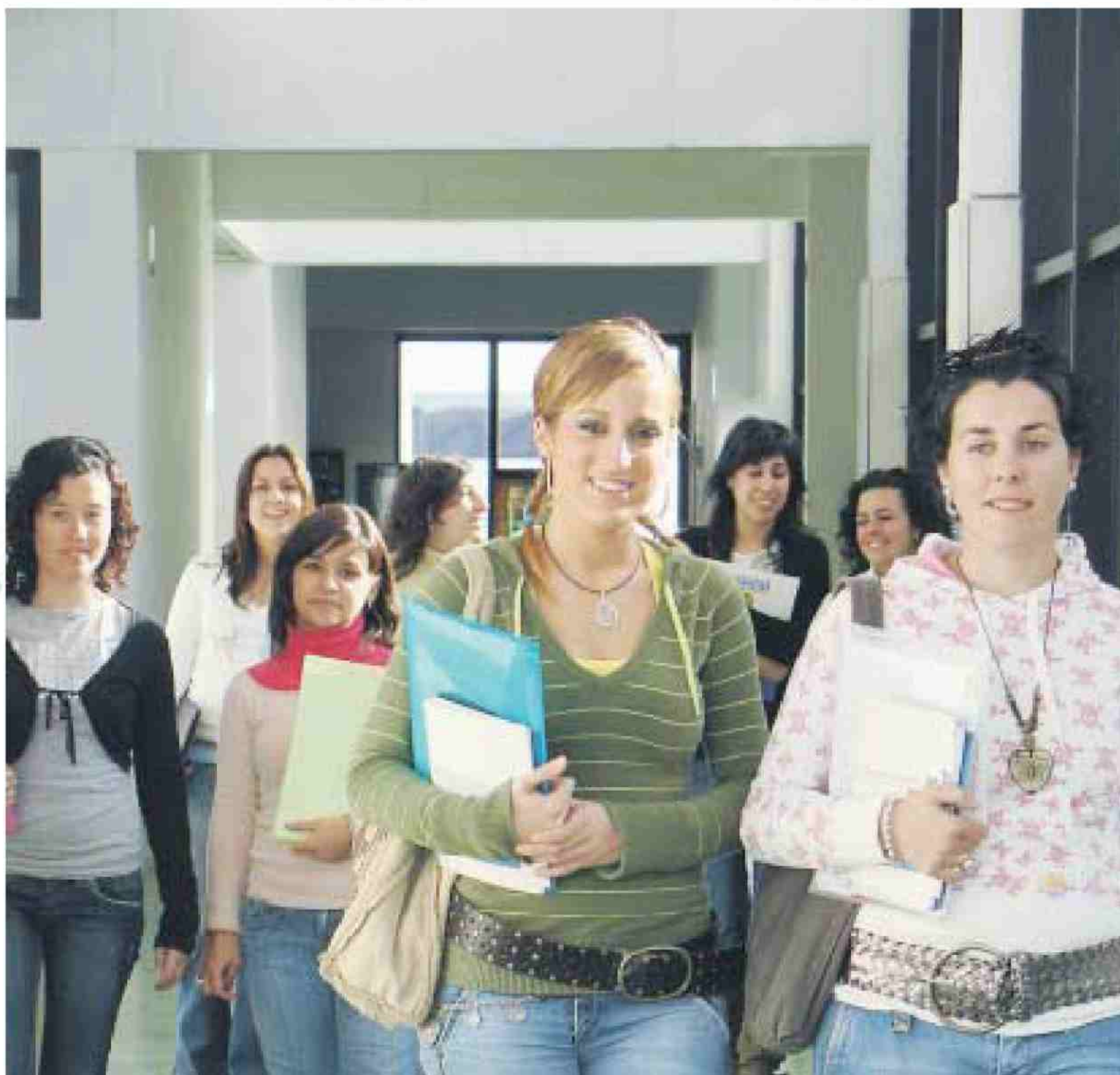
Varias alumnas de San Pablo-Ceu en el campus de Bormujos.