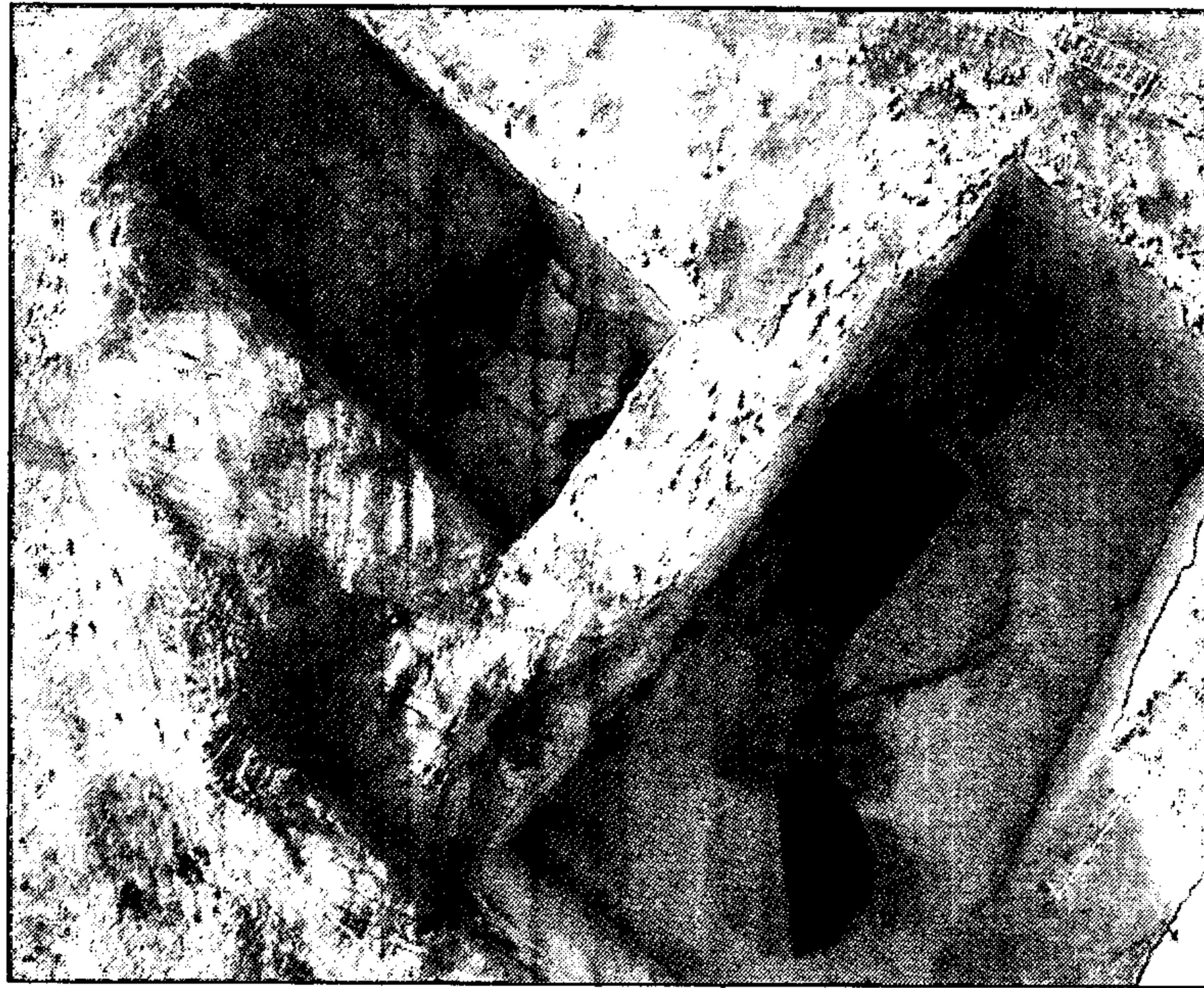
Visión cenital del yacimiento del dolmen de Montelirio.

La Fiscalía de Medio Ambiente, Urbanismo y Patrimonio Histórico, igualmente, reclamaba en su memoria de 2008 «mayor comunicación» con los organismos autónomos para evitar casos como el de la destrucción de los hornos almohades descubiertos en el entorno de la Puerta de Jerez con motivo de la peatonalización del casco histórico de Sevilla, caso investigado por el Juzgado de Instrucción número 20 al entender el Ministerio