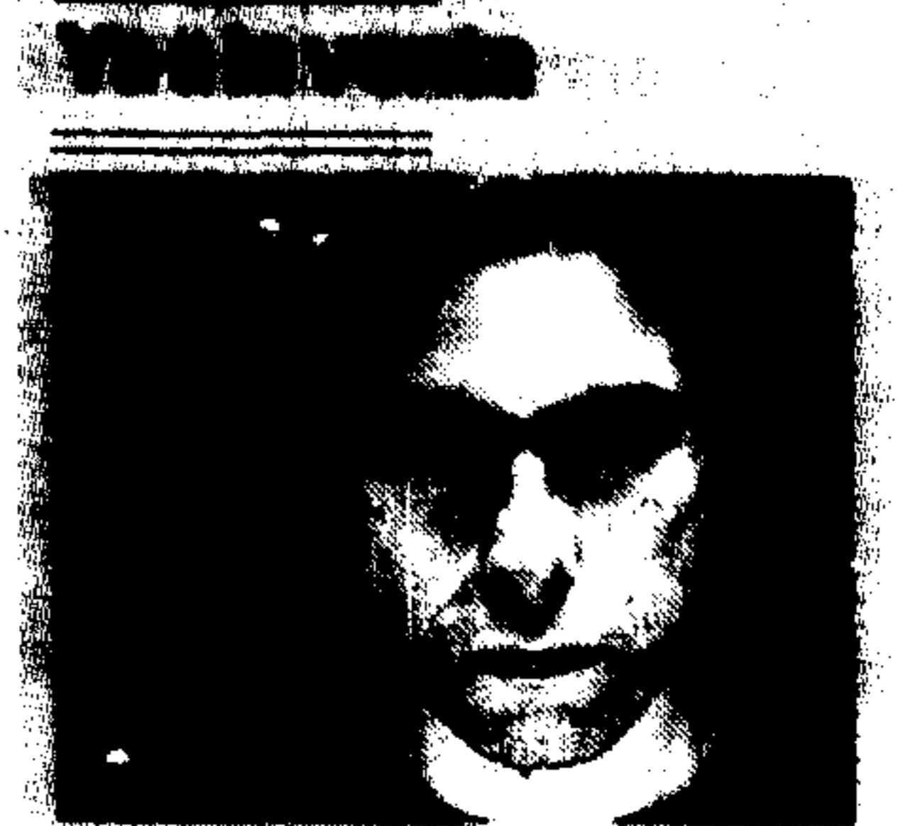
ANDRÉS CALAMARO, DE CONCIERTO EN MURCIA

El cantante argentino actuará en Balsicas (Murcia) el 26 de septiembre y presentará su disco 'Obras Incompletas' TICKTACKTICKET/ 25,90€