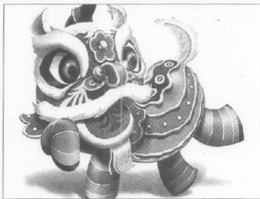
AÑO NUEVO CHINO. Representación oriental del buey.

■ Si tiene un amigo o un vecino chino, corra a felicitarlo porque él y sus paisanos celebran hoy la entrada de un nuevo año: se va la rata (a que todo lo carcome, incluida la economía) y entra el buey (el trabajo). A ver si es verdad.