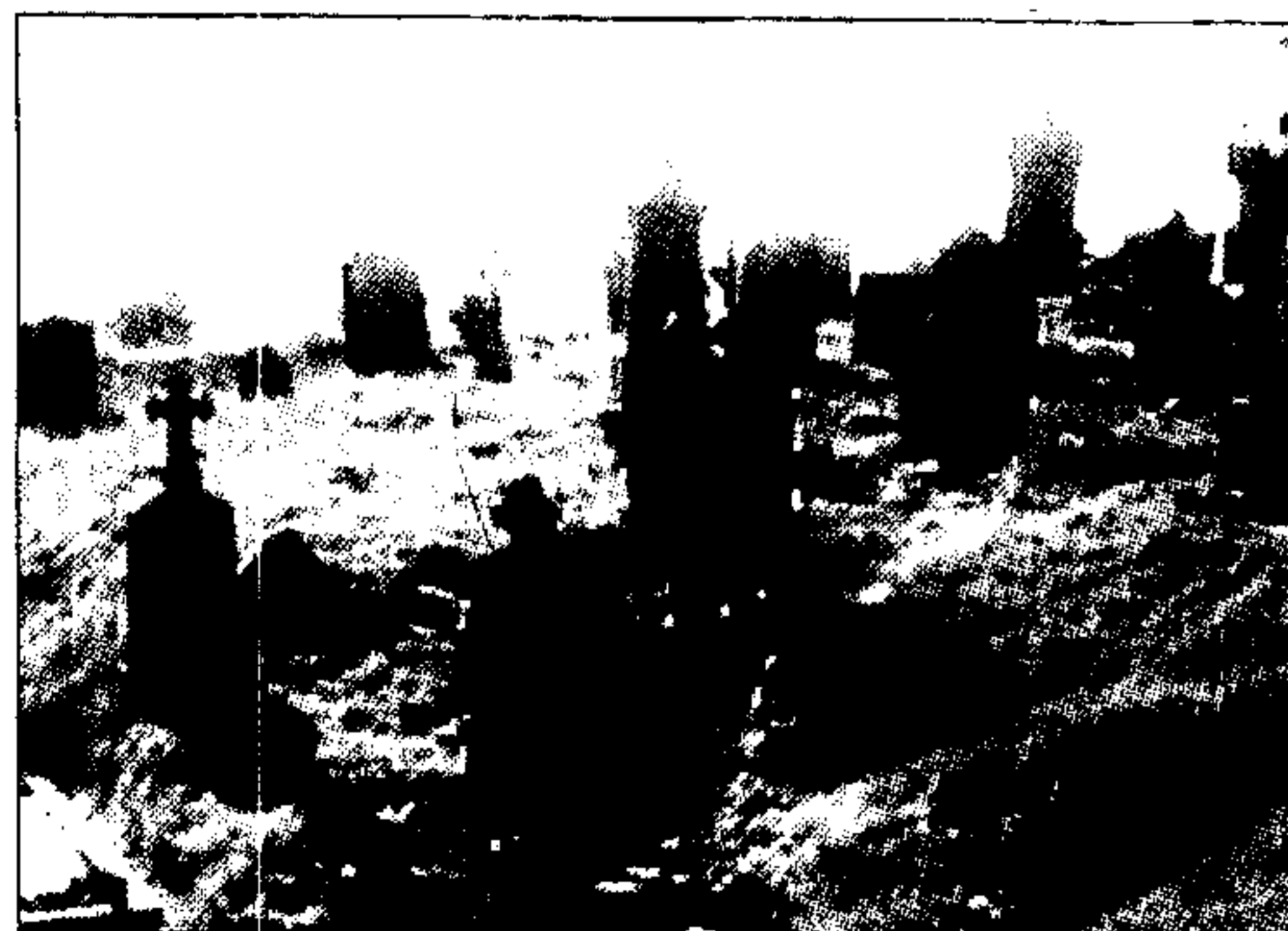
Una escena de 'El pico de las viudas'.

A partir de las 22.30 horas el patio central de la Casa Palacio de los Briones de Carmona se convertirá en cine de verano con la proyección de la película Los Santos Inocentes , de Mario Camus, dentro del ciclo 'Desigualdad y exclusión social'. Esta actividad se enmarca en el programa 'Compromiso: Ciencia y Conciencia', que se desarrolla de manera paralela a los cursos de verano de la Universidad Pablo de Olavide con la colaboración de la delegación de Cultura del Ayuntamiento de Carmona. La entrada es gratuita hasta completar aforo.