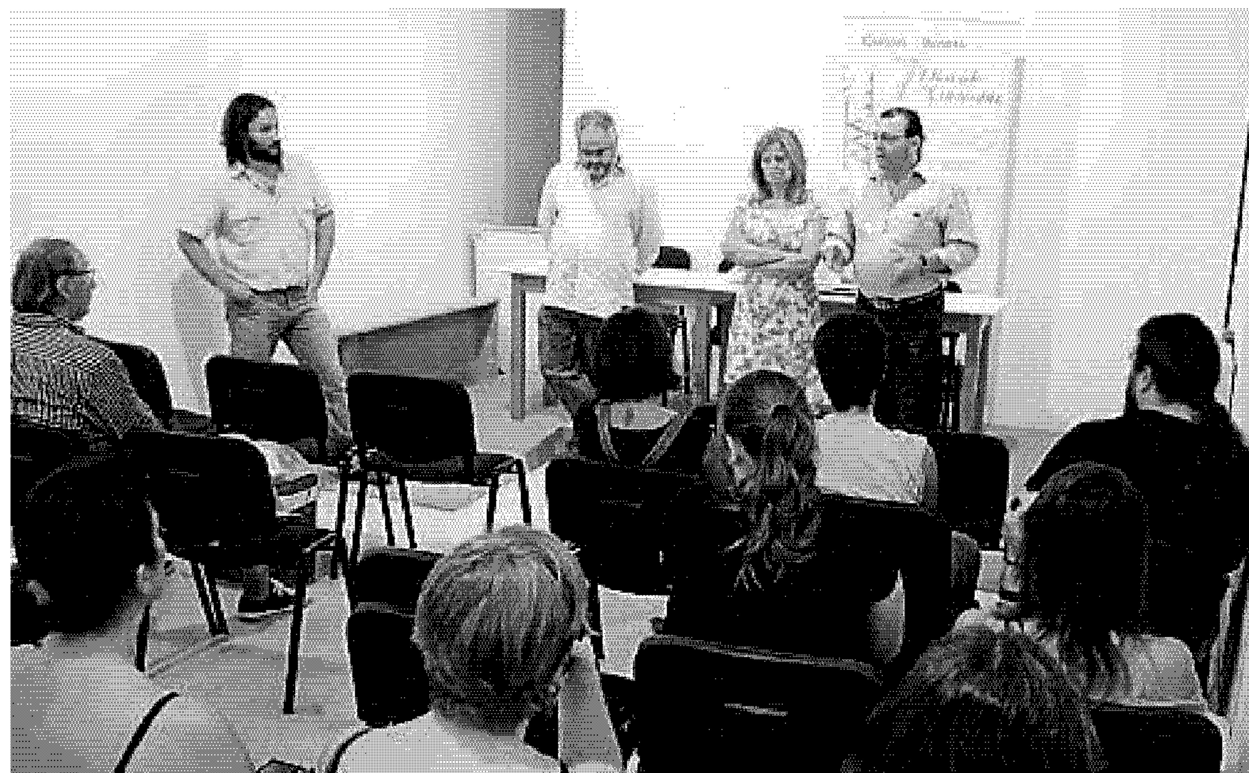
El curso comprende una parte teórica y una práctica en la Ronda del Cenicero