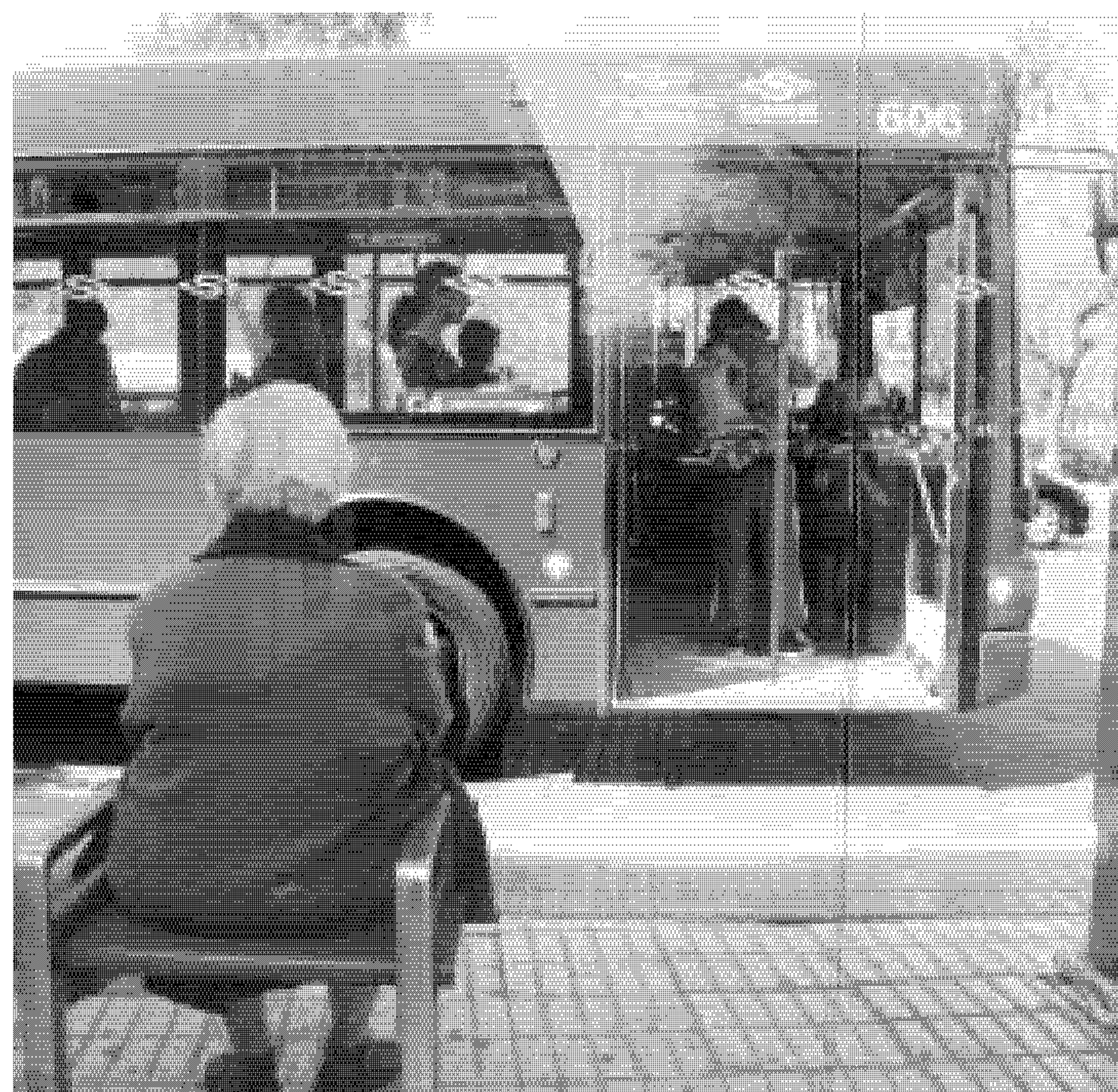
Una mujer aguarda el autobús en una parada de Tussam.

El acceso a este tipo de datos en tiempo real es posible gracias al Sistema de Ayuda a la Explotación implantado en la flota, que permite mantener localizados de manera permanente a todos los autobuses mediante un posicionamiento realizado por GPS y la transmisión por una red de radio de los datos de explotación hasta el centro de control.