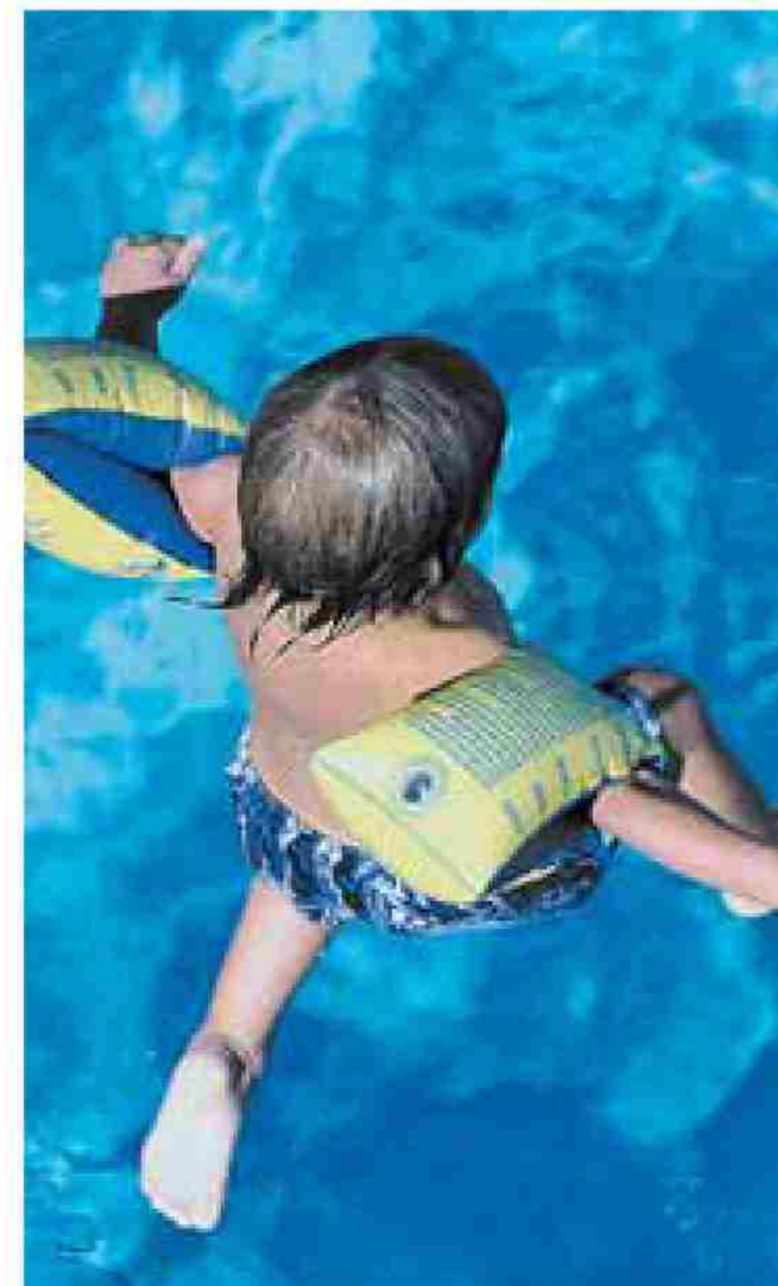
Hay que extremar las medidas de higiene.

muy nocivas. Los síntomas que alertan de la presencia de estas infecciones oculares son la rojez de ojos, el escozor, la sensación de cuerpo extraño, el lagrimeo o la hipersensibilidad a la luz. "Debemos extremar las medidas higiénicas, no compartir toalla para evitar contagios, acostumbrarnos a las gafas de natación y usar gafas de sol oscuras con filtro UV y que cubran el ojo por completo", señala el doctor Llovet.