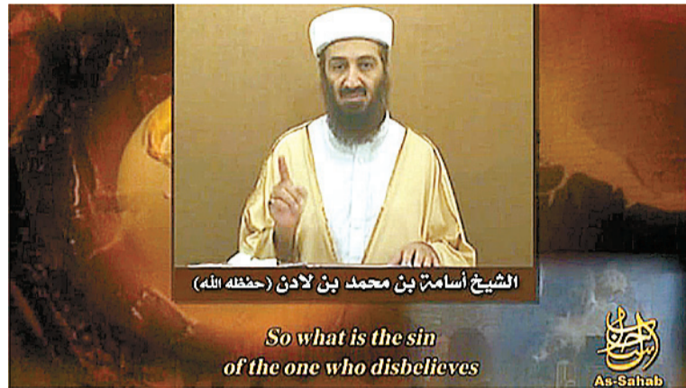
Bin Laden, en uno de sus últimos videos con motivo del sexto aniversario del 11-S. El último mensaje es una grabación distribuida por un foro radical de Malasia.

En uno de sus pasajes, Bin Laden alienta a los yihadistas a seguir actuando, y asegura que el declive de Estados Unidos es inevitable y "no