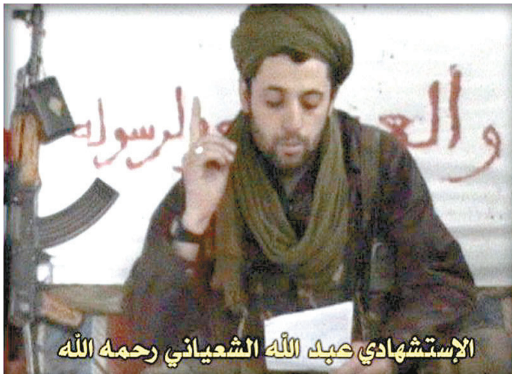
Vídeo propagandístico de la organización Al Qaeda en el Magreb, uno de los grupos que más directamente se ha referido a la “ocupación” española de los territorios “islámicos” de Ceuta y Melilla.

La segunda categoría se centra en los mensajes que han amenaza-