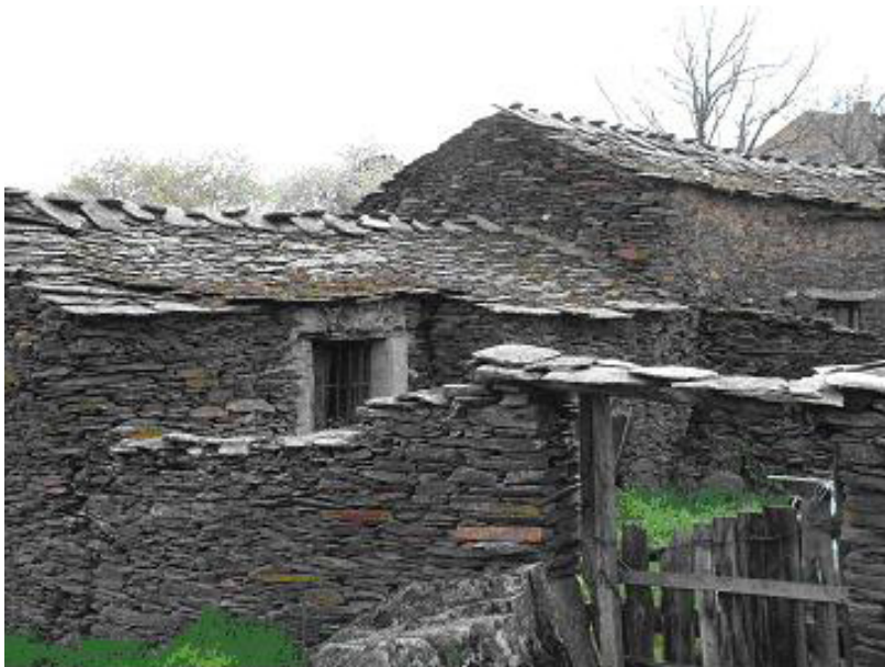
Campillo de Ranas.

existen dos zonas con características propias que las hacen en parte diferentes.