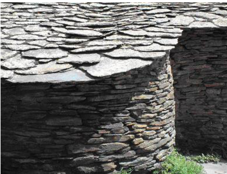
Horno manifestado al exterior.

La pizarra va asentada con barro sobre la ripia.