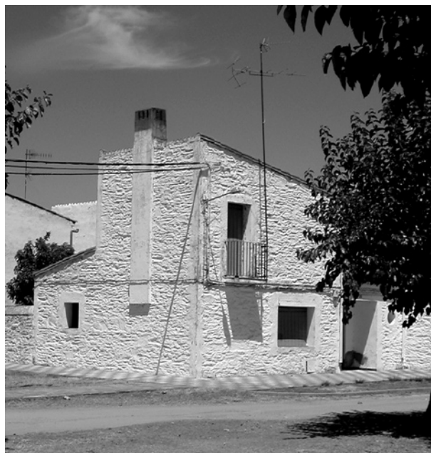
50 años después. Vegaviana (Cáceres). Julio de 2005.