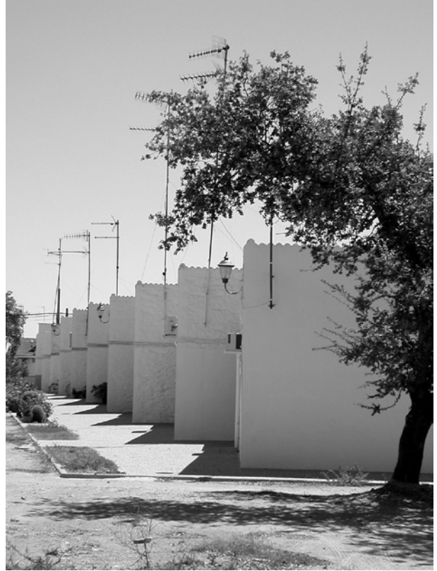
La vida tiene la palabra. Vegaviana (Cáceres). Julio de 2005.

Vida y tradición (arquitectura popular) formaron al arquitecto. El arquitecto concibió y dio paso al hombre. Su vida tiene la palabra.