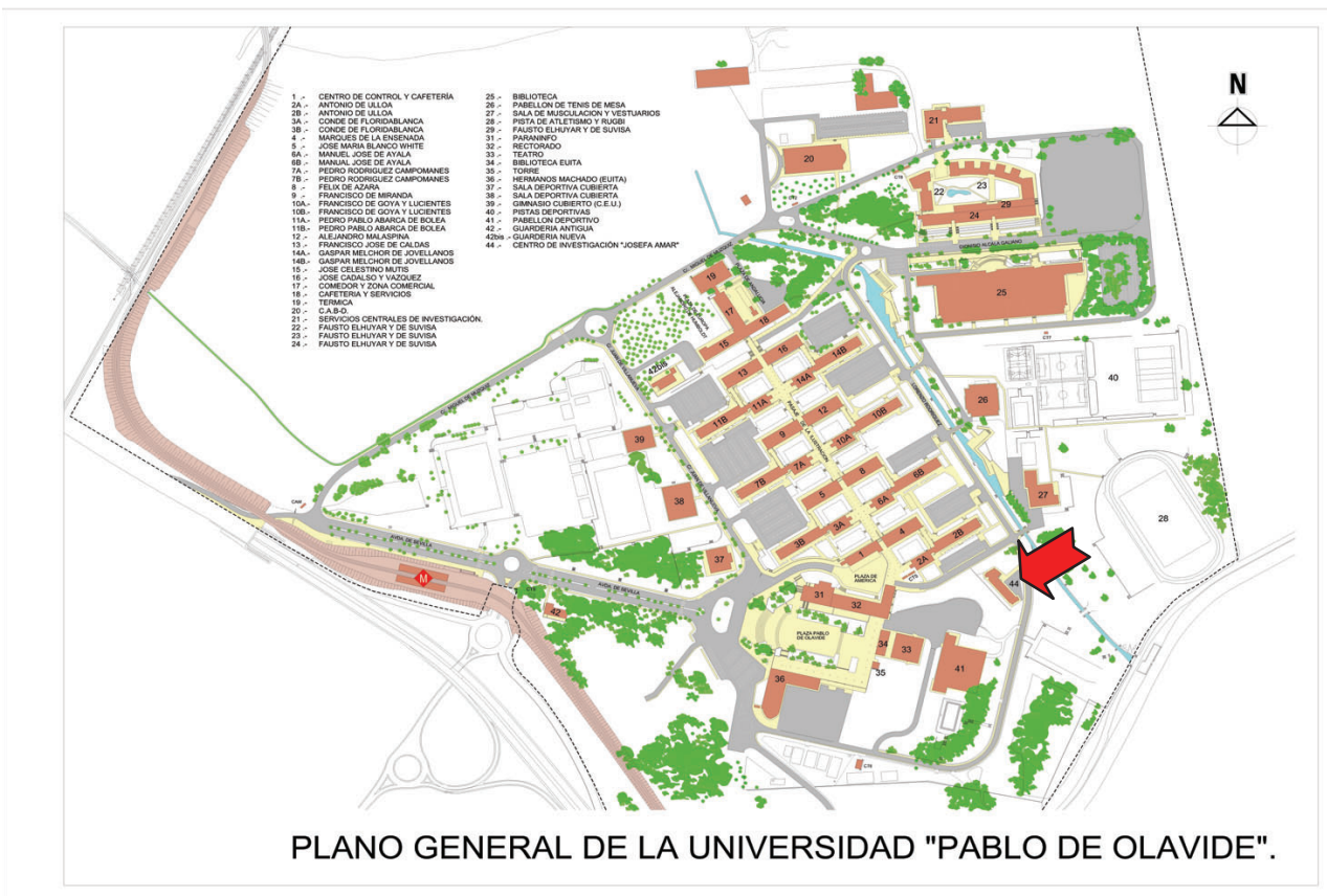
PLANO GENERAL DE LA UNIVERSIDAD "PABLO DE OLAVIDE".