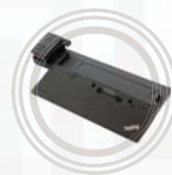
Estación de acoplamiento ThinkPad Ultra Dock