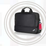
ThinkPad Essential Topload