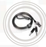
Candado de cable Microsaver DS