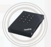
Unidad de disco duro segura para ThinkPad con conexión USB 3.0