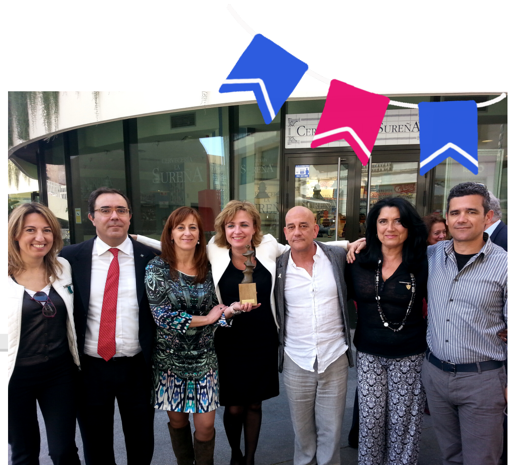
FOTO INSTITUCIONAL DE LA RECOGIDA DEL PREMIO MERIDIANA EN EL CENTRO DE SEVILLA. 8M 2014

NOTA DE PRENSA RESULTADO DE LA EXPOSICIÓN PLAZA DOLORES IBÁRRURI. 8M 2014