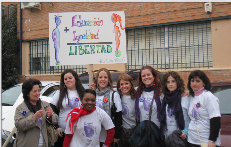
Primer cortejo Flora en la marcha 8M

EN EL BARRIO; COORDINADORA DE MUJERES, MARCHAS, RECONOCIMIENTOS Y CENTROS EDUCATIVOS