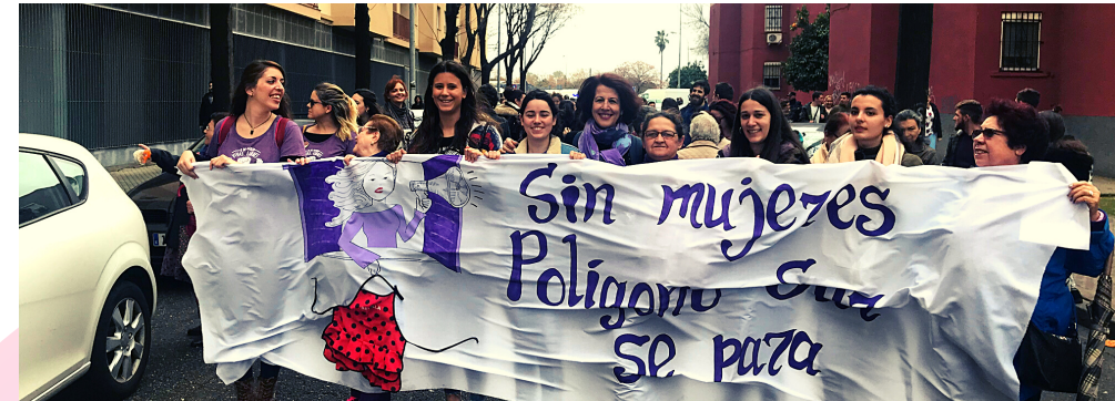
PARTICIPACION EN MANIFESTACIONES EN EL BARRIO Y EN EL CENTRO DE SEVILLA CON MOTIVO DE LAS HUELGAS GENERALES. 8M 2018 EN ADELANTE

PARTICIPACIÓN EN "NOSOTRAS SOMOS RADIO ABIERTA" Y II ENCUENTRO ESTATAL DE MUJERES RADIANTES. ORGANIZADO POR LA ASOCIACIÓN ENTRE AMIGOS CON LA COLABORACIÓN DEL CEIP ANDALUCIA Y LA RESIDENCIA. 8M 2017 Y 2020