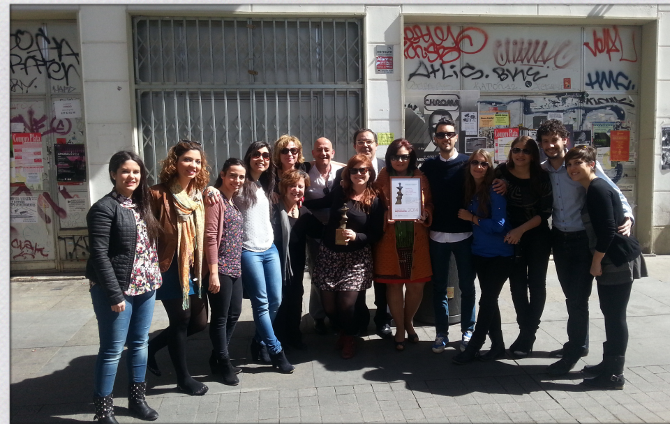
Foto de familia con el premio Meridiana

Por eso hemos escogido como documento del mes el "Premio Meridiana" que recibimos en 2014 por parte del Instituto Andaluz de la Mujer en la modalidad "Iniciativas contra la exclusión social"