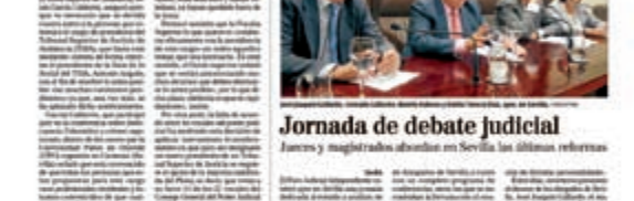
Jueces y magistrados andaluces en Sevilla los últimos reformados.