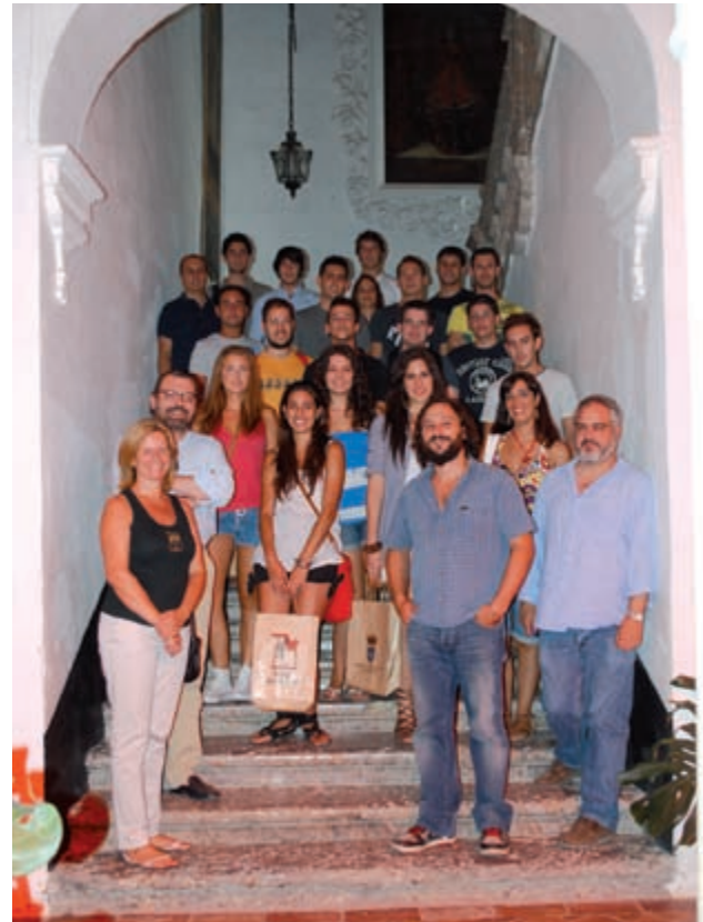
Estudiantes y responsables del curso de Arqueología de campo, en las dependencias del Museo de la Ciudad.

En cuanto a la gestión, la media global es de 3,97 sobre 5. La mayor puntuación en este campo, con un 3,95, ha sido para la valoración de las instalaciones empleadas, ubicadas en la casa palacio de Los Briones