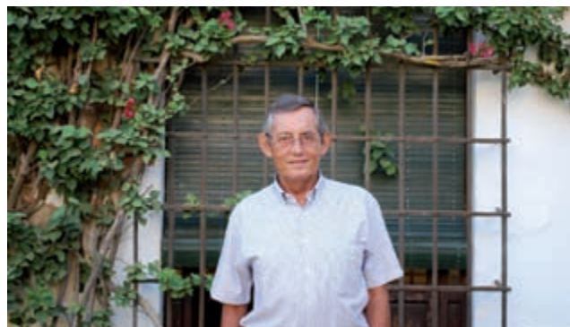
El biólogo Miguel Delibes de Castro participó en los cursos de verano.

Entre los estudiantes matriculados, siguen predominando las mujeres (58,84 por ciento) sobre los hombres (41,15 por ciento). Respecto al lugar de procedencia de nuestro alumnado, observamos un excelente nivel de participación de estudiantes de otras provincias andaluzas, españolas y el extranjero, alcanzando el 26,13 por ciento, lo que nos confirma que los planes de expansión y difusión de la actividad, desarrollados