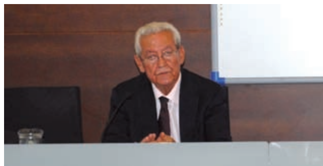
El ex presidente de la Junta de Andalucía, Rafael Escuredo, impartió la lección magistral en la apertura del curso académico de la EAGPA

La EAGPA tiene como objetivo principal ofrecer una respuesta a la demanda de formación por parte de gestores y altos directivos de organismos públicos y privados, así como cargos electos que necesitan dar respuesta a los retos nuevos que aparecen en su ámbito de actuación.