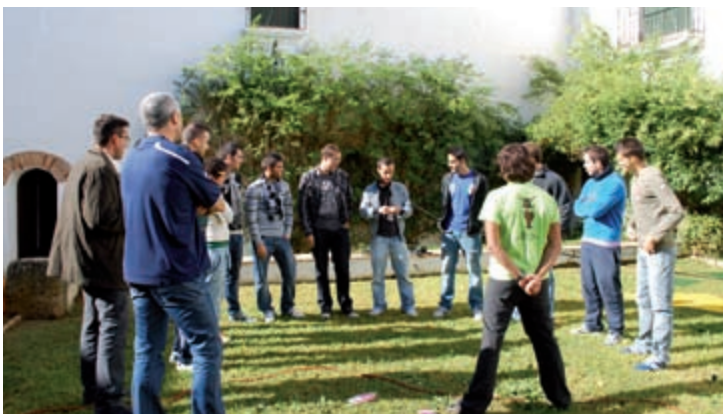
Los alumnos del curso de deportes hicieron prácticas en el patio trasero de la Casa de los Briones.

• 7-11 de junio de 2010. Celebración del V Curso Nacional de Genética “Genética de la conservación” , organizado por profesores de la UPO, la Universidad Complutense de Madrid y la Universidad de Vigo y que congregó a más de 40 expertos de diferentes universidades españolas.