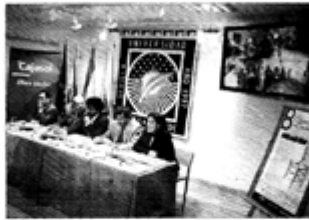
Alumnos en una clase. Foto: Berthany Pineda. Agencia, prensa y publicidad, agosto de 2017

La crisis y las redes sociales marcan los cursos de verano