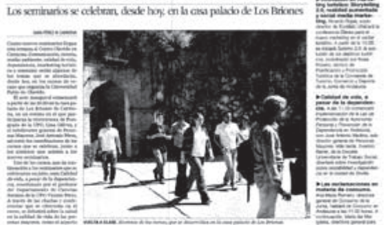
Un grupo de personas en la Casa Palacio de Los Briones, sede de los cursos.

Los seminarios se celebran, desde hoy, en la casa palacio de Los Briones