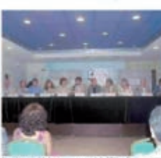
Una sesión de los cursos de verano de la Olavide.

«Seis nuevos cursos irán a la casa Palacio de los Bertrams, con el tema que van de la crisis a el flamenco»