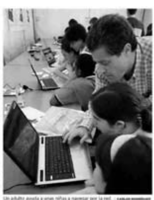
Un adulto ayuda a unas niñas a navegar por la red.

Expertos de la Universitat alertan de que los niños se sirven del ordenador y los móviles para hacer daño a sus compañeros