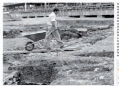
Un arqueólogo trabaja en el yacimiento de Cercadilla en una zona de obras.

El experto de la Gerencia de Urbanismo asegura que las construcciones ilegales están acabando con las zonas arqueológicas, como ocurrió con la nueva estación