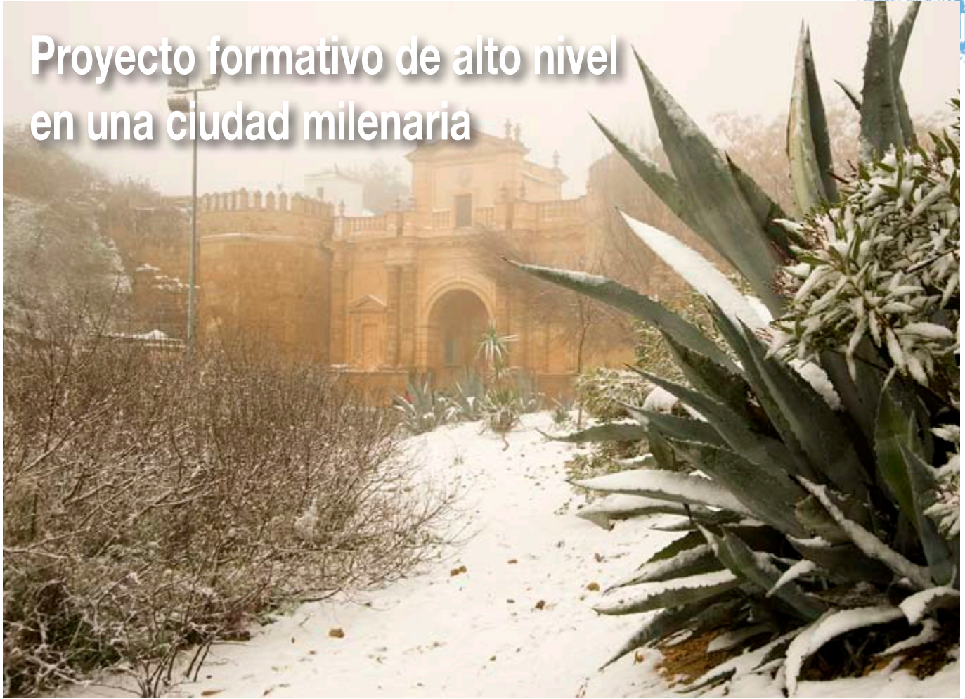
Puerta de Córdoba de Carmona (10/01/2010)

E l Centro 'Olavide en Carmona', cuya sede se encuentra en la Casa Palacio de los Briones, es un proyecto universitario plenamente consolidado que se encuentra preparando la novena edición de los cursos de verano.