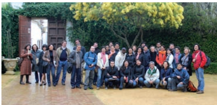
El Centro Olavide en Carmona acoge numerosas actividades formativas en la Casa Palacio de los Briones.