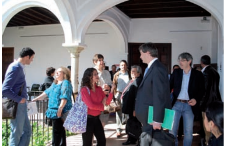
Más de 40 expertos asistieron a la reunión del Programa de Movilidad Académica PIMA.

• 5 y 6 de marzo de 2010. Celebración del III Coloquio del Grupo de Estudios de Historia Empresarial , que reunió a unas 25 personas. Este seminario, que forma parte de un proyecto científico integrado por una red de investigadores y expertos de cuatro países diferentes (España, México, Colombia y Argentina), se enmarca dentro del programa de historia empresarial comparada