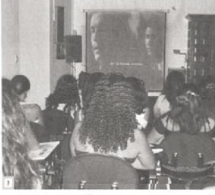
Estudiantes de la Universidad Pablo de Olavide trabajando en el curso de verano de traducción de subtítulos.

Actualidad El curso de verano 'introducción a la práctica de la subtitulación' de la Universidad Pablo de Olavide está impartiendo el curso de verano 'introducción a la práctica de la subtitulación', en el que los alumnos aprenden a subtitular películas y las técnicas de traducción en el doblaje cinematográfico.