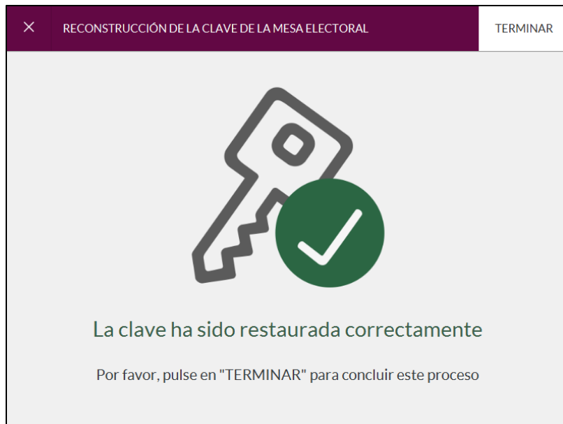
Imagen 2: Confirmación Clave Restaurada