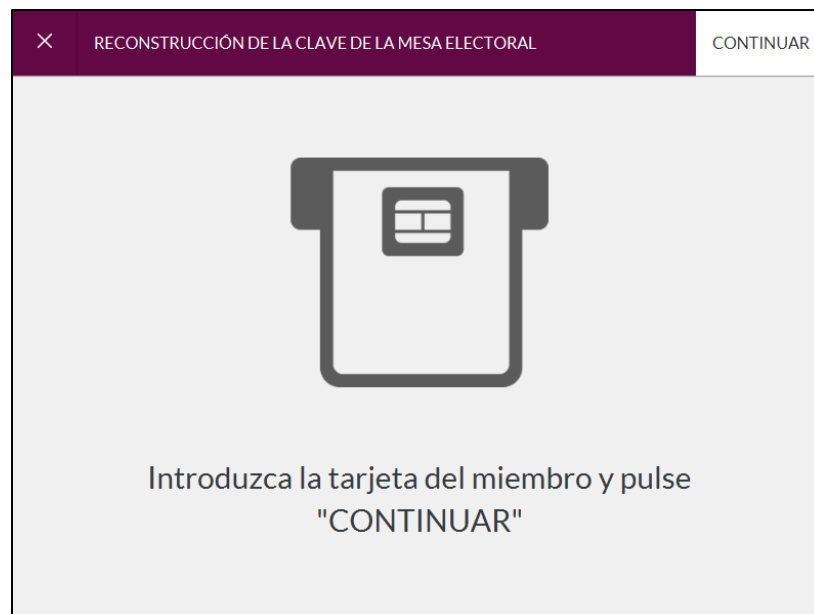
Imagen 1: Lectura de tarjeta para Mixing