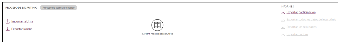
Imagen 9: Proceso de escrutinio