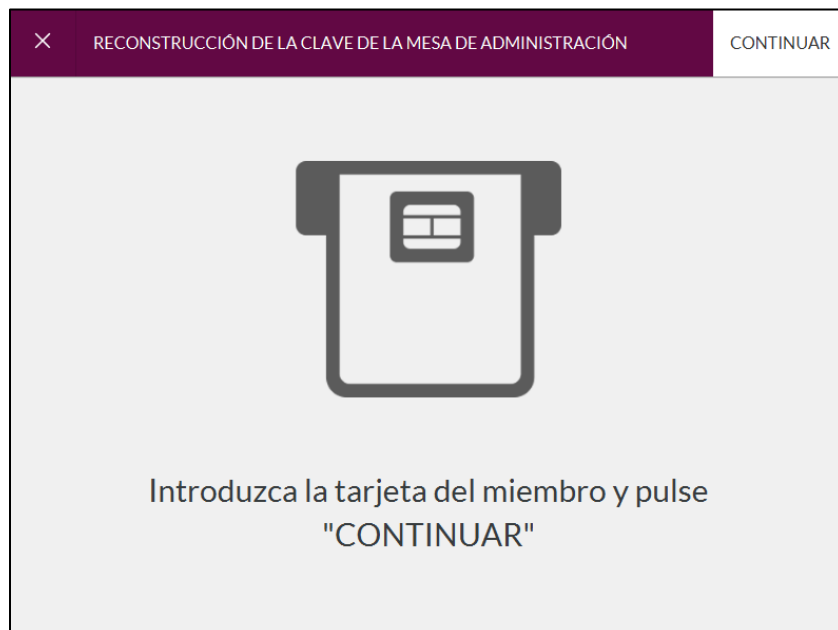
Imagen 6: Reconstrucción Clave Mesa Administración