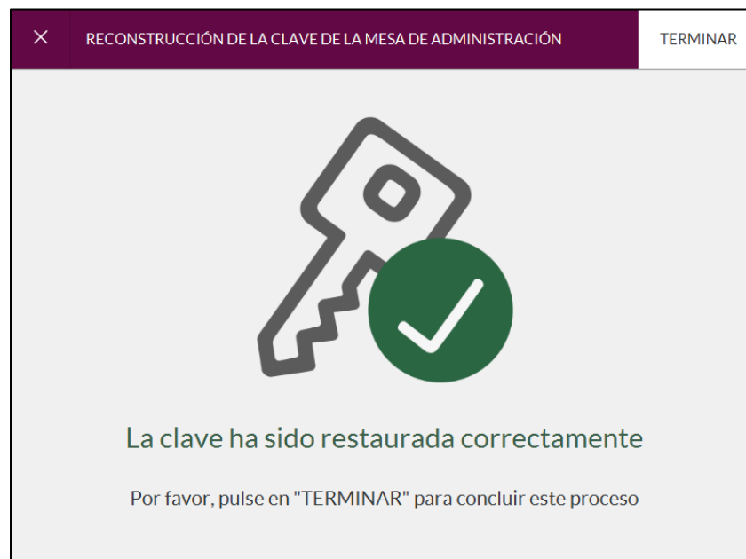
Imagen 8: Confirmación Clave Restaurada