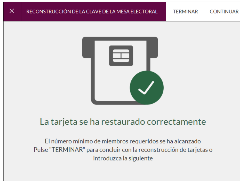
Imagen 11: Confirmación Tarjeta Restaurada