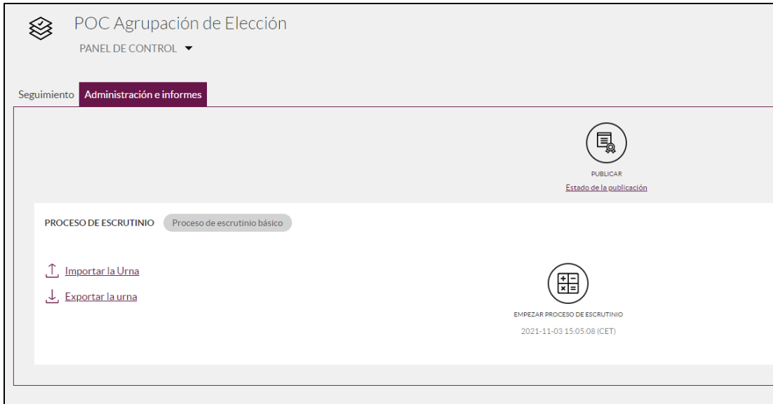
Imagen 5: Publicación de la elección