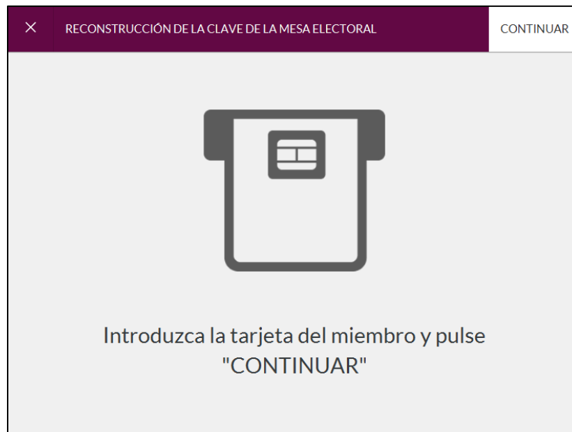
Imagen 10: Reconstrucción clave de la mesa electoral