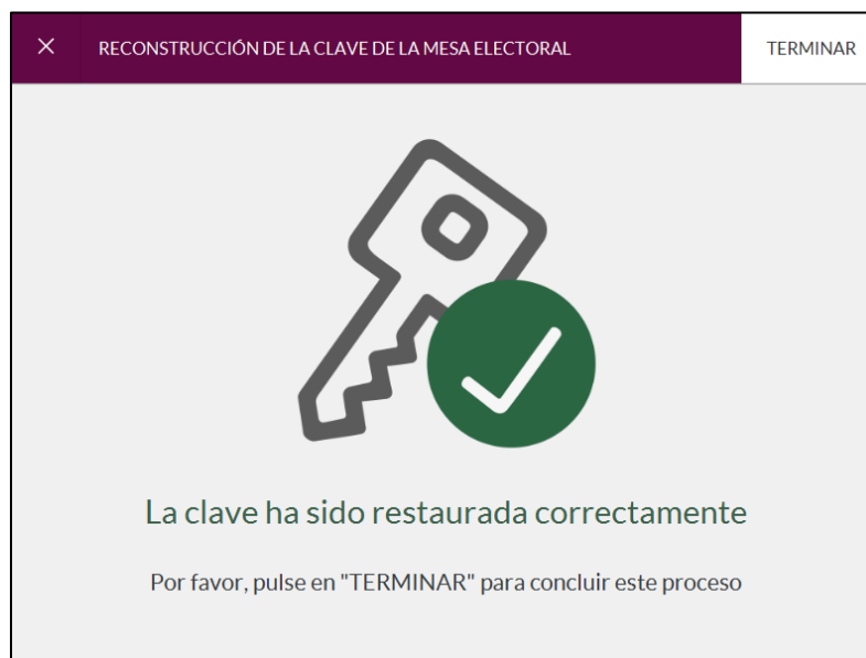
Imagen 12: Confirmación Clave Restaurada