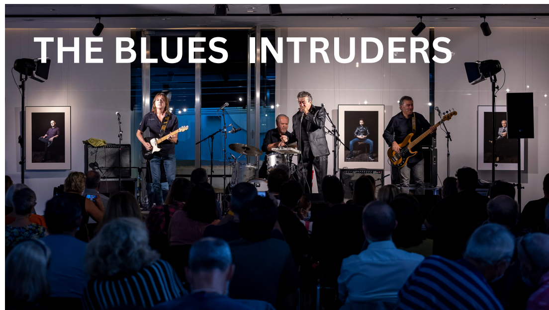
THE BLUES INTRUDERS