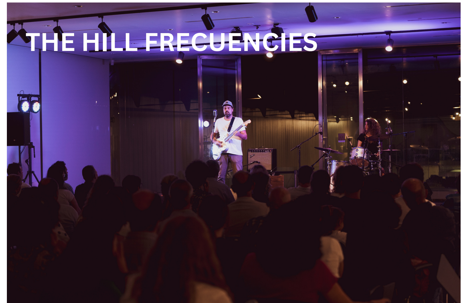
THE HILL FRECUENCIAS