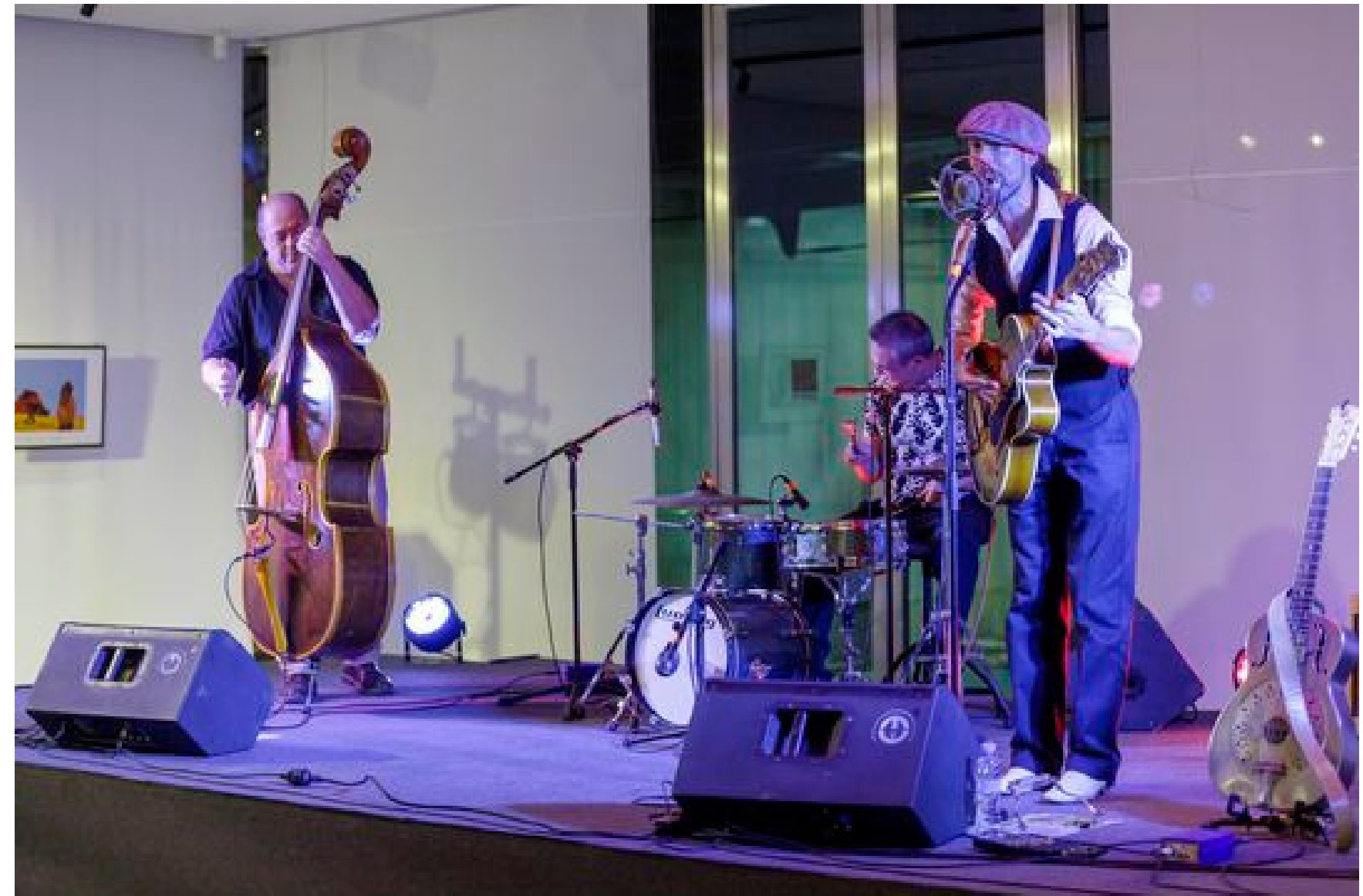
SlideBoy Vegas and His Blues Buddies