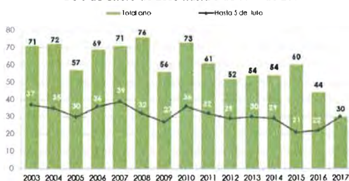
Víctimas mortales por Violencia de Género. De 1 de enero de 2003 hasta 5 de Julio de 2017