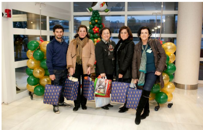
Grupo de Voluntarios/as que colaboran en la Campaña

La Oficina de Voluntariado y Solidaridad a través del programa "Construyendo Solidaridad", interviene y colabora en el Hospital Universitario Virgen del Rocío de Sevilla, acompañando a personas mayores hospitalizadas que se encuentran solas.