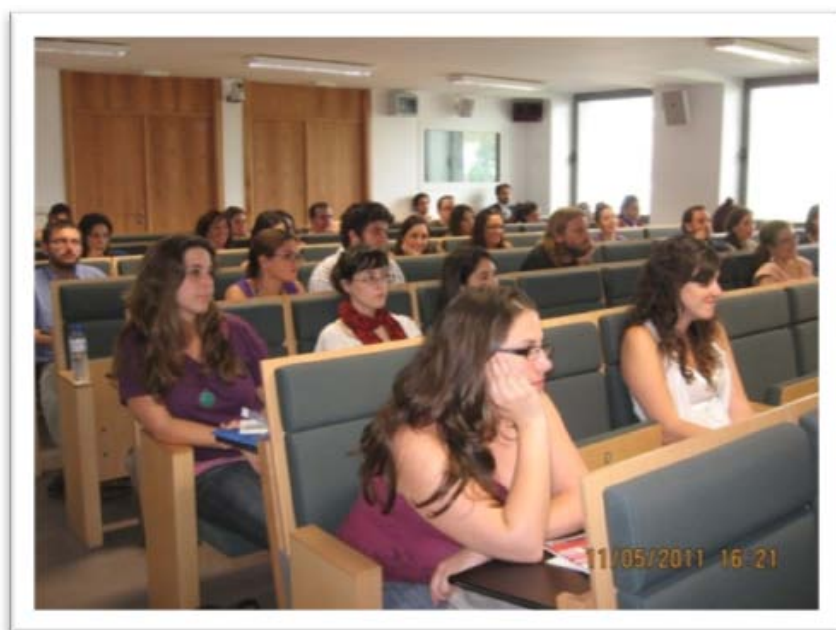
Asistentes a las ponencias del curso

El curso ha estado dirigido a toda la comunidad universitaria y, a profesionales de asociaciones y entidades del ámbito de la inmigración. Tuvo una duración de 30 horas teóricas, y el alumnado interesado pudo convalidarlo por 3 créditos de libre configuración.