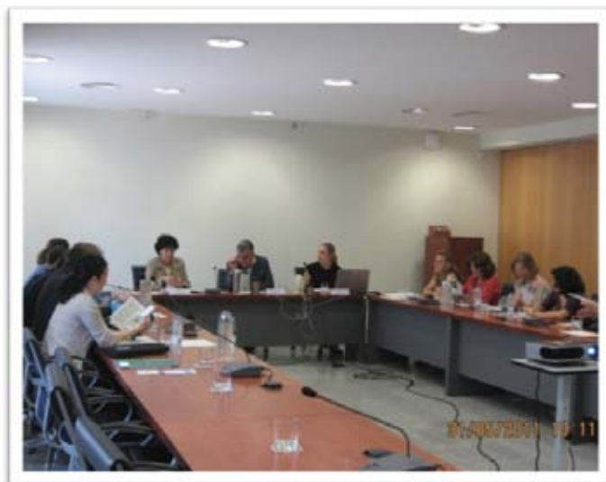
Representantes de la junta de Andalucía y miembros de Universidades públicas Andaluzas