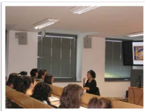
Alumnos del curso atendiendo a una de las ponencias

El día 12 de abril comenzó el curso "El voluntariado y la diversidad funcional", organizado por la Oficina de Voluntariado y Solidaridad, perteneciente al Vicerrectorado de Participación Social de la Universidad Pablo de Olavide.