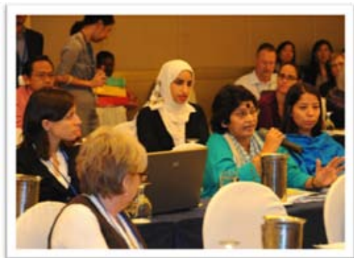
Participantes en la reunión preparatoria del año europeo de voluntariado 2011 en Bruselas

Organizado por el Centro Europeo de Voluntariado (CEV) y celebrado en Bruselas (Bélgica) del 6 al 8 de diciembre de 2010. Entre sus objetivos se encuentra: organizar la agenda de las entidades del Centro Europeo de Voluntariado, con motivo de la celebración del Año Europeo de Voluntariado 2011.