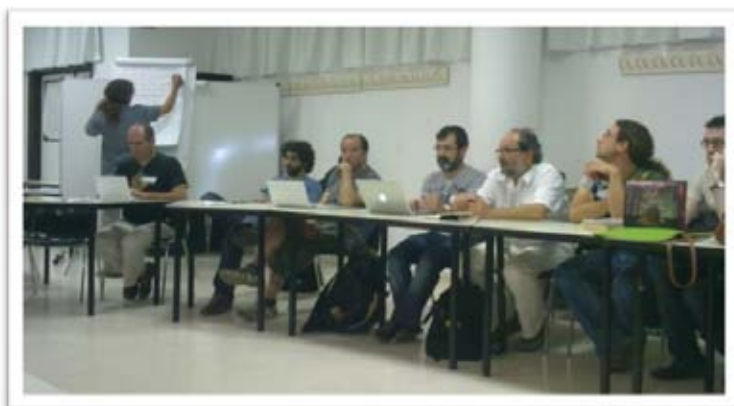
Algunos de los asistentes de las Primeras Jornadas Andaluzas de Movimientos Sociales Universitarios "Universidad y Compromiso Social"

El objetivo de estas jornadas es: favorecer el conocimiento mutuo de las organizaciones universitarias, conocer metodologías de profesores/as que imparten sus asignaturas desde una perspectiva de compromiso social y crear un germen de red andaluza de movimientos universitarios.