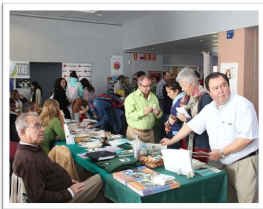
Stands informativos de asociaciones de voluntariado

El segundo día de las jornadas un total de 29 asociaciones, fundaciones y entidades de voluntariado han expuesto a través de stands informativos, las acciones y actividades que llevan a cabo, todo ello en el hall del Edificio Celestino Mutis de la Universidad.