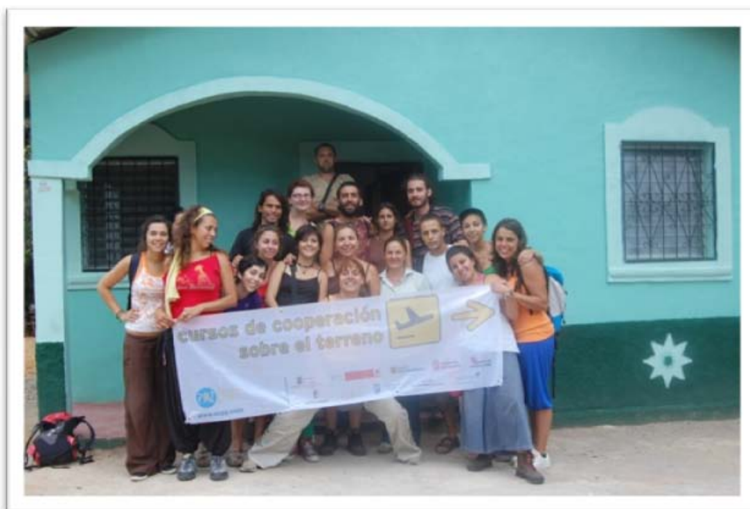
Voluntarios participando en un Proyecto de Cooperación al Desarrollo en Terreno

Desde 2010, la Oficina de Voluntariado y Solidaridad de la Universidad Pablo de Olavide ha recibido una fuerte demanda por parte de toda la comunidad universitaria, para llevar a cabo servicio voluntario en proyectos de desarrollo en terreno con organizaciones no gubernamentales durante los meses estivales. En el pasado, ya hubo algunos antecedentes en este tipo de voluntariado, gracias a la colaboración de algunas entidades, como es el caso de Asamblea de Cooperación por la Paz, que en 2005 becó y formó a diez alumnos/as de la universidad en sus proyectos de desarrollo en terreno en Honduras.