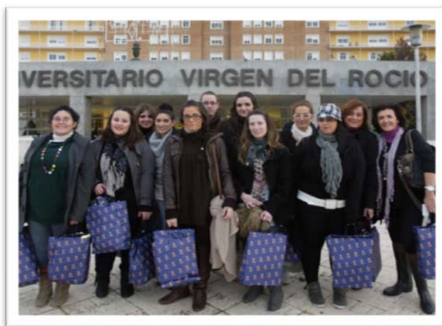
Grupo de voluntarios/as que colaboraron en la Campaña

Durante todo el mes de diciembre, se llevó a cabo en la universidad, la campaña de recogida de regalos para dichas personas, en la que pudo participar toda la comunidad universitaria. Todos los regalos obtenidos, se entregaron el 23 de diciembre a las 17:00 horas en el Hospital.