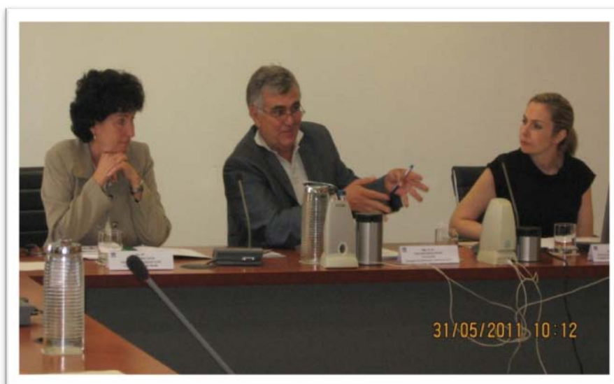
Consejero de la Consejería de Gobernación y Justicia, Vicerrectora de Cultura y Participación de la Universidad Pablo de Olavide y la Directora de la Dirección General de Voluntariado y Participación