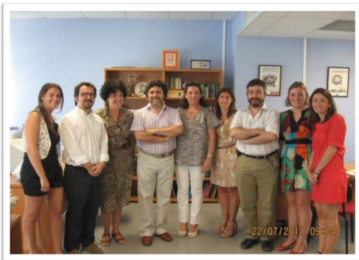
Visita del Rector a la nueva Oficina de Voluntariado con los componentes de la misma

Nace como punto de información para la comunidad universitaria que tenga inquietudes por realizar actividades solidarias y participar en programas de voluntariado, a través de asociaciones u ONG'S que estén dispuestas a incorporar en sus actividades la participación de personas voluntarias.