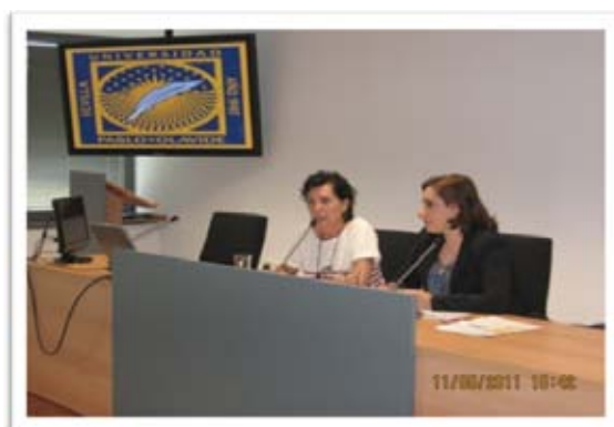
Inauguración del curso a cargo de la Vicerrectora de Participación Social y la Directora General de Coordinación de Políticas Migratorias

Durante los días 11, 16, 17, 18, 23, 24 y 25 de Mayo de 2011 se llevó a cabo el Curso "La Inmigración desde una Perspectiva Socio-Jurídica" en la Universidad Pablo de Olavide, organizado por el Vicerrectorado de Participación Social de la Universidad Pablo de Olavide, a través de la Oficina de Voluntariado y Solidaridad, y subvencionado por la Dirección General de Políticas Migratorias de la Consejería de Empleo de la Junta de Andalucía.