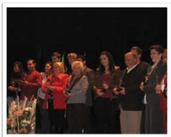
Acto de entrega de premios a los homenajeados, una de las actividades programadas

Los días 15 y 16 de Diciembre de 2010, se celebró en el Centro Social Virgen de los Reyes de Sevilla, el Día Internacional del Voluntariado, organizado por la Delegación Municipal de Bienestar Social del Ayuntamiento de Sevilla, en horario de mañana y tarde.