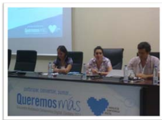
Mesa Inaugural del Encuentro

Los días 17 y 18 de Junio de 2011 se llevó a cabo en la ciudad de Córdoba, el Encuentro Andalucía Compromiso Digital, titulado "Participar, Conversar, Sumar... Queremos Más", donde tuvieron un espacio de información, aportaciones y trabajo en grupo, tanto las organizaciones colaboradoras, las asociadas y universidades públicas, como las personas voluntarias.