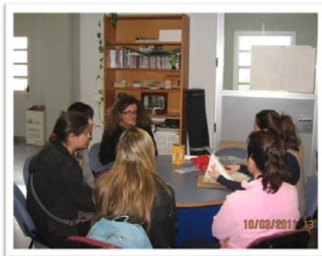
Reunión mantenida con miembros de una asociación

La Oficina de Voluntariado y Solidaridad a lo largo del curso académico mantiene numerosas reuniones con asociaciones de la provincia de Sevilla, las cuales sirven para, que a petición de ellas, nos soliciten alguna propuesta de colaboración, como la participación en sus campañas, cuestaciones, organización de jornadas conjuntas, captación de personas voluntarias, difusión de actividades, etc.