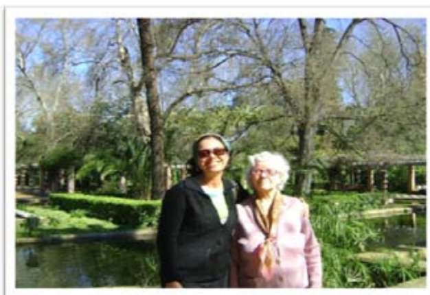
Pareja de Convivencia del curso 10/11

Para establecer la convivencia, estas parejas pasan previamente, un período de prueba de 15 días, supervisados por la persona responsable del programa; pasando a formalizarse con un contrato de derechos y obligaciones de ambas partes.