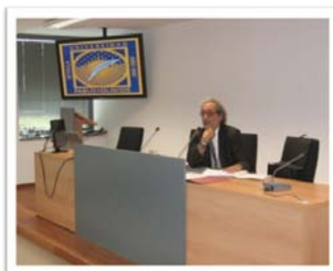
Ponencia de D. José Chamizo, defensor del Pueblo Andaluz