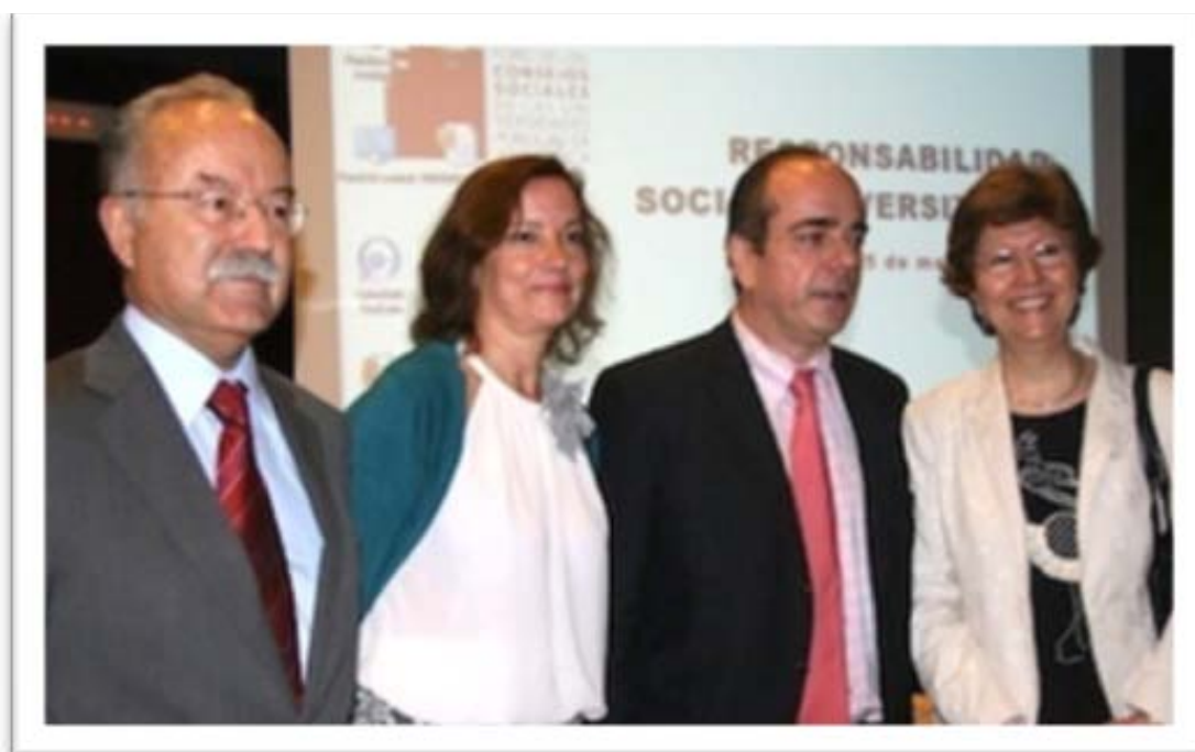
Autoridades participantes en el Foro sobre Responsabilidad Social

Organizado por el Foro de los Consejos Sociales de las Universidades Públicas de Andalucía y celebrado en la Universidad de Córdoba el 5 de mayo de 2011.