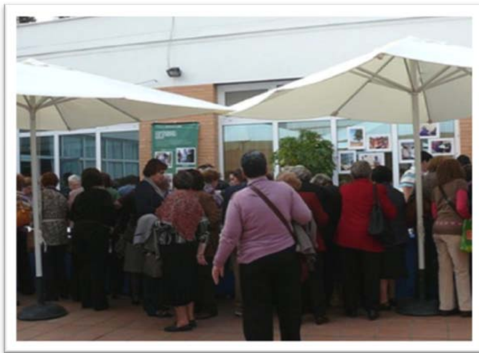
Mayores en los stands expuestos en el encuentro de CONFEMAC

Durante toda la jornada se hizo especial atención: en los principios básicos del voluntariado: solidaridad, gratuidad, justicia, complementariedad, permanencia y creatividad con una mesa redonda, donde los voluntarios mayores expresaron su satisfacción como voluntarios.