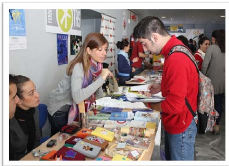
Stands informativos de asociaciones de voluntariado.

Estas Jornadas, pretenden: ser un punto de encuentro entre las entidades y asociaciones que están dispuestas a incorporar en sus actividades la labor de las personas voluntarias y toda la comunidad universitaria en general, con el fin de sensibilizarlos y animarlos a participar en los distintos proyectos.