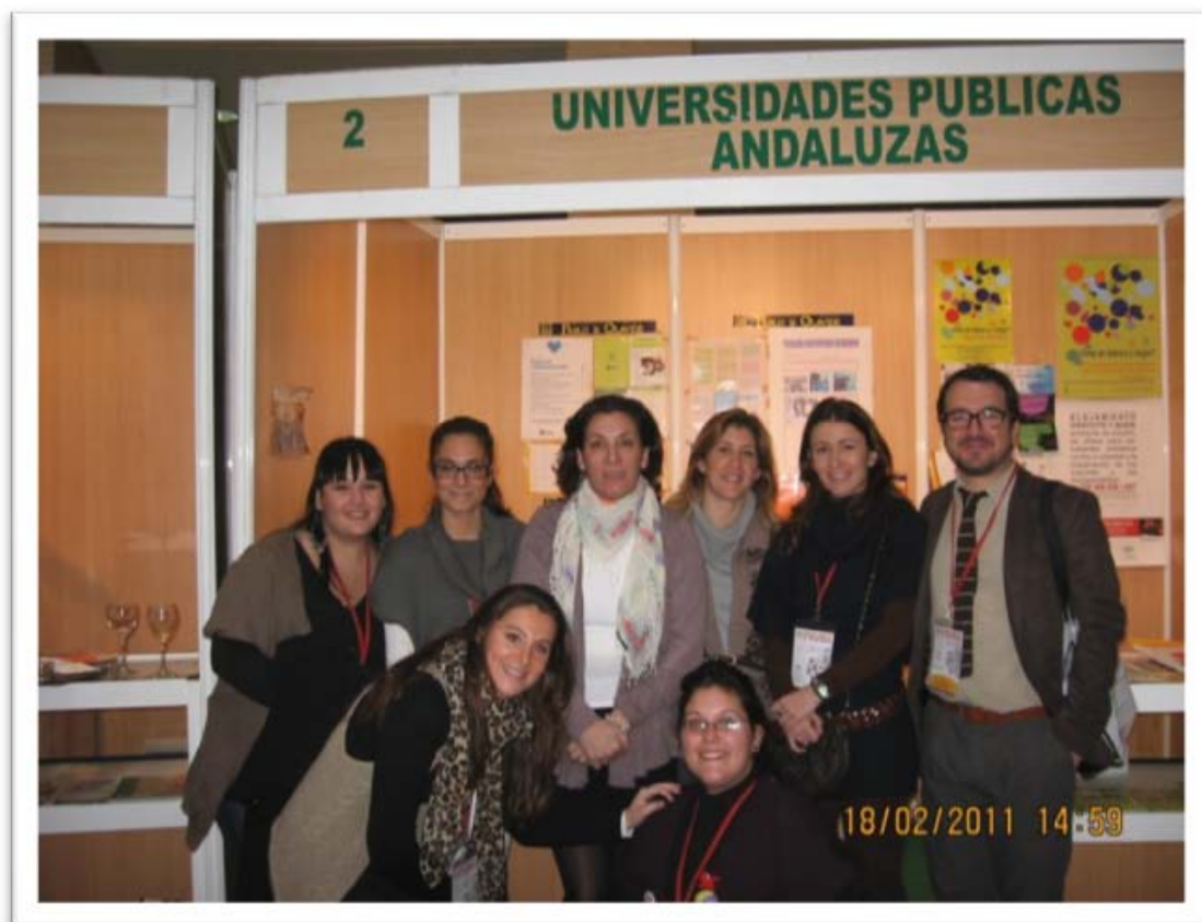
Miembros de la Oficina de Voluntariado y Solidaridad en el stand expuesto en el Congreso por las Universidades Públicas

El congreso sirvió como espacio de reflexión, participación, intercambio y trabajo entre personas vinculadas con los movimientos sociales y la acción solidaria: voluntarios y voluntarias, profesionales, comunidad universitaria y responsables del ámbito público y privado.