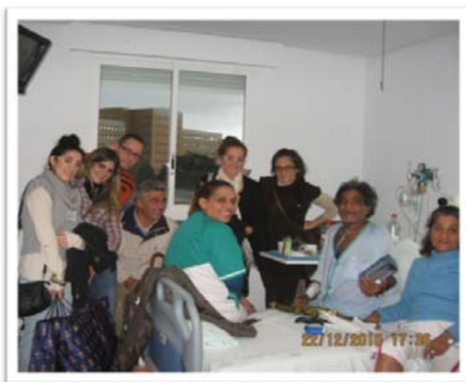
Visita de los Voluntarios a enfermos del H. U. Virgen del Rocío.