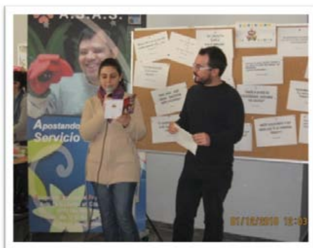
Miembro de una asociación participando en la actividad del montaje del árbol de los deseos.

Además, todas las personas asistentes pudieron disfrutar de diferentes actividades: Montaje y decoración del árbol de los deseos para el próximo año, degustaciones varias, concurso de lemas, concurso de decoración de stands, y además, como novedad, el grupo teatro de la Universidad Pablo de Olavide, La Escalera Teatro, nos deleitó con una de sus actuaciones.