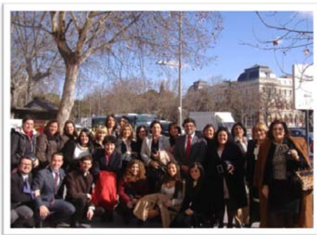
Grupo de la UPO que asistió a la audiencia

Fue un día muy especial para todos los miembros de la Oficina de Voluntariado y las personas voluntarias, ya que la visita a la zarzuela supuso un reconocimiento por parte de la Casa Real a la labor que cientos de voluntarios realizan cada año.