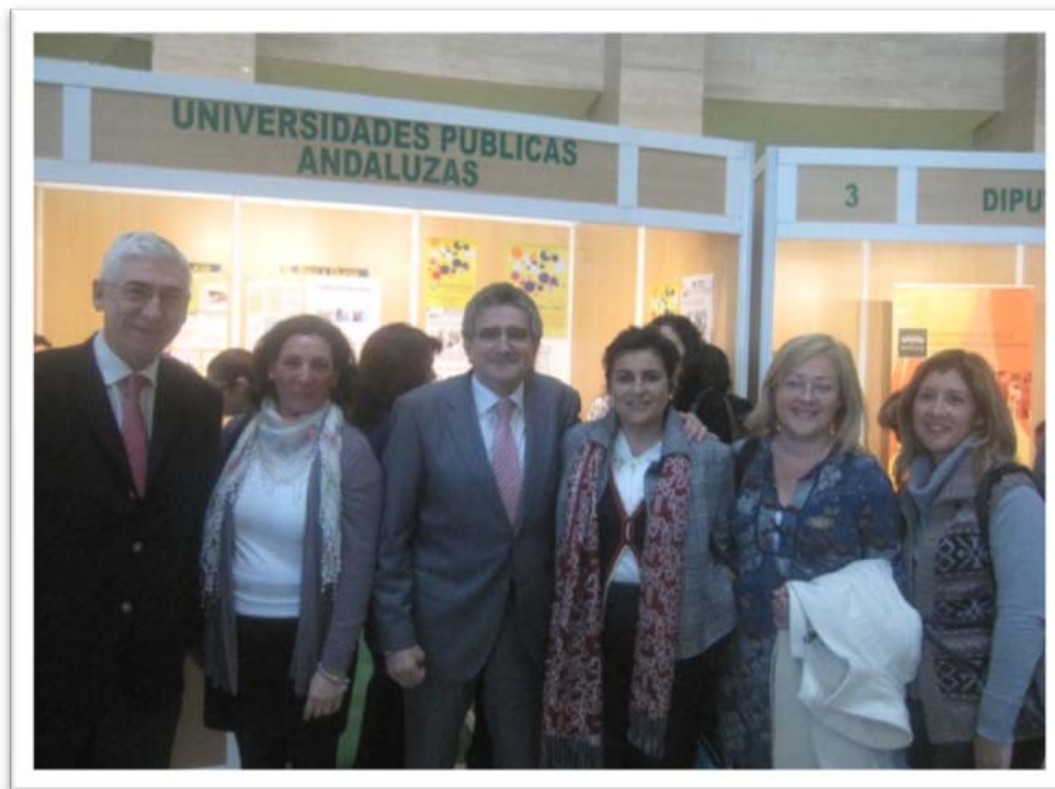
Consejero y Viceconsejero de Gobernación y Justicia de la Junta de Andalucía con miembros de la Oficina de Voluntariado y Solidaridad

Los días 18 y 19 de Febrero de 2011 se celebró el 8º Congreso Andaluz de Voluntariado, organizado por la Consejería de Gobernación y Justicia, a través de la Dirección General de Voluntariado y Participación, bajo el lema "Compromiso y Participación. Retos 2011", que tuvo lugar en el Palacio de Exposiciones y Congresos de Sevilla.