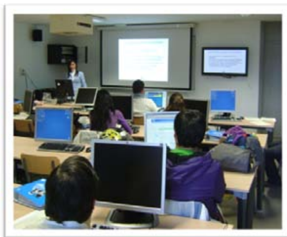
Alumnos en una de las ponencias del curso

Proporcionar habilidades y herramientas útiles para la formación y actuación de los asistentes en materia de voluntariado digital.