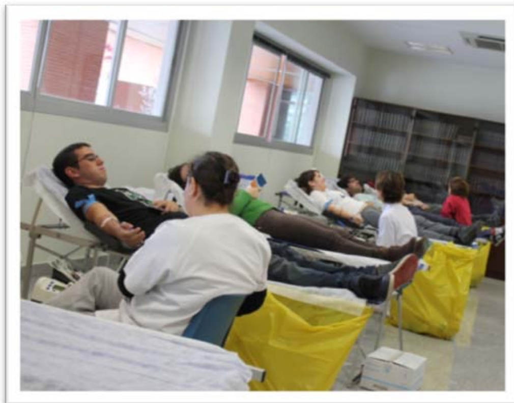
Estudiantes participantes en la Campaña de donación de sangre