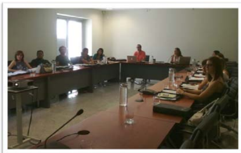
Responsables y Técnicos de las Oficinas de Voluntariado de las Universidades Públicas Andaluzas

Ha tenido como objetivo: crear un espacio de intercambio de experiencias entre el personal responsable y técnico de las Oficinas de Voluntariado de las Universidades Públicas Andaluzas, además de servir como lugar de formación respecto al voluntariado universitario.