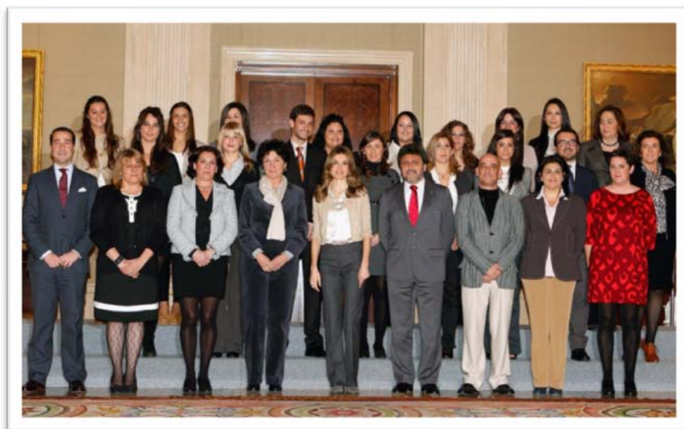
Componentes de la Oficina de Voluntariado y Solidaridad en la audiencia con la Princesa de Asturias en el Palacio de la Zarzuela, en Madrid

El día 31 de Enero, La Princesa de Asturias D a Letizia Ortiz Rocasolano, recibió en La Zarzuela a miembros de la Oficina de Voluntariado y Solidaridad de la Universidad Pablo de Olavide, con motivo del X Aniversario de la misma.