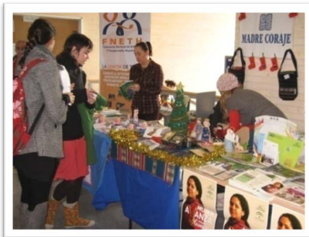
Exposición de stands de distintas asociaciones

El día 1 de Diciembre de 2010 se celebró el "Día Internacional del Voluntariado en la Universidad Pablo de Olavide". El acto estuvo organizado por La Oficina de Voluntariado y Solidaridad, con la colaboración de la Dirección General de Voluntariado y Participación, de la Consejería de Gobernación y Justicia de la Junta de Andalucía