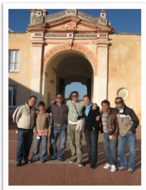
Visita Cultural de Proyecto Hombre

* Durante el curso académico, se han organizado: