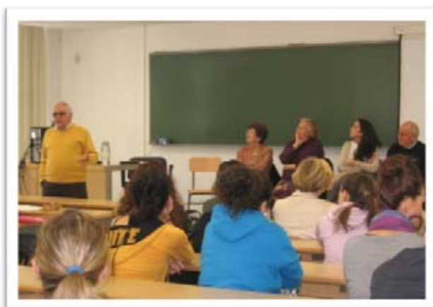
Mesa Redonda de experiencias de "El voluntariado de los mayores. Una Experiencia Intergeneracional"