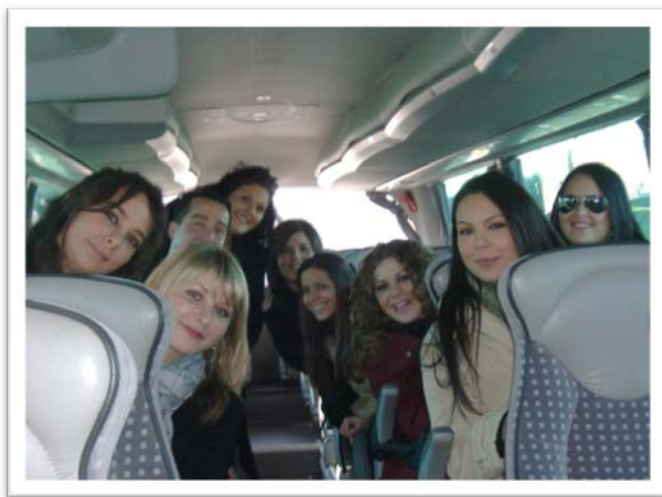
Voluntarias/os en el Viaje al Palacio de la Zarzuela, Madrid