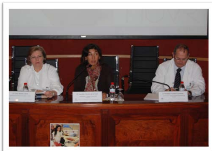
Trabajadora Social del Hospital impartiendo una ponencia en las Jornadas

La Oficina de Voluntariado y Solidaridad, perteneciente al Vicerrectorado de Partición Social de la Universidad Pablo de Olavide, asistió al encuentro y ofreció una conferencia en la que presentó el programa de voluntariado "Construyendo Solidaridad", llevado a cabo allí actualmente mediante un convenio vigente entre el Hospital y la Oficina. Además participó en la exposición de posters que se expuso en el patio central de dicho hospital desde el día 11 hasta el 19 de Noviembre.