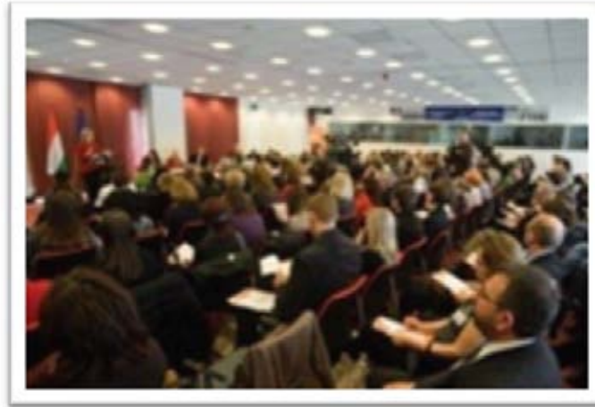
Presentación oficial del año europeo de voluntariado por la Vicepresidenta de la Unión Europea

En esta conferencia se presentó oficialmente, por la Vice-Presidenta de la Unión Europea, el "Año Europeo de Voluntariado 2011". La Oficina de Voluntariado y Solidaridad fue una invitada especial, como la primera entidad de voluntariado universitario en formar parte del Centro Europeo de Voluntariado.