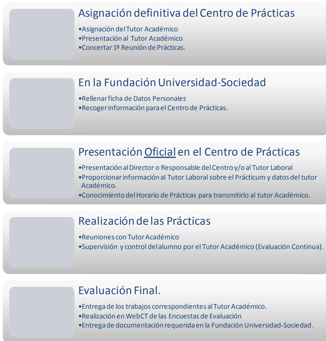
Figura 1. Esquema de la secuenciación de la actuación del alumno en el Prácticum.