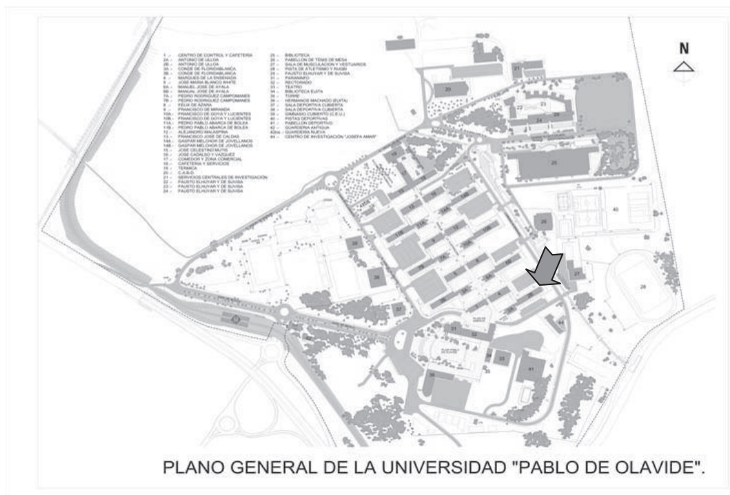
Fig.2: Plano de localización del Decanato de la Facultad de Ciencias Experimentales