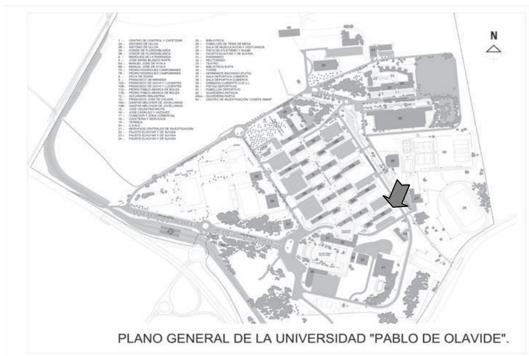
Fig.2: Plano de localización del Decanato de la Facultad de Ciencias Sociales