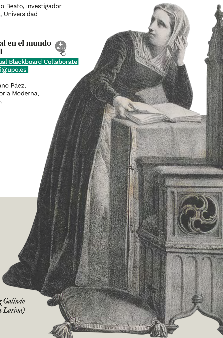
D a Beatriz Galindo (La Latina)