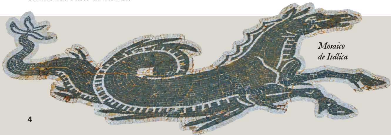
Mosaico de Itálica