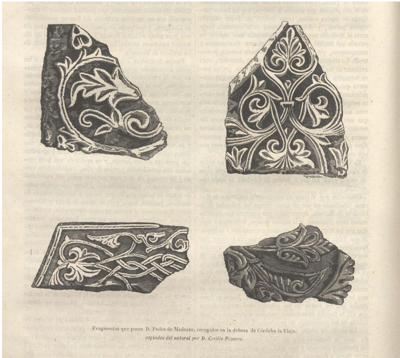
Fig. 3. Cecilio Pizarro. Fragmentos procedentes de Medina Azahara, Semanario Pintoresco Español , 1857.