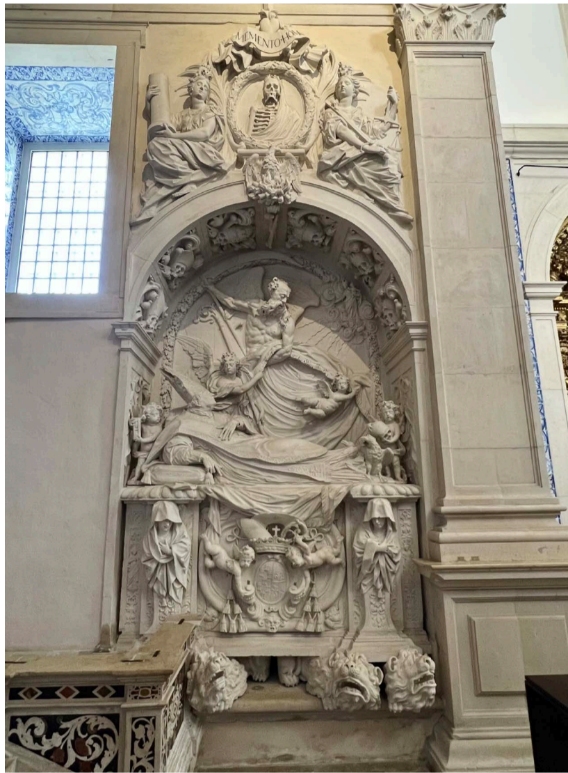
Fig. 2. Claude Laprade. Sepulcro de Manuel de Moura Manuel. Capilla de Vista Alegre.

La capilla de Nossa Senhora da Penha de França de Vista Alegre (Ílhavo, Portugal) (Fig. 1) ha sido objeto de estudios recurrentes por parte de la historiografía del arte portuguesa, debido al notable monumento funerario existente en su interior dedicado al prelado D. Manuel de Moura Manuel (1632-1699) (Fig. 2). Su calidad escultórica, obra del escultor Claude Joseph Courrat Laprade (c. 1675-1738), ha monopolizado los estudios sobre el conjunto, centrados a menudo en su autoría y la llegada a Portugal del artista 1 .