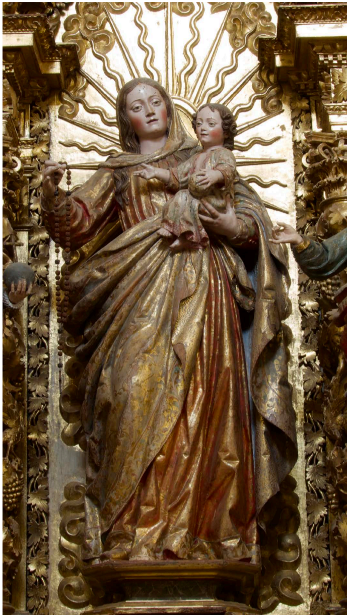
Fig. 4. Juan Antonio de la Peña. Virgen del Rosario . Capilla de Vista Alegre.

y el Árbol de Jesé en la nave), en los azulejos de los muros (escenas de la vida de María), en el retablo mayor (el Nacimiento y la Virgen de la Peña de Francia ) y en los colaterales (imágenes principales de la Virgen del Rosario y de la Inmaculada ).