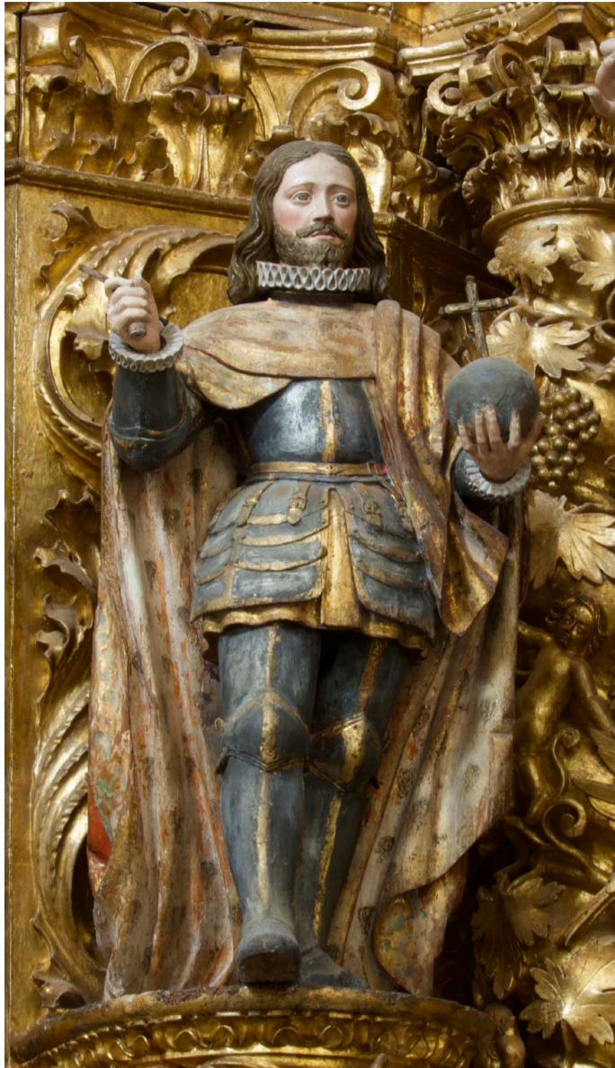
Fig. 6. Juan Antonio de la Peña. San Fernando . Capilla de Vista Alegre.

Al mismo tiempo, se recogieron otras devociones que podríamos llamar “nacionales”, especialmente destacadas en un momento de afirmación política del reino tras la Guerra de Restauración (Fig. 7). La inclusión de la reina Isabel estaba plenamente justificada, tanto por ser una reina portuguesa canonizada en 1625, como por ser hija de Constanza de Hohenstaufen y de Pedro III de Aragón, lo que demuestra otra conexión familiar 18 . Lo mismo podría decirse de la presencia de la princesa Juana, explicable por su carácter nacional, pero también local, dada su cercana relación con Aveiro, en cuyo convento de Jesús profesó y se veneraban sus restos. Todavía hay otra advocación que debe ponerse en relación con la exaltación nacionalista vivida en el reino durante la guerra contra España. La Inmaculada Concepción se convirtió desde 1640 en protectora de los nuevos reyes portugueses, que