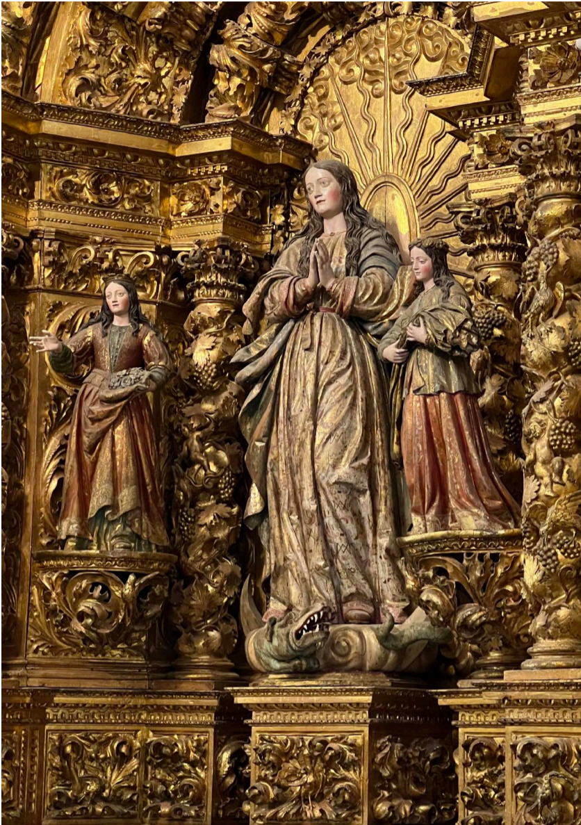
Fig. 7. Juan Antonio de la Peña. Retablo de la Inmaculada. Capilla de Vista Alegre.