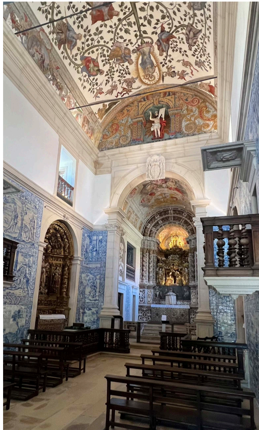
Fig. 3. Capilla de Vista Alegre. Interior.

(...) tomo por minha avogada e especial intercesora a Virgem, May do mesmo Nosso Senhor, sob titulo de Penha de França, auxilio e refugio dos miseraveis peccadores, de entre os quaes hei eu sido o mais miseravel. No patrocínio da qual Senhora tive e fundei sempre a esperança da minha salvação, vererandoa e amandoa a este fim com todas as forças do meo fraco espirito, erigindolhe pellosim una caza e templo que chamão no sitio da Vista Alegre, termo de Ílhavo, comarca de Esqueira a que para maior merecimento me obriguei por voto ou promessa a mesma Señora feita e repetida en varios perigos de vida de que fui livre por seu benplacito e piedade (...).