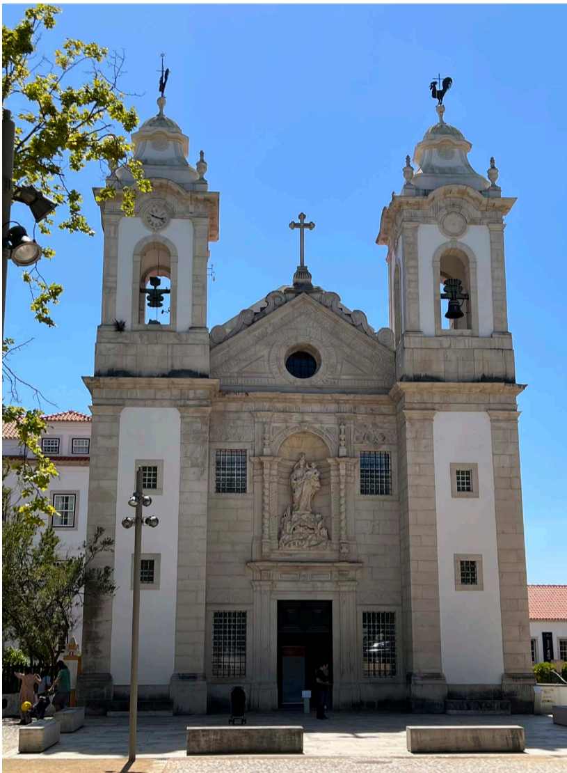
Fig. 1. Fachada de la capilla de Nuestra Señora de la Peña de Francia. Vista Alegre, Ílhavo, Portugal.