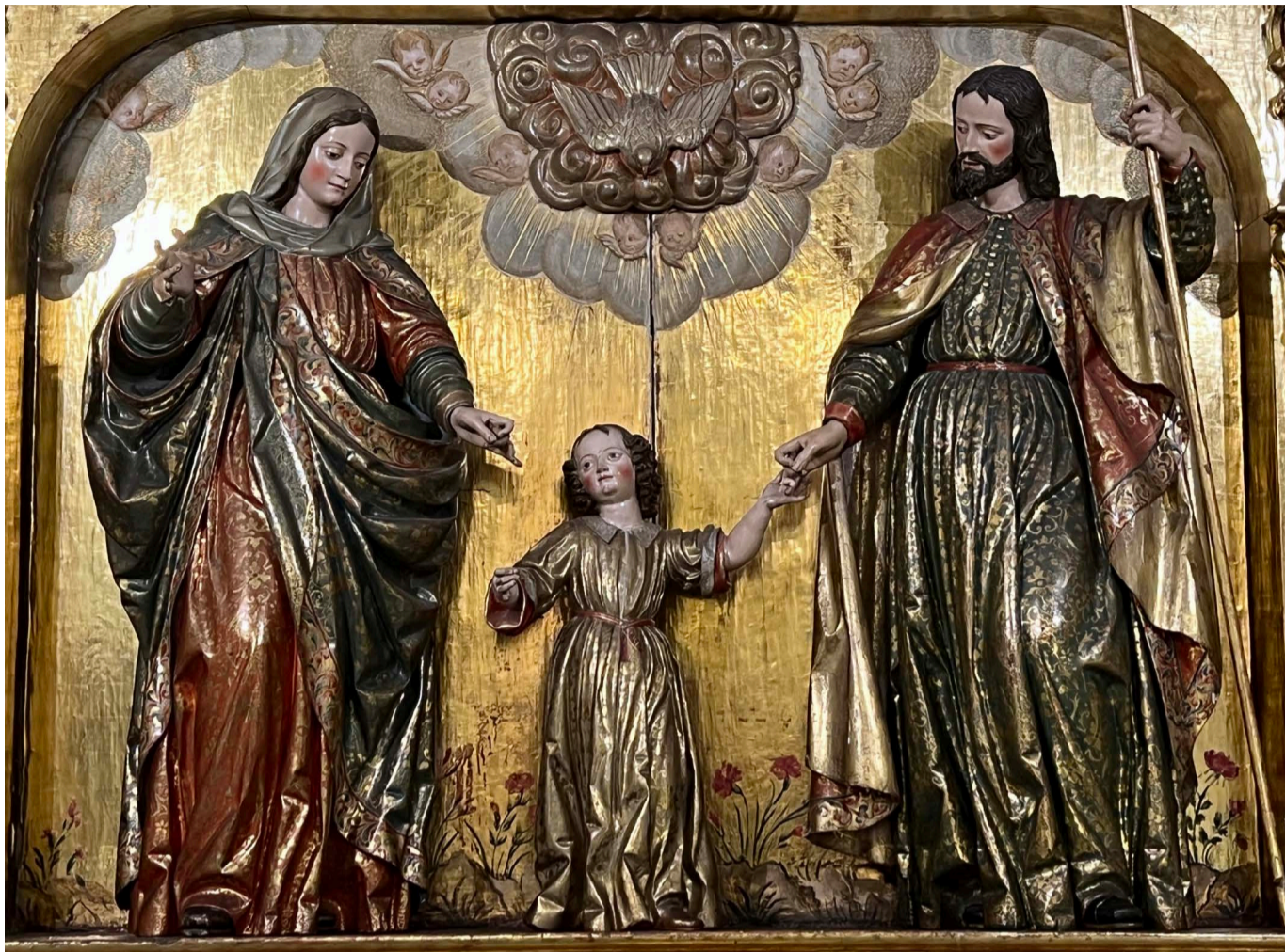
Fig. 9. Juan Antonio de la Peña. Sagrada Familia . Colegio de San Albano, Valladolid.

obra documentada como suya desde antiguo 38 , posibilita relacionarlo con el Nazareno de vestir de la Pasión, pero también con el crucificado del Calvario de San Albano. La belleza de la Virgen de la Anunciación de Ataquines se repite en la Sagrada Familia de San Albano y en el Nacimiento de Ílhavo. La Inmaculada de Azpeitia, lamentablemente muy afectada por el fuego, es remedo de la de Portugal. El rostro doliente de la Soledad de la iglesia de San Martín de León sirvió de modelo al de la Santa Julita del retablo de San Quirce de Valladolid, pero también al de la Santa Ana de San Albano, al de sus distintas Magdalenas (Braganza y Descalzas de Valladolid), así como al del San Juan Evangelista de Vista Alegre. Las vírgenes del relicario de Villagarcía consienten atribuirle las santas de Ílhavo. El San Fernando de Vista Alegre remite al modelo creado por Alonso de Rozas sobre estampa de Cornelis de Galle II 39 . El tipo humano empleado en el San Quirce de