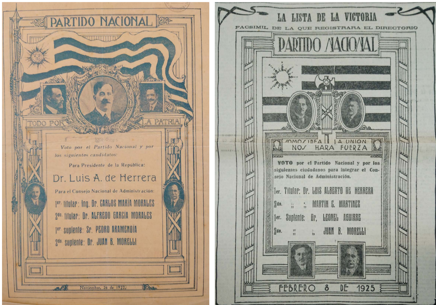
Fig. 1. Partido Nacional, noviembre de 1922, Museo Histórico Nacional, colección Ramón Viña, carpeta 3523; "La lista de la victoria", La Democracia , 25 de enero de 1925, 1. Biblioteca Nacional de Uruguay.

limitó a la bandera, puesto que el escudo también sirvió para el diseño de las listas. Por ejemplo, en la número 12 de Montevideo de 1928 se presenta un escudo ovalado en el centro, dividido en cuatro secciones, cada una con un retrato fotográfico de un referente nacionalista. Los héroes Leandro Gómez y Aparicio Saravia ocupan los lugares superiores, y debajo los candidatos Luis Alberto de Herrera y Andrés Dabarca. Los retratos están dispuestos simétricamente y enmarcados por bordes ornamentales. A ambos lados del escudo se exhiben tres banderas dispuestas en abanico, aludiendo así al escudo nacional vigente hasta 1908, que ostentaban los trofeos militares y de marina. Esta composición visual se apropia, reinterpreta y resignifica los elementos identitarios del Estado, y los adapta al contexto electoral sustituyendo sus figuras (balanza, cerro de Montevideo, caballo y buey) por las de los políticos nacionalistas (Fig. 2).