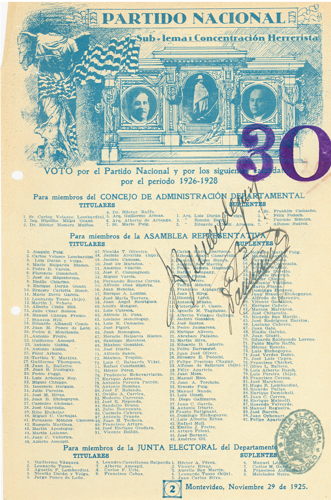
Fig. 3. Partido Nacional, lista 2, Montevideo, 29 de noviembre de 1925, Corte Electoral. Disponible en: https://www.gub.uy/corte-electoral/comunicacion/publicaciones/historial-hojas-votacion-0 .