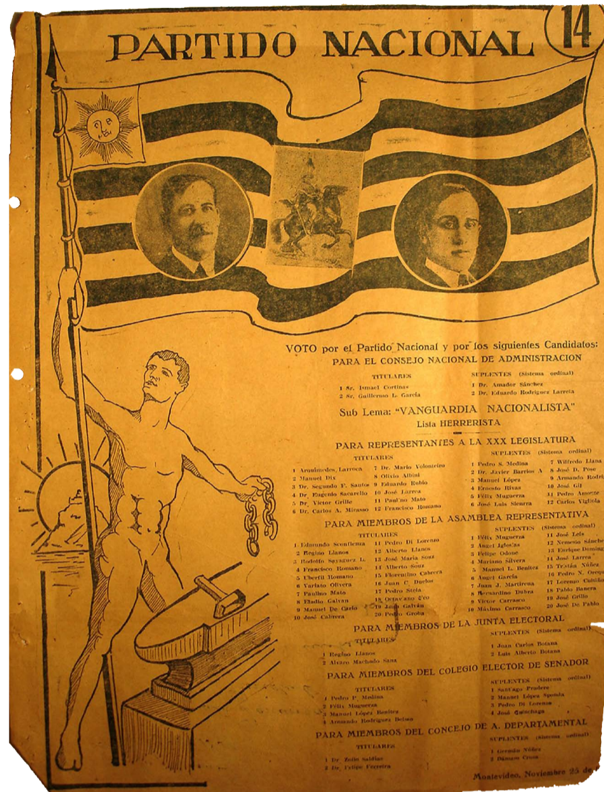
Fig. 4. Partido Nacional, lista 14, Montevideo, 25 de noviembre de 1928, Corte Electoral. Disponible en: https://www.gub.uy/corte-electoral/comunicacion/publicaciones/historial-hojas-votacion-0 .

y sonriente que levanta el asta de la bandera antes descrita y la observa con alegría. En la otra mano, porta unas cadenas que se asemejan a grilletes rotos, imagen que representa la libertad obtenida después de una lucha, que en este caso puede referir a la de la libertad del sufragio que el Partido Nacional festejó con profusión en la década de 1920. No es menor que la persona se encuentre desnuda, simbolizando la pureza, una virtud defendida constantemente por sus dirigentes. Por último, el yunque y el martillo evocan al trabajo, por lo que esta alegoría podría referirse a un intento de atraer a los obreros. El cuadro se cierra con una imagen del cerro de Montevideo detrás del trabajador y un sol naciente, que refuerza la idea de la esperanza y el nacimiento de un nuevo día, asociándose en forma metafórica con los ideales de la regeneración y del progreso que vendría cuando los nacionalistas alcanzaran el poder (Fig. 4). Era habitual que los candidatos blancos en su prensa y discursos políticos se defendieran de la acusación del oficialismo que los enjuiciaba como un "partido de ricos" y carente de apoyo de sectores populares capitalinos.