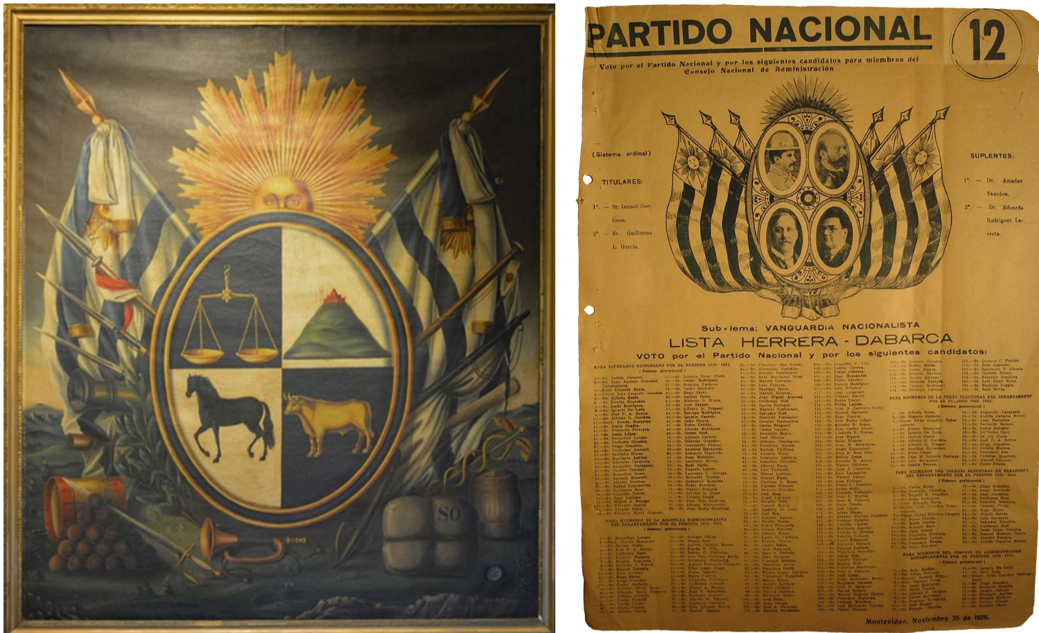
Fig. 2. Partido Nacional, lista 12, Montevideo, 28 de noviembre de 1928, Corte Electoral. Disponible en: https://www.gub.uy/corte-electoral/comunicacion/publicaciones/historial-hojas-votacion-0 ; Escudo nacional, óleo sobre tela, 1908. Disponible en: https://www.museohistorico.gub.uy/innovaportal/v/91879/33/mecweb/el-antiguo-escudo-nacional?parentid=81040 .

estabilidad y orden. En la fachada se observan tres retratos dentro de medallones, dispuestos en un marco ornamental: el retrato central es el de Saravia con su sombrero y poncho blanco, y a su izquierda se encuentra Herrera. Además, la lista incluye una representación de la Victoria alada de Samotracia, una escultura icónica de la antigüedad griega clásica asociada, como su nombre lo indica, al triunfo, que no solo se limitaría al éxito electoral sino también a la victoria de los principios defendidos por el Partido Nacional. A su vez, alrededor de su cintura ondea una bandera nacional, conectando así los ideales democráticos griegos con el contexto uruguayo (Fig. 3) 25 .