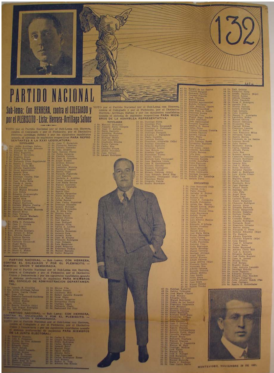
Fig. 7. Partido Nacional, lista 132, Montevideo, 29 de noviembre de 1931, Corte Electoral. Disponible en: https://www.gub.uy/corte-electoral/comunicacion/publicaciones/historial-hojas-votacion-0 .

El sol, símbolo del amanecer, fue de uso recurrente en su propaganda para aludir a su propuesta de un “nuevo tiempo” que auguraba al país en caso de alcanzar la presidencia. Este símbolo aparece en varias hojas de votación, ya sea posado sobre el nombre del Partido Nacional o sobre el pabellón nacional 37 .