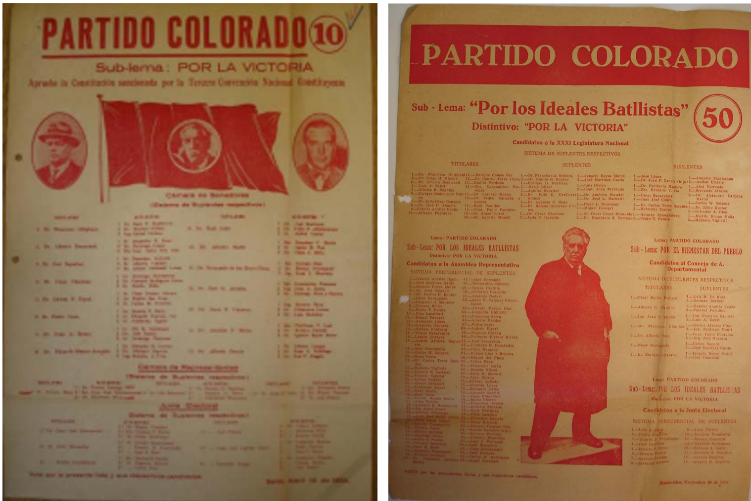
Fig. 9. Partido Colorado, lista 50, Montevideo, 29 de noviembre de 1931 y lista 10, Salto, 19 de abril de 1934, Corte Electoral. Disponible en: https://www.gub.uy/corte-electoral/comunicacion/publicaciones/historial-hojas-votacion-0 .

diferentes eslóganes, tales como “iClase contra clase: pobres contra ricos!” o “Con los obreros y campesinos por pan, trabajo y libertad”, aludiendo a las consignas básicas de su ideología. En este sentido, adornaron sus hojas de votación con su símbolo de aspiración revolucionaria universal: la hoz y el martillo, de diferente tamaño según el año que se analice 46 . Durante la década de 1920 ambos iban acompañados de un sol naciente y hojas de laurel reunidas por un moño 47 .