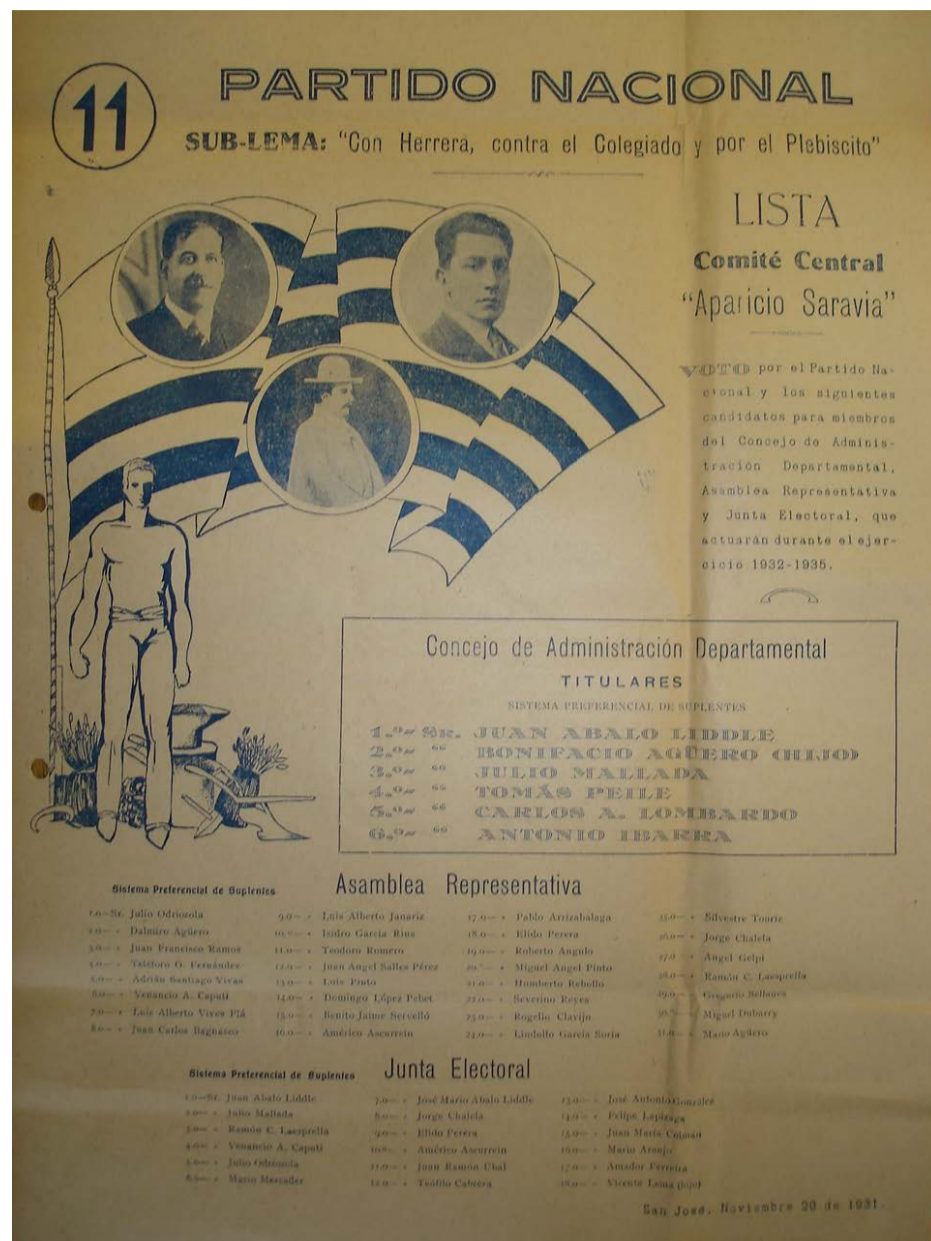
Fig. 8. Partido Nacional, lista 11, San José, 29 de noviembre de 1931, Corte Electoral. Disponible en: https://www.gub.uy/corte-electoral/comunicacion/publicaciones/historial-hojas-votacion-0 .

Progreso departamental 38 . Es decir, las listas claman por unidad, unión y respeto a las autoridades constituidas, llaman a la tradición y a los ideales, y en sus nombres destacan los héroes partidarios: Saravia y Beltrán 39 . Aunque, también, se encuentra un retorno en el uso político y visual de Oribe 40 .