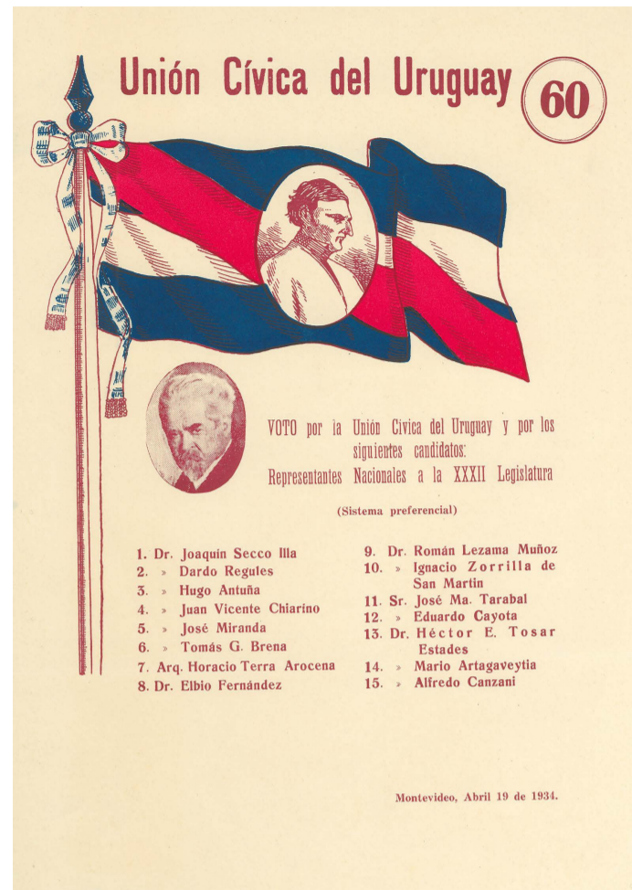
Fig. 10. Unión Cívica del Uruguay, lista 60, Montevideo, 19 de abril de 1934. Corte Electoral. Disponible en: https://www.gub.uy/corte-electoral/comunicacion/publicaciones/historial-hojas-votacion-0 .

No deja de ser llamativo que solo los cívicos usaran la efigie de Artigas en sus listas, puesto que desde fines del siglo XIX este referente icónico sería una “zona de concordia” entre los políticos colorados y nacionalistas, quienes apelaron a él en diversas ocasiones y escenarios, ya fuera desde el gobierno o la oposición 49 . Sin embargo, el Frente Amplio —una alianza de izquierdas y de ex integrantes de partidos fundacionales nacida en 1971— sería la primera fuerza en incluir a Artigas como una de las figuras clave de su partido, y su líder Líber Seregni se referiría a él en gran medida en sus alocuciones 50 .