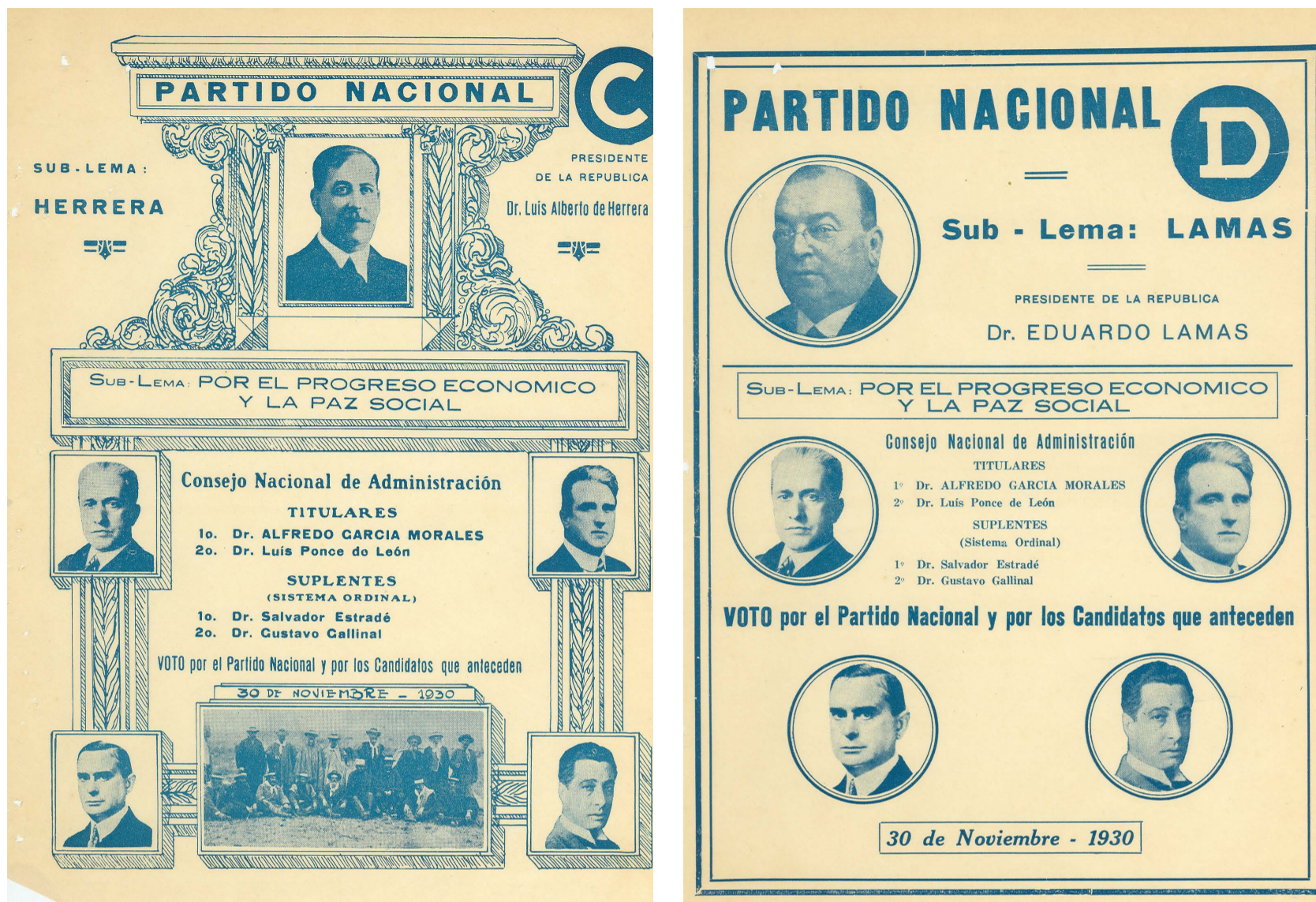
Fig. 5. Partido Nacional, lista C y lista D, 30 de noviembre de 1930, Corte Electoral. Disponible en: https://www.gub.uy/corte-electoral/comunicacion/publicaciones/historial-hojas-votacion-0 .

históricas, manteniéndose Saravia como símbolo hegemónico de los bandos en disputa. Herrera tampoco cedió a sus adversarios ni a Beltrán ni a Gómez 28 . Mientras tanto, los pabellones nacionales regresaron con profusión en el decorado de las listas. La escarapela uruguayo también sirvió como emblema para una imagen de Saravia 29 .