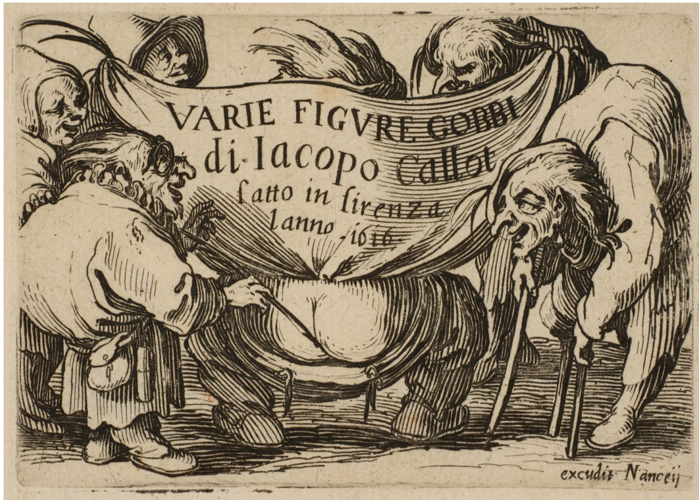
Fig. 5. Jacques Callot, frontispicio de Varie Figure Gobbi , suite appelée aussi Les Bossus , Les Pygmées , Les Nains Grotesques , 1616-1622. The Metropolitan Museum, no. 57.650.302 (1).