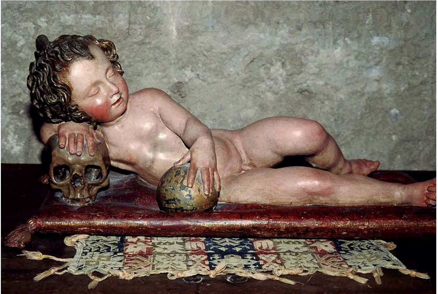
Fig. 3. Anónimo andaluz, Niño Jesús dormido s. XVII. Convento de Santa Paula, Sevilla. Licencia C.C.

dar sentido al reparto de las obras. Si acaso referir que en una “tercera quadra”, que podría ser la biblioteca, había “trecientos i veinte y tres cuerpos de libros de diferentes tratados de a folio y de a quarto y de a octavo” y “un estante grande donde estan los dhos libros con cinco paises de pinturas”. Allí mismo se encontraban “catorze quadros i payses de diferentes pinturas”, y aún había otra cuadra, “más afuera”, de cuyas paredes pendían “otros onze quadros Grandes de diferentes pinturas”, además de doce cuadros de Sibilas 6 . El aparato decorativo de este lugar se reforzó con “quatro contadores grandes de evano y marfil, dos contadorcillos pequeños encima y un tabernaculo con vn niño Jesus durmiendo sobre una muerte”, ello aparte de “seis piramides de jaspe que estan sobre los dhos contadores y dos jarras blancas de talauera” y “un escaparate de cedro” 7 (Fig. 3).