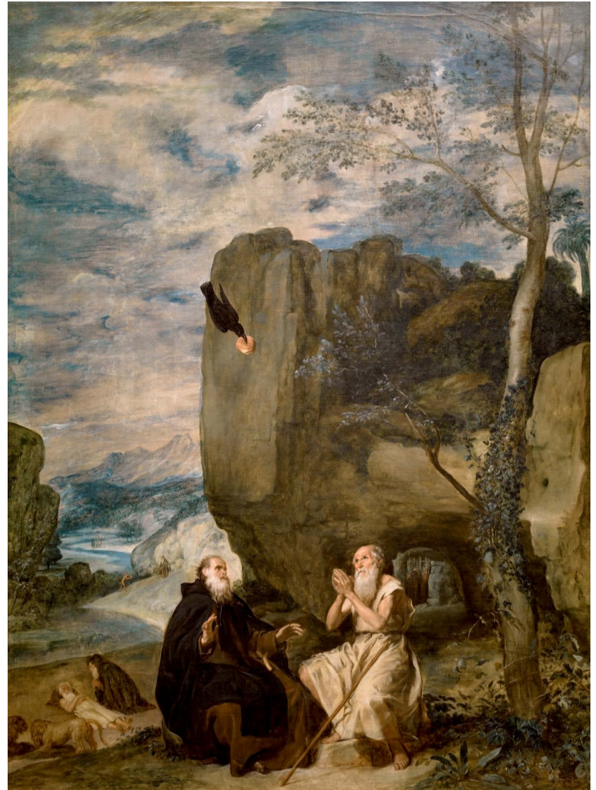
Fig. 6. Diego Velázquez, San Antonio Abad y san Pablo, primer ermitaño , h. 1634. Museo del Prado, Madrid, no. cat. P001169.

Volviendo al oratorio, creo preciso referir el importante conjunto de elementos suntuarios para el estímulo devocional y el pertinente servicio litúrgico. Ante todo, “el ornamento de desir misa” y entre la “plata de capilla”, el cáliz y la patena. Además, “una lámina de la Consepçion”, otras “dos láminas de la consepçion con guarniçion de plata y otras dos láminas pintadas en concha” con la misma guarnición argétea. También