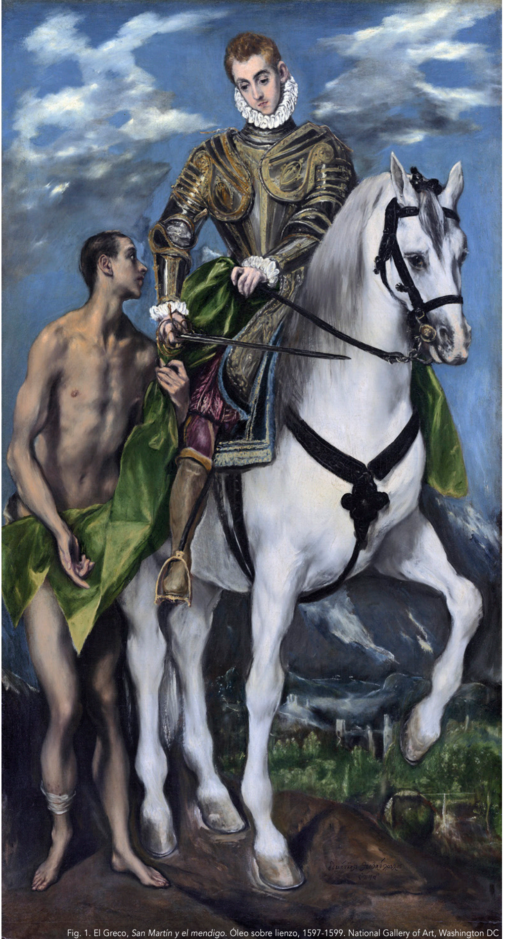
Fig. 1. El Greco, San Martín y el mendigo . Óleo sobre lienzo, 1597-1599. National Gallery of Art, Washington DC