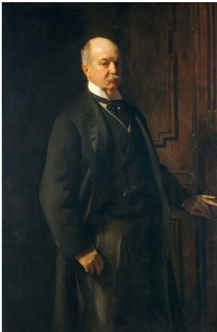
Fig. 3. John Singer Sargent, Retrato de Peter A. B. Widener . Óleo sobre lienzo, 1902. Widener Collection, National Gallery of Art, Washington DC.

Había pasado un año y tras haber superado las trabas surgidas respecto a la legítima propiedad de los cuadros y la capilla, haber reunido aquellos documentos que a nivel oficial indicaban que ni el Gobierno ni la