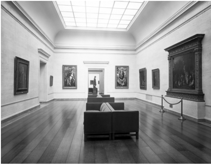
Fig. 6. Las dos obras del Greco expuestas en la sala 22 de la National Gallery of Art de Washington DC, en torno a los años cuarenta del siglo XX.

A diferencia de Peter, Joseph Widener era consciente del rol público de su colección. En este sentido llevaba años barajando la idea de donar parte de su colección en memoria de su padre a la Galería Nacional que se había creado en Washington gracias al interés personal y al apoyo económico de Andrew W. Mellon 38 y que abrió sus puertas en marzo de 1941.