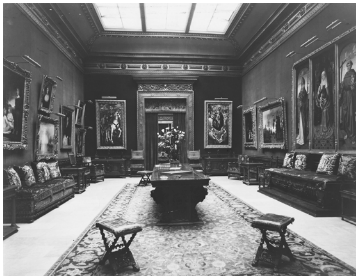
Fig. 5. Las obras del Greco dentro de la colección Widener en Lynnewood Hall, Philadelphia.

Dicha compra sin duda produjo a los Widener una gran satisfacción personal, tal y como se refleja a través de las noticias de Bernard Berenson, el cual recordaba que tanto Peter como su hijo Joseph estaban entusiasmados por haber adquirido aquellos El Greco, lo que venía a significar que finalmente la tortilla había dado la vuelta a su favor, en lo que arte y coleccionismo respectaba 37 .