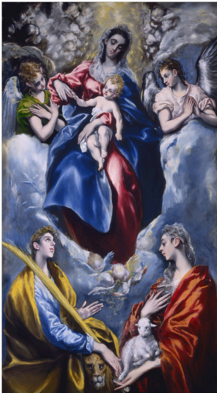
Fig. 2. El Greco, Virgen con el Niño y las santas Martina e Inés . Óleo sobre lienzo, 1597-1599. National Gallery of Art, Washington DC.

A los pies de la tela, se encuentran seis santos que muestran expresiones de sorpresa, admiración o que incluso hasta interactúan con el público de cara a tan prodigioso evento. San Juan Bautista y San Juan