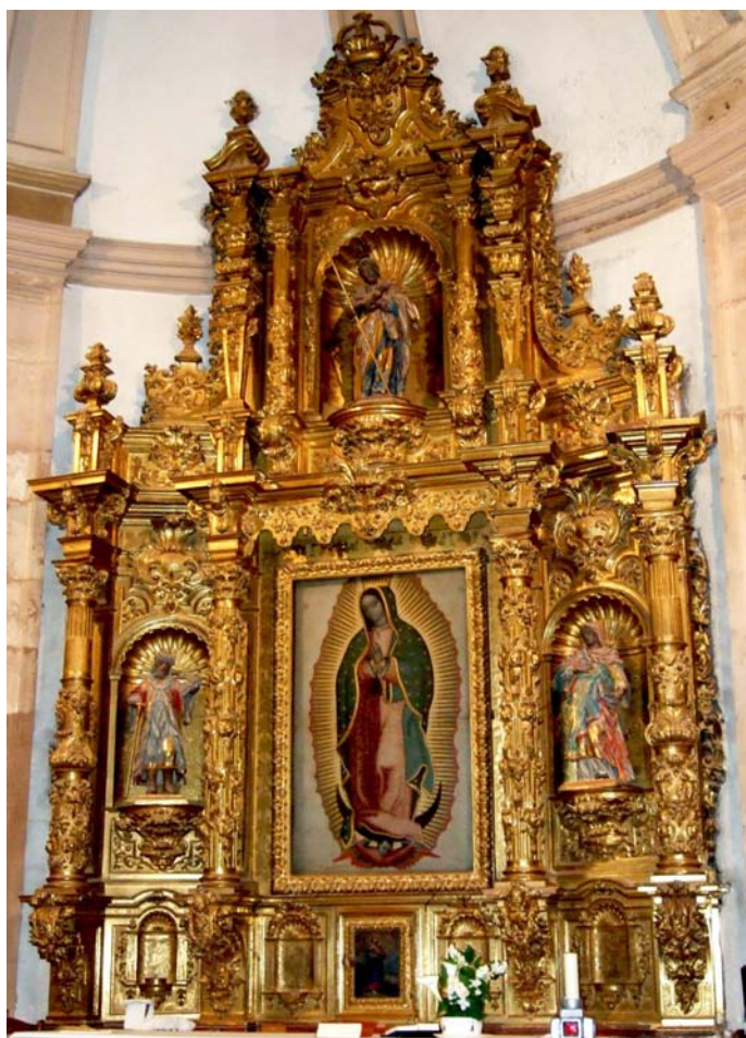
Fig. 5. Retablo Mayor presidido por lienzo de la Virgen de Guadalupe firmado por Miguel Cabrera en 1754.

y en la fragata El Júpiter, un cajoncito forrado en cuero y marcado como al margen, con peso bruto de tres arrobas, diez libras y neto, que contiene varios lienzos de pintura , advirtiendo el oficial real que lo inspeccionó en Cádiz que el cajoncito pesa tres arrobas en bruto e incluye imágenes de devoción de marfil con peso de una arroba y con tres marcos y tres onzas de plata labrada y dos libras de loza de China 23 .