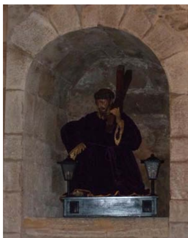
Fig. 3. Hornacina labrada en el muro testero de la capilla de la Virgen de Guadalupe para las andas de Jesús Nazareno.

muy decente a Nuestra Señora de Guadalupe, haciéndole su retablo correspondiente y dotándola... con diferentes alhajas para el mayor adorno y decencia; por lo cual solicitaba el correspondiente permiso para su construcción.