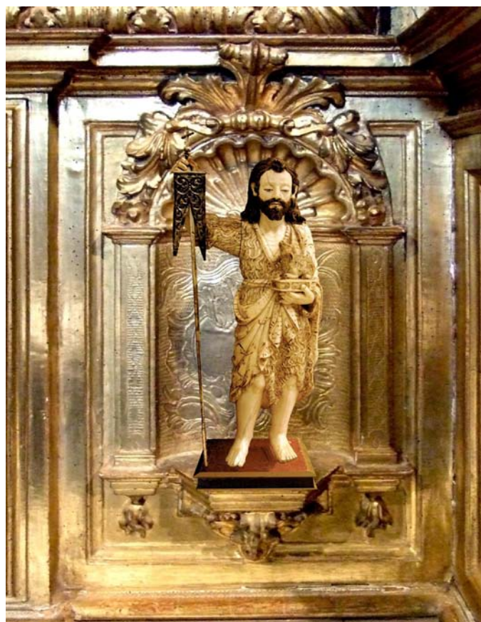
Fig. 8. Reconstrucción del banco del retablo de la Virgen de Guadalupe con una de las figuras de marfil hispano-filipinas remitidas desde México por Manuel Silvestre, hoy depositada en el Museo Diocesano de Calahorra.

Concluidos todos los trámites burocráticos encaminados a la constitución de su capellanía, quiso Manuel Silvestre agradecer al deán y cabildo de la catedral de Santo Domingo de la Calzada sus muchas atenciones y facilidades dadas para su fundación; para lo cual les remitió en el navío nombrado El Castilla, capitana de la flota de 1763, ...dos cajones, cabeceados con cuero, marcados y numerados como al margen, rotulados "AL ILUSTRÍSIMO SEÑOR DON ANDRÉS DE PORRAS, OBISPO DE CALAHORRA Y LA CALZADA Y, EN SU FALTA, AL QUE ESTUVIERE; Y, EN SEDE