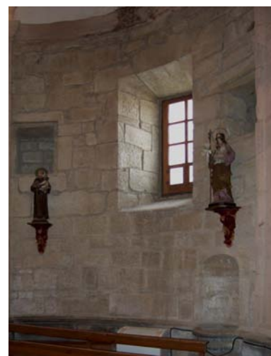
Fig. 4. Interior de la capilla y reja de acceso con escudo heráldico de su patrono Manuel Silvestre Pérez de Camino.