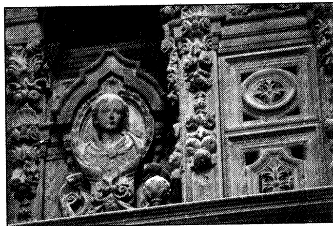
Fig. 2. Detalle de uno de los medallones que decoran los laterales del segundo cuerpo de la fachada externa del órgano del Evangelio.

La decoración del segundo cuerpo se realiza con casetones decorados con motivos vegetales y 4 medallones con bustos de santas mayores que el natural, situados en las calles laterales (Fig. 2) donde también resalta la balconada central sostenida por dos telamones cada una, rematándose con un medallón cuyo personaje no puede identificarse por estar