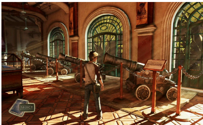
Fig. 3. Interior del Museo Marítimo de Cartagena (Captura de pantalla de Uncharted 3 , subida por MAT a Mobygames. Derechos de Sony, disponible en https://www.mobygames.com/game/ps3/uncharted-3-drakes-deception/screenshots/gameShotId,531804/ ).

de estos edificios, creando posibilidades menos evidentes y mucho más gratificantes desde nuestro ámbito de estudio. Evidentemente, eso no resta valor a los casos citados hasta ahora; un videojuego es, ante todo, un producto de ocio que debe entretener. Desde ese prisma, mucho de los juegos aquí nombrados son exponentes de su género. Independientemente de eso, la visión que dan de los museos resulta algo desesperanzadora: no son interesantes por su contenido y su relación con la sociedad, sino por los misterios y secretos que esconden. Además, el objeto patrimonial solo es una herramienta más, por lo que su integridad física resulta secundaria.