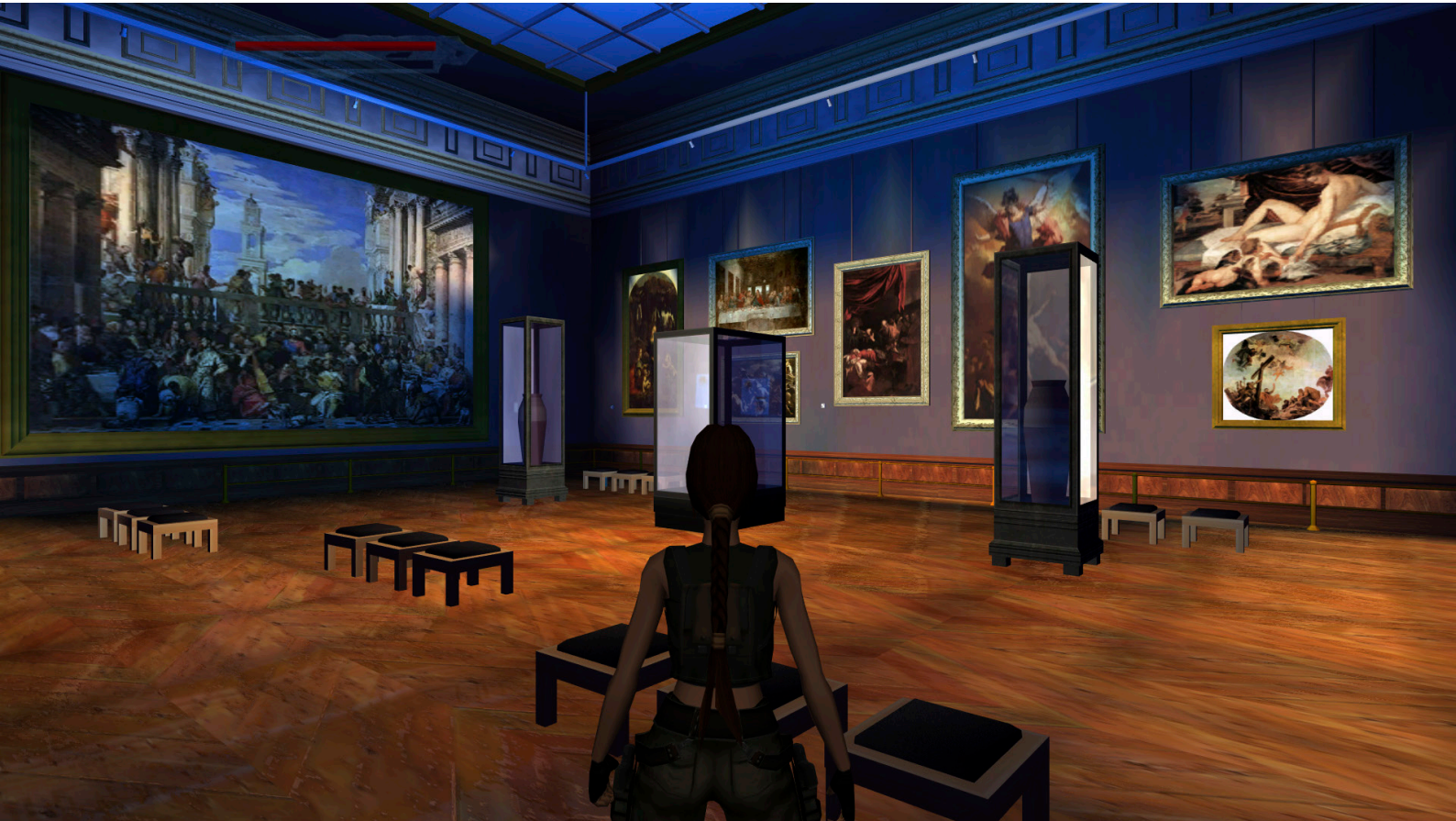
Fig.1. Captura de pantalla del interior del Museo del Louvre ( Tomb Raider: El ángel de la oscuridad . Captura del autor. Derechos de Core Desing y Eidos Interactive).