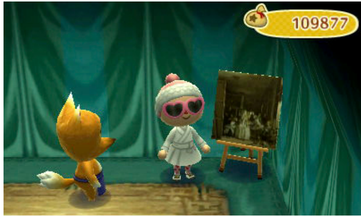
Fig. 5. Protagonista de Animal Crossing posando frente a una falsificación de Las meninas en la tienda de Ladino (Captura de pantalla de Animal Crossing. New Leaf subida por Jennifer Christensen en su web sososttris.com . Derechos de Nintendo, disponible en: http://www.sososttris.com/2013/03/31/animal-crossing-new-leaf-days-142-144/ ).

periodos y nacionalidades (arte antiguo de Egipto, Grecia y Roma e incluso un dogu prehistórico japonés, pinturas de artistas ingleses, neerlandeses, españoles, italianos y franceses). 25 Para adquirirlas, debemos contactar con Ladino, un astuto zorro que establecerá una carpa en el pueblo un día aleatorio de cada semana, de 10:00 a 12:00 de la mañana. 26 La elección de este animal no es para nada casual; parece representar con cierta sorna la imagen que se suele tener del sistema del arte, y es que entre las obras a la venta hay caras falsificaciones, razón por la que debemos agudizar nuestros sentidos. ¿Y qué hacemos para no ser estafados? Aquí entra un claro componente educativo, ya que para asegurarnos de comprar un original debemos conocer la obra real, buscar una imagen y compararla con las presentes en la carpa en búsqueda de diferencias. Por ejemplo, en la falsificación de Las Meninas el tamaño de la infanta Margarita multiplica a la del Museo del Prado. Con esta tarea se induce al jugador a familiarizarse con las obras de artes reales si quiere ahorrarse esfuerzos innecesarios en el juego. 27