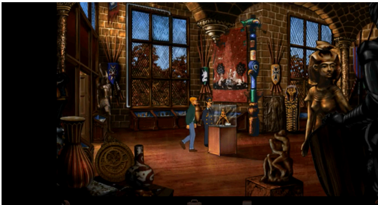
Fig. 2. Captura de pantalla del interior del Museo Crune ( Broken Sword: la leyenda de los templarios . Captura del autor. Derechos de Revolution Software Ltd.).

el robo de un misterioso trípode que nuestros enemigos persiguen. Cuando los ladrones lleguen, el protagonista empujará hacia ellos otra de las piezas del museo, un tótem de varios metros de altura, para evitar que culminen su plan. Finalmente, es gracias a la intervención de Nicole Collard cuando logramos nuestro propósito. En realidad, no es que hayamos evitado un robo, sino que a la mañana siguiente despertaremos con el trípode en casa: esta herramienta será vital para desentrañar todos los misterios del juego. En pocos minutos, y con asombrosa facilidad, nos hemos infiltrado en un museo, causado daño a las obras e incluso robado una pieza que pretendíamos proteger.