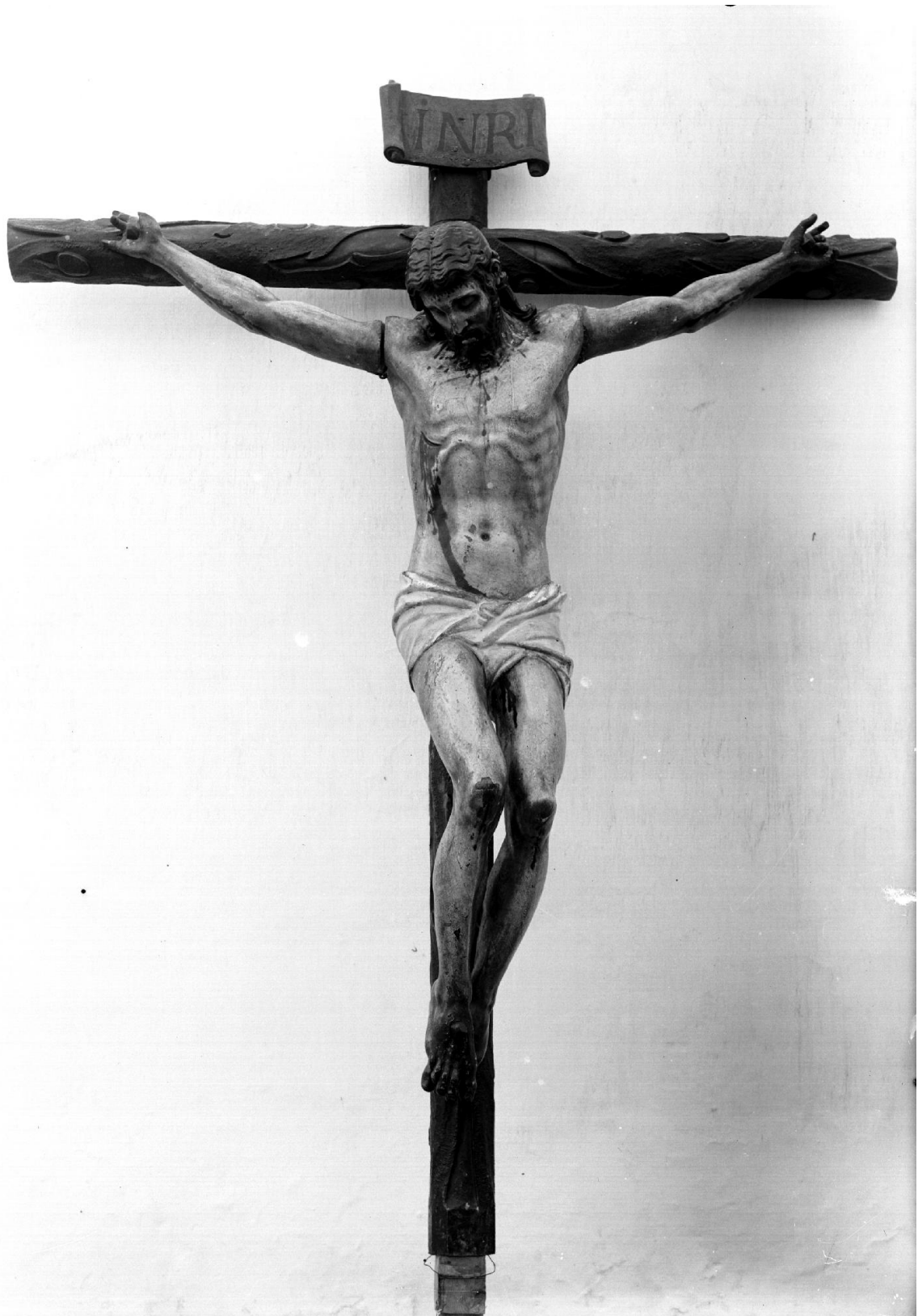
Figura 3: Fotografía antigua del Cristo de la Buena Muerte donde se aprecian los brazos articulados