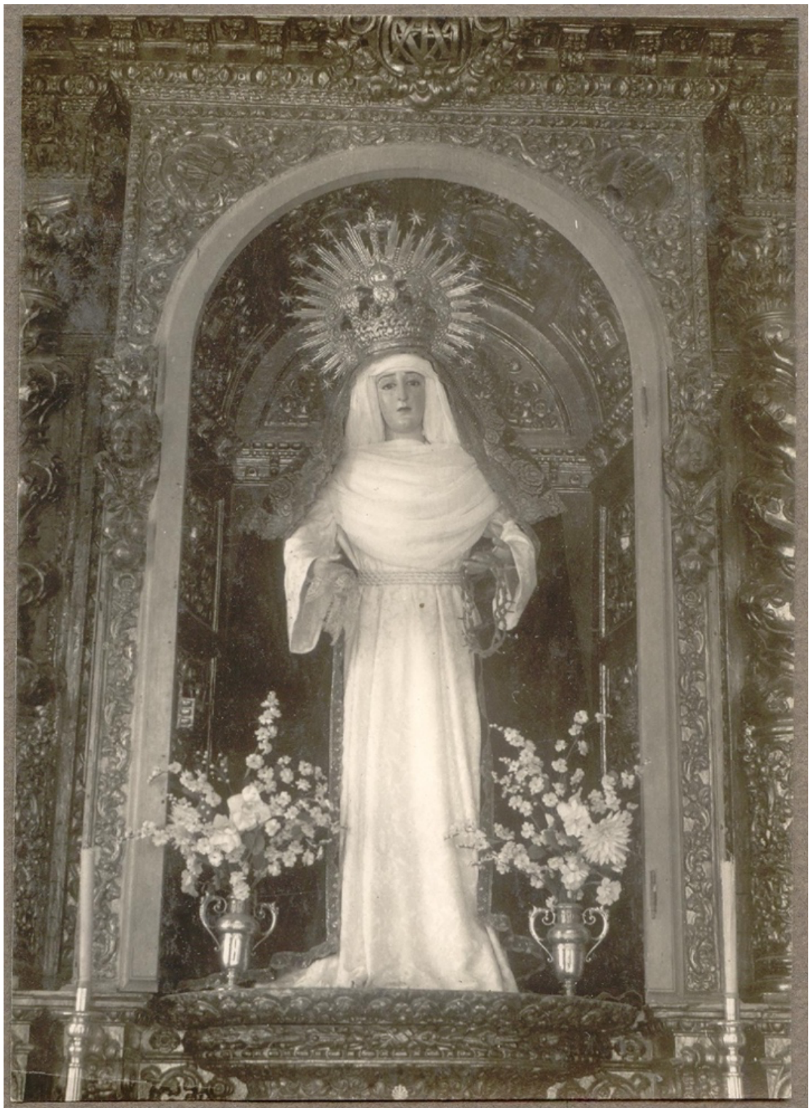
Figura 2: Fotografía antigua de la dolorosa de la Soledad