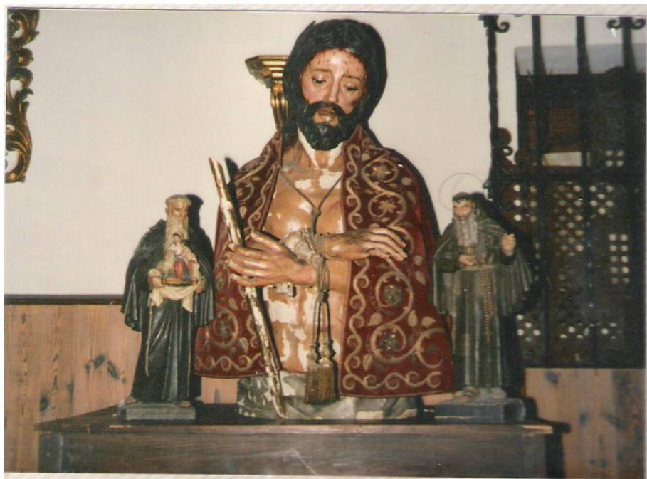
Figura 2. José Montes de Oca y León (atrib.). Ecce Homo , ca. 1730, Convento de Santa Clara de Carmona.

Fotografía de la pieza en el Convento de Capuchinos tomada hacia 1990.