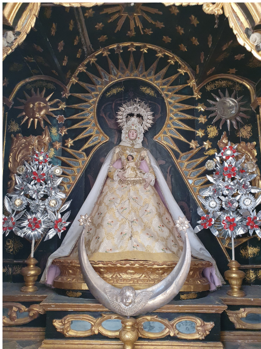
Figura 4. Virgen con el Niño o Virgen del Rosario, fotografía actual en el Convento de Santa Clara de Carmona