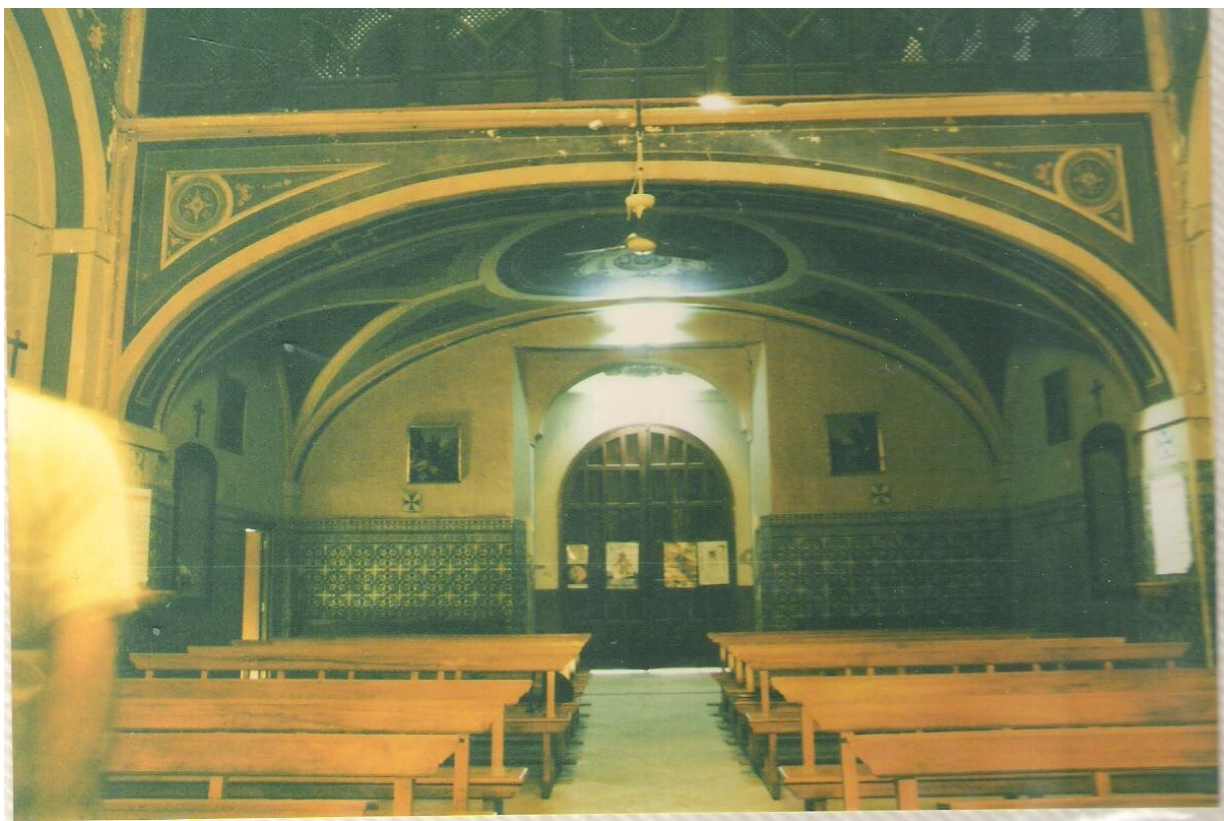
Figura 5. Estado de las hornacinas bajo el coro alto previo a las obras de restauración del Convento de Capuchinos de Sevilla, año 1990