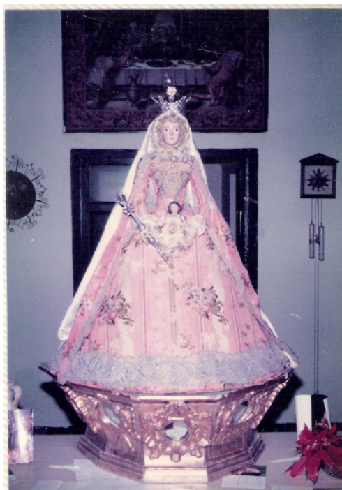
Figura 3. Virgen con el Niño o Virgen del Rosario , Convento de Capuchinos de Sevilla, fotografía tomada hacia 1990.