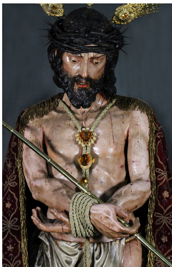
Figura 8. José Montes de Oca y León. Ecce Homo , ca. 1730. Iglesia de San Pablo de Cádiz.

Iconográficamente, podemos establecer paralelos con el célebre Ecce Homo de cuerpo entero de la Iglesia de la Conversión de San Pablo de la capital gaditana (Fig. 8), así como con el de medio cuerpo que se encuentra en la capilla de San Francisco de la Catedral de Sevilla 23 , ambos fechados en torno a 1730. El modelo iconográfico, y posición corporal, así como el tratamiento del sudario y el estudio anatómico, tienen bastantes similitudes, aunque señalamos también algunas diferencias entre ellos que pueden hacer dudar de la correcta datación o atribución. Por ejemplo, el Ecce Homo catedralicio 24 posee una posición de los brazos y manos muy expresiva con las muñecas dobladas hacia abajo, la cual no aparece ni en el carmonense ni en el gaditano, los cuales tienen una posición aún más similar. Tanto el de la capilla de San Francisco como el que aquí tratamos son imágenes de medio cuerpo, con un modelo muy similar y que se entronca con la iconografía granadina de oratorio y devoción popular, tal y como hemos mencionado anteriormente (Fig. 9).