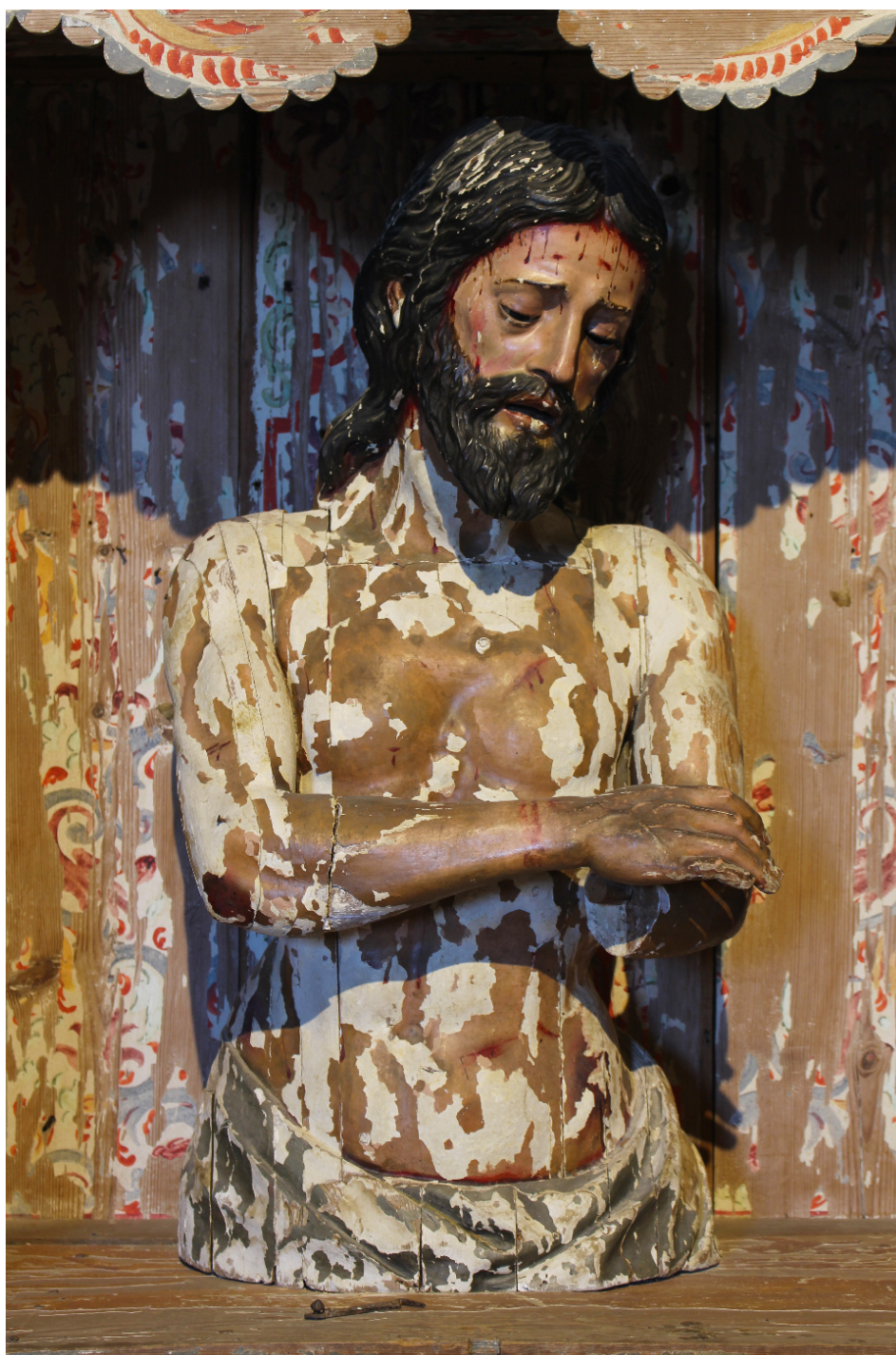
Figura 1. José Montes de Oca y León (atrib.). Ecce Homo , ca. 1730, Convento de Santa Clara de Carmona. Estado antes de la restauración de 2023.

como veremos a continuación, el motivo de que haya pasado desapercibido para la historiografía especializada de las últimas décadas.