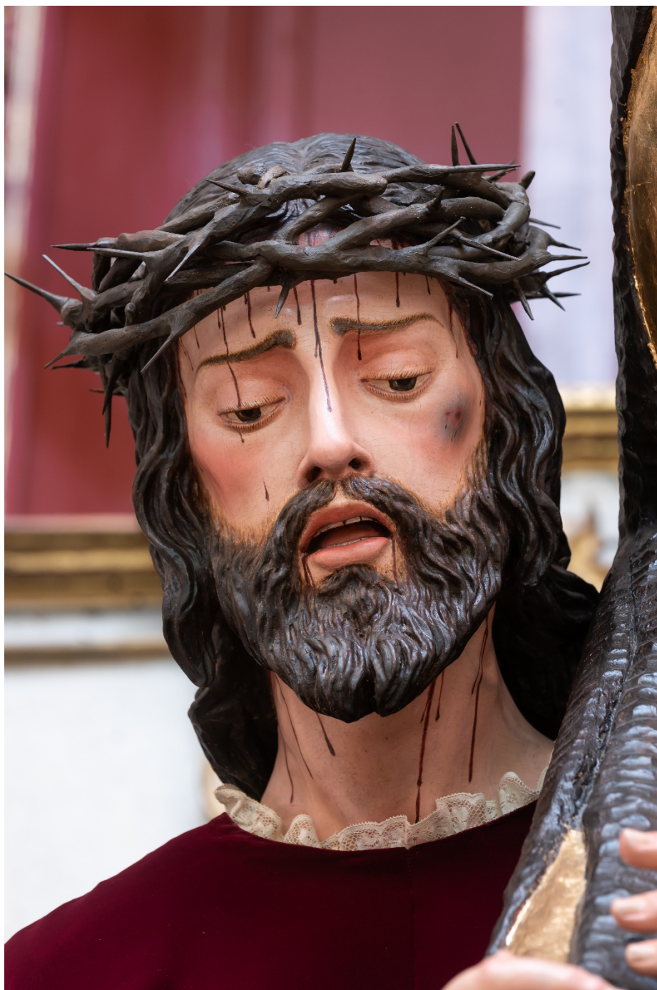
Fotografía: Daniel Salvador-Almeida.