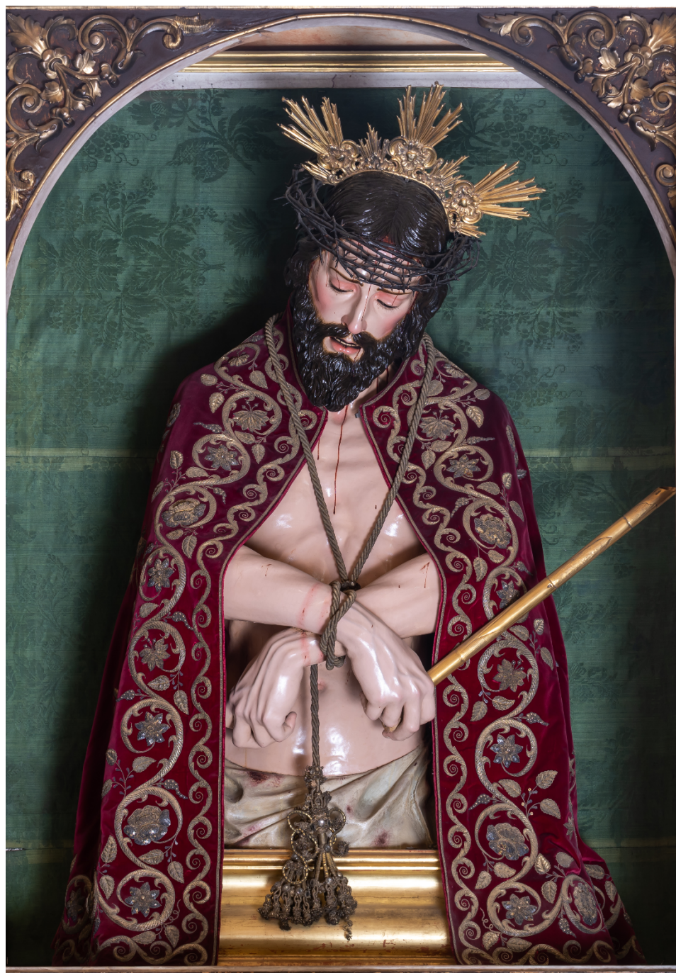
Figura 9. José Montes de Oca y León (atrib.). Ecce Homo , ca. 1730. Capilla de San Francisco, Catedral de Sevilla.