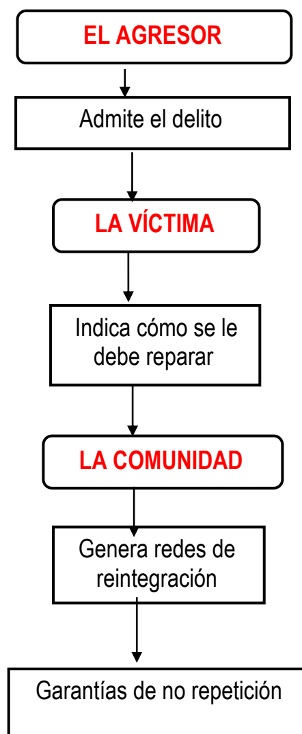
Figura 3. Croquis de la justicia restaurativa ante delitos menores del infractor juvenil con base