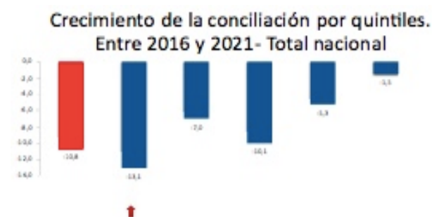
Figura 4. Comportamiento de la justicia restaurativa según funcionalidad del modelo