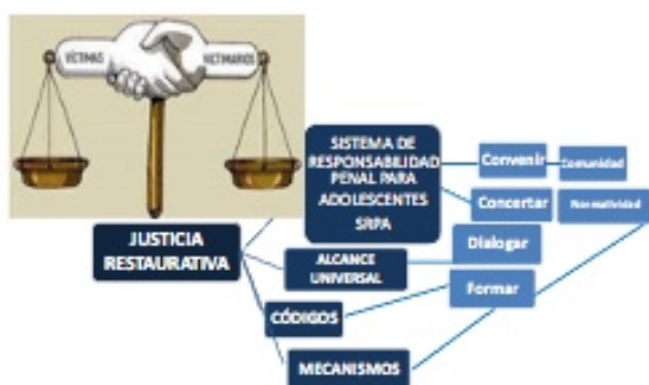
Figura 2. Corresponsabilidad Estado-comunidad-familia-víctimas-menores infractores