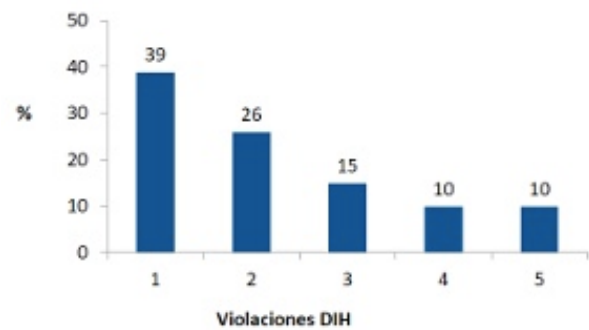
Figura 4. Asignación de responsabilidades a uniformados.