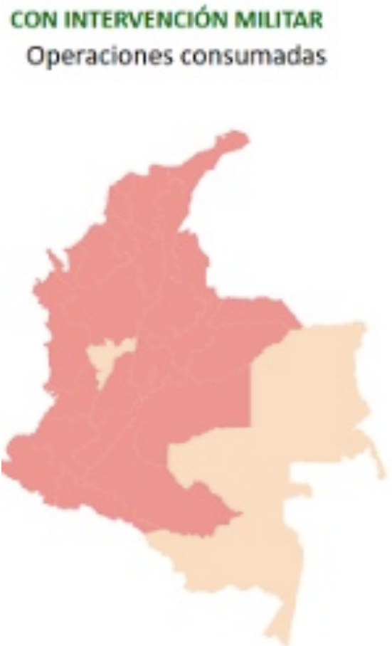
Figura 2. Operaciones militares en zonas en conflicto.