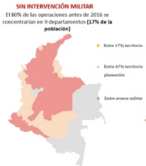
Figura 1. Operaciones militares en zonas en conflicto