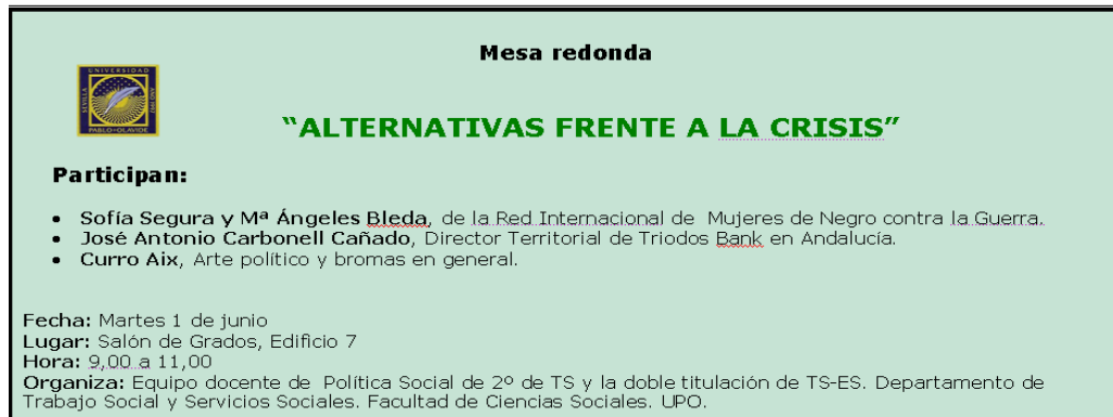
FIGURA 2. Tarjetón que se diseñó para invitar a la comunidad universitaria a la mesa redonda

Desde la Red de Mujeres de Negro nos presentaron cuál es su filosofía como grupo antimilitarista y feminista y que acciones realizan para denunciar esta Crisis que ellas definen como crisis económica, ecológica, social, de valores y pensamiento (Mujeres de Negro, Agenda 2011), acompañada de un reportaje audiovisual de las últimas acciones que habían realizado denunciado la especulación de la banca.